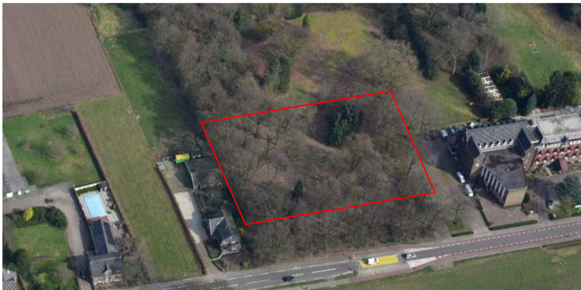
Globale ligging van het plangebied

De in dit Beeldkwaliteitsplan geformuleerde criteria worden als aanvulling op de welstandsnota Horst aan de Maas door de gemeenteraad vastgesteld.