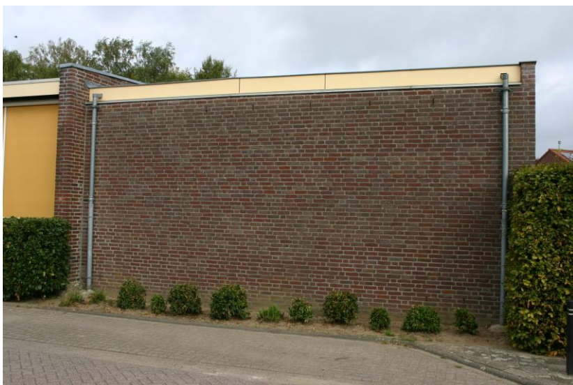
Figuur 7. Open stootvoegen op circa 3 meter hoogte.