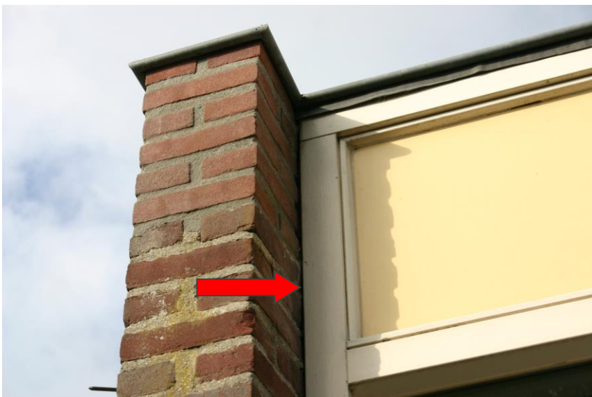
Figuur 4. Kier tussen kozijn en metselwerk (aangeduid met een rode pijl).