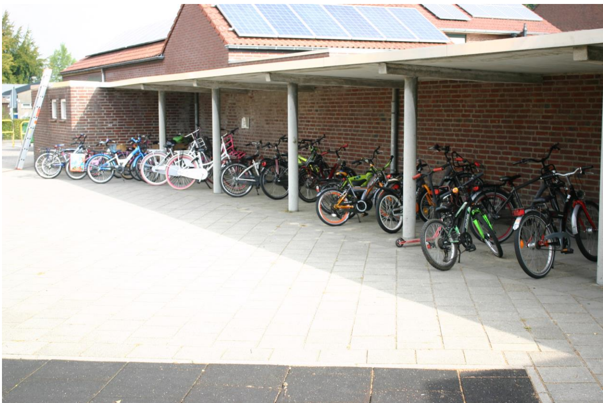
Figuur 2. De fietsenstalling en berging (het kleine gebouw waar een ladder tegenaan is geplaatst).