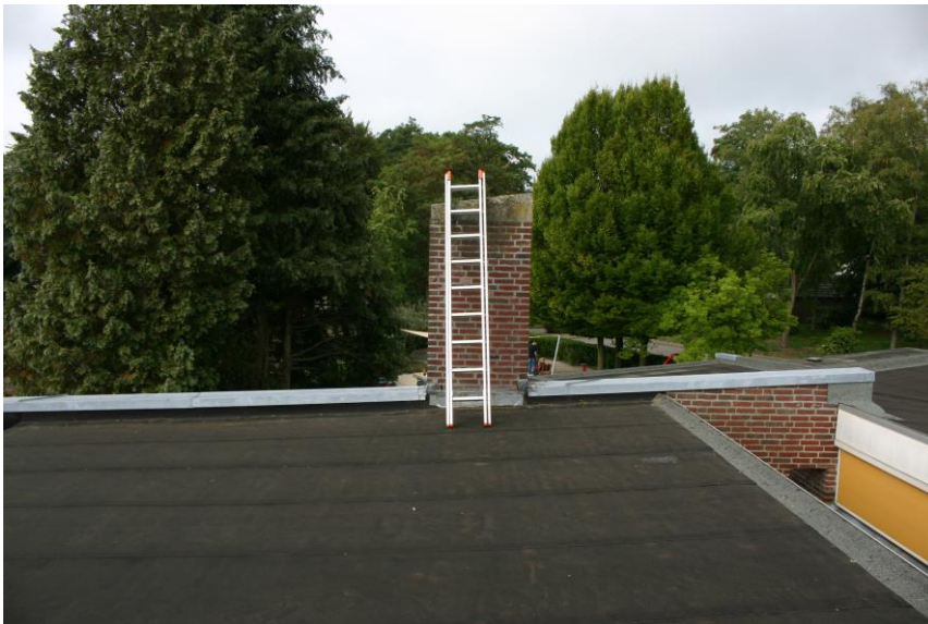
Figuur 3. De geïnspecteerde schoorsteen.

In de kelder van het hoofdgebouw zijn geen vleermuisuitwerpselen aanwezig. Wegens het vrijwel dagelijkse gebruik van de kelder is deze ook niet geschikt om als vleermuisenverblijf te dienen. Ook de overige grote ruimten in het schoolgebouw, de berging en de fietsenstalling zijn, wegens (vrijwel) dagelijks gebruik, ongeschikt voor vleermuizen. De gebouwen in het plangebied hebben platte bitumen daken. Hierin zijn geen openingen die vogelnesten kunnen herbergen. Verder staat er op het hoofdgebouw een niet meer in gebruik zijnde schoorsteen. Deze is tijdens het veldbezoek van bovenaf geïnspecteerd en vogelnesten of vleermuisuitwerpselen bleken daarin afwezig te zijn (zie figuur 3). Op een aantal plaatsen zijn er echter kieren tussen kozijnen en metselwerk aanwezig, die ruim genoeg zijn voor vleermuizen (zie figuur 4). Ook bevat het hoofdgebouw veel kieren aan de onderzijde van de op meerdere plaatsen aanwezige boeiboorden (zie figuren 5 en 6). Verder is de zuidgevel van het hoofdgebouw voorzien van een zestal open stootvoegen op circa 3 meter hoogte (zie figuur 7). Al deze kieren, spleten en open stootvoegen zijn tijdens het veldbezoek geïnspecteerd en nergens werden vleermuisuitwerpselen aangetroffen. Wegens het grote aantal openingen is het echter niet reëel hieruit te concluderen dat er geen vleermuisverblijven aanwezig zijn; het is namelijk mogelijk dat er uitwerpselen door regen of wind zijn verdwenen.