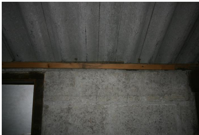
Figuur 4.2.1. Het grootste deel van de schuur in het plangebied heeft een enkelwandig dak.