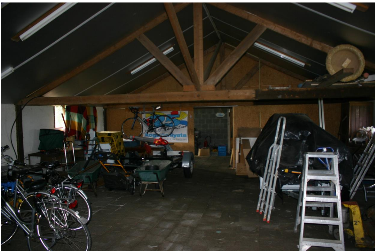
Figuur 4.2.2. Het buiten het plangebied gelegen deel van de schuur en een klein deel van de in het plangebied gelegen schuur bevat een gladwandige plafondbetimmering.

De binnengevels van de schuur bestaan uit metselwerk, de buitengevels bestaan uit gepotdekselde planken. Omdat er tussen beide gevels glaswol zit die tegen de planken drukt (er is dus geen