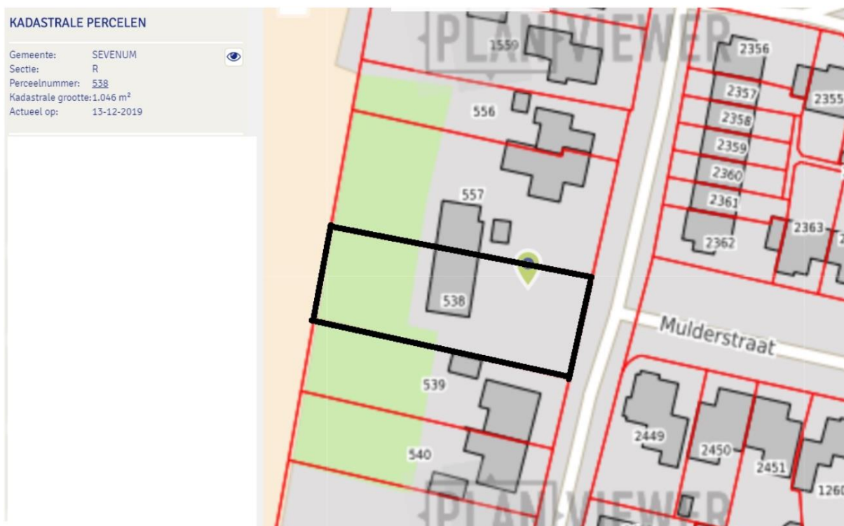
Figuur 4.1. Ligging van het plangebied (zwart omlijnd).

Het plangebied is weergegeven in figuur 4.1. Het maakt momenteel nog deel uit van het perceel bij Luttelseweg 12 en het is ingericht als deel van een schuur en een daarachter gelegen deel van een wei met enkele appel- en kersbomen. Hier groeien soorten als Engels raaigras, Jacobkruiskruid, witte klaver, melganzenvoet, zachte ooievaarsbek, paardenbloem en biggenkruid. Voor de schuur ligt een akker die is ingezaaid met een bloemenmengsel. Hier groeien soorten als gerst, ijzerhard, korenbloem, Canadese fijnstraal, klaproos, korenbloem, rode klaver, margriet, raapzaad en exotische bloemrijke kruiden als Phacelia. Ook staat er een beukenhaag en groeien er enkele vlinderstuiken, rode kornoelje en twee honingbomen.