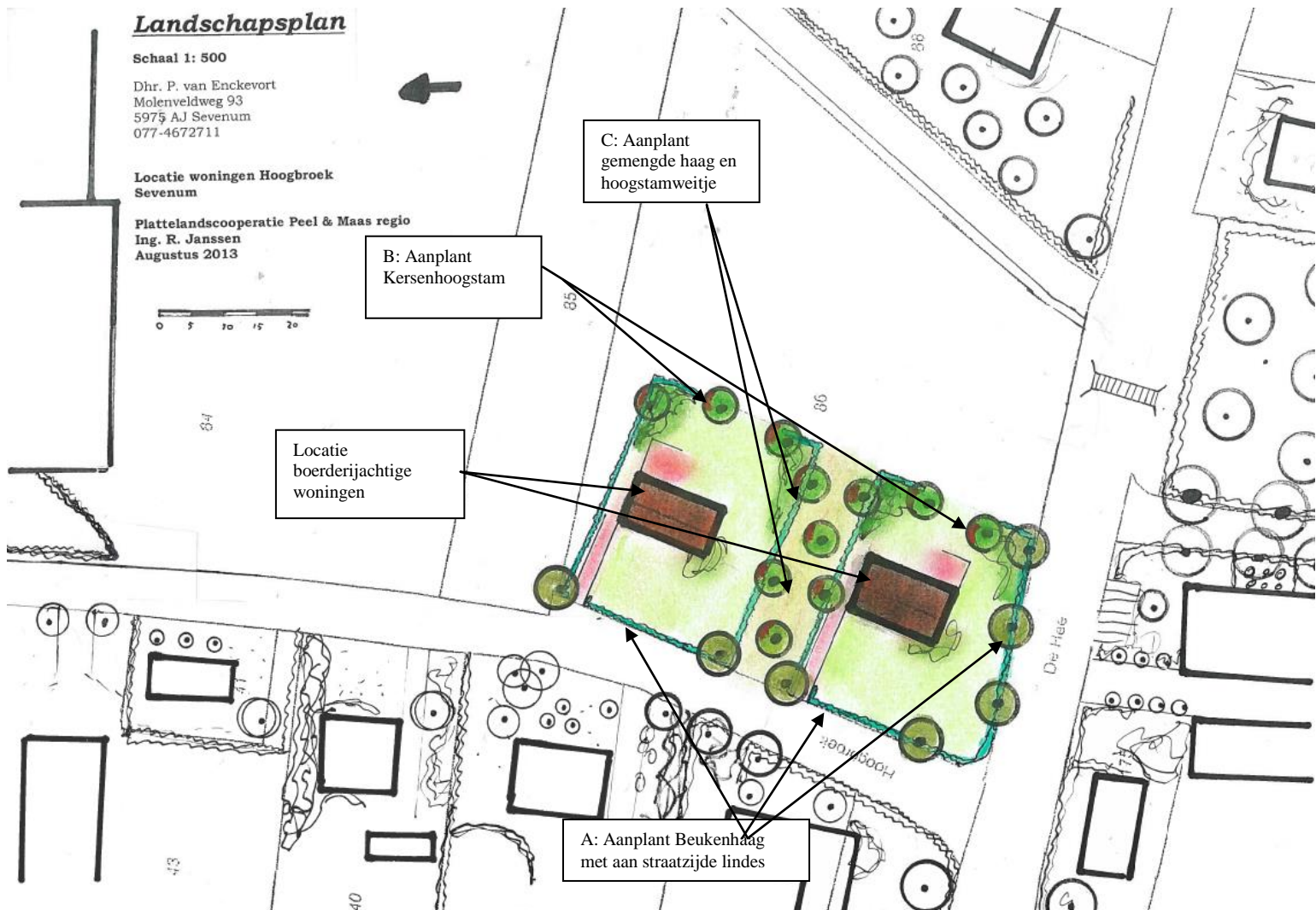
Figuur 3 Landschapsplan

Zie onderstaand het plan en beplantingslijst.