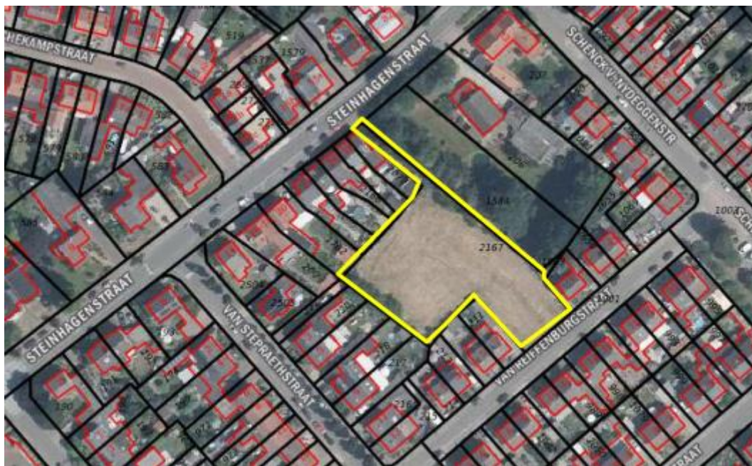
Figuur 4.1. Het plangebied (geel omlijnd).

Het plangebied is weergegeven in figuur 4.1. Het is gelegen in het noordoosten van de dorpskern van Sevenum. De zuidoostzijde en de noordwestzijde van het plangebied zijn begrensd door resp. de Van Reiffenburgstraat en de Steinhagenstraat. De overige zijdes grenzen aan achtertuinen. Het plangebied zelf is een braakliggend terrein, bestaande uit voornamelijk ruig grasveld met aan de zuidwestzijde een rij met jonge wilgenopslag (zie foto's voorzijde). In het plangebied zijn soorten aanwezig als smalle weegbree, mahoniestruik, zachte ooievaarsbek, jacobskruiskruid, duinriet, grote brandnetel, vogelmuur, harig wilgenroosje, vingerhoedskruid, reigersbek, bezemkruiskruid, bosaardbei, vogelwikke, krokus, vlinderstruik en paardenbloem.