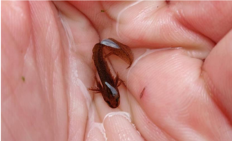
Figuur 4.4.1. Larve van de kleine watersalamander.

de kleine watersalamander is het ook mogelijk dat enkele andere algemene amfibieënsoorten, zoals de bruine kikker, delen van het plangebied als landhabitat gebruiken. Streng beschermde amfibieënsoorten zijn echter afwezig. Voor reptielen zijn er in het plangebied geen geschikte opwarmplaatsen aanwezig, zoals stenen, muurtjes of woelplekken van hoefdieren. De vegetatie in het plangebied is soortenarm en er zijn weinig nectarplanten en luwte aanwezig waardoor vlinders niet in het plangebied te verwachten zijn. Overige soortgroepen, die beschermd zijn onder de Wnb, zijn eveneens niet te verwachten in het plangebied. Tabel 4.4 geeft een overzicht van de beschermde soorten die (mogelijk) voortplantingsplaatsen en rustplaatsen in het plangebied hebben.