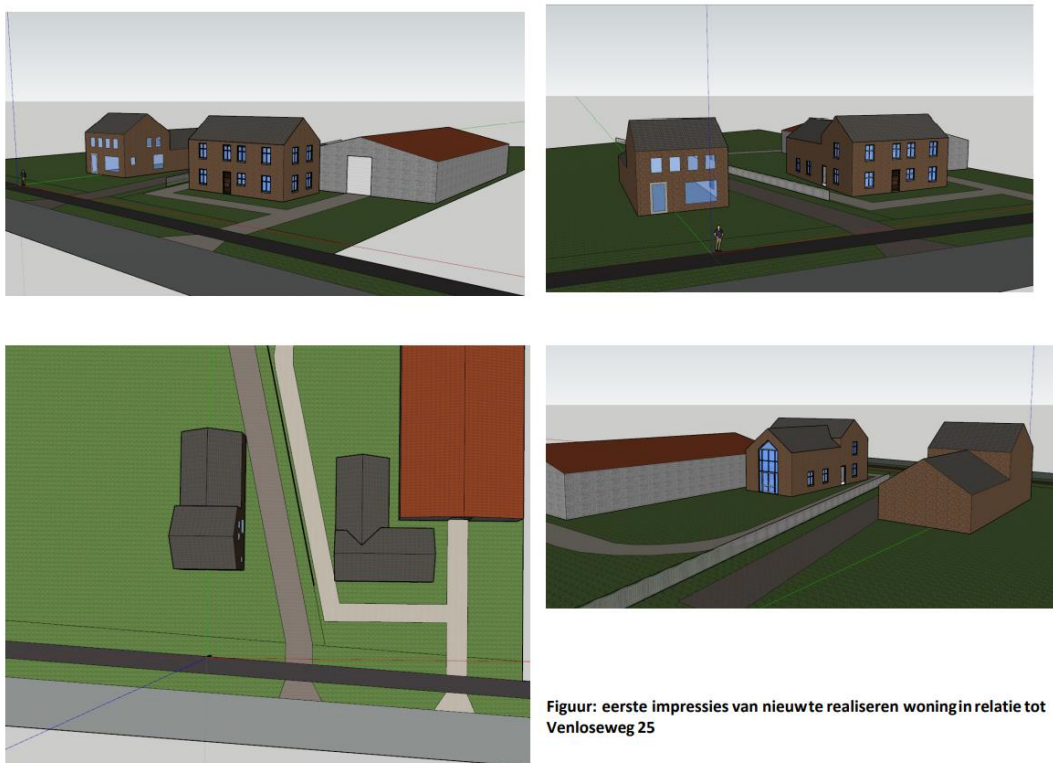
Figuur: eerste impressies van nieuw te realiseren woning in relatie tot Venloseweg 25

Op de locatie worden een nieuwe woning met parkeerplaatsen gerealiseerd. Daarnaast worden er verharding en nieuw groen aangelegd. Hiertoe zal een deel van de grasvegetatie worden verwijderd. De heg van haagbeuk in de westelijke hoek en een walnotenboom worden verplaatst. Een impressie van de nieuw te realiseren woning (in relatie tot Venloseweg 25) is te zien in figuur 3.1.