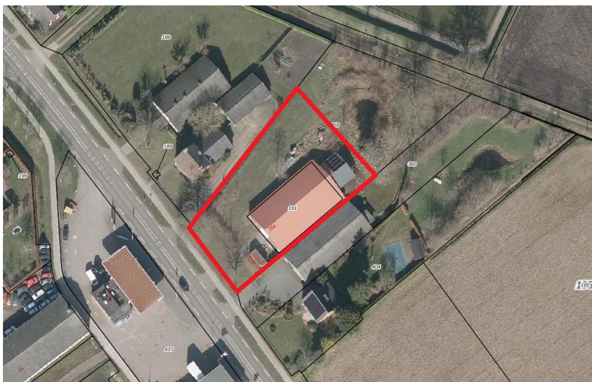
Figuur 4.1.1. Het plangebied (rood omlijnd).

In het plangebied bevindt zich een loods (deze blijft behouden en valt daarmee buiten het feitelijke plangebied). De rest van het plangebied bestaat grotendeels uit grasland met daarin twee walnotenbomen, grote brandnetel, braam, nijlganzenvoet, ridderzuring, boerenwormkruid, kleine berenklauw, Canadese fijnstraal, rode klaver, smalle weegbree en paardenbloem. In de westelijke hoek bevindt zich een heg van haagbeuk en een zomereik.