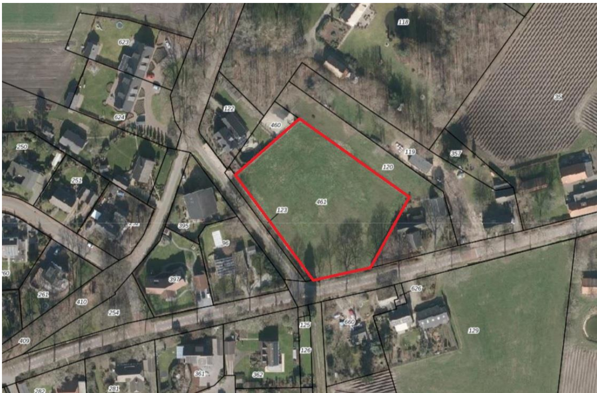
Figuur 4.1. Het plangebied (rood omlijnd).

Het plangebied zelf bestaat uit een omheinde wei, die tijdens het veldbezoek niet werd begraasd. In het plangebied komen soorten voor als vogelmuur, grote brandnetel, paardenbloem, herderstasje, kruipende boterbloem, ridderzuring en akkerdistel.