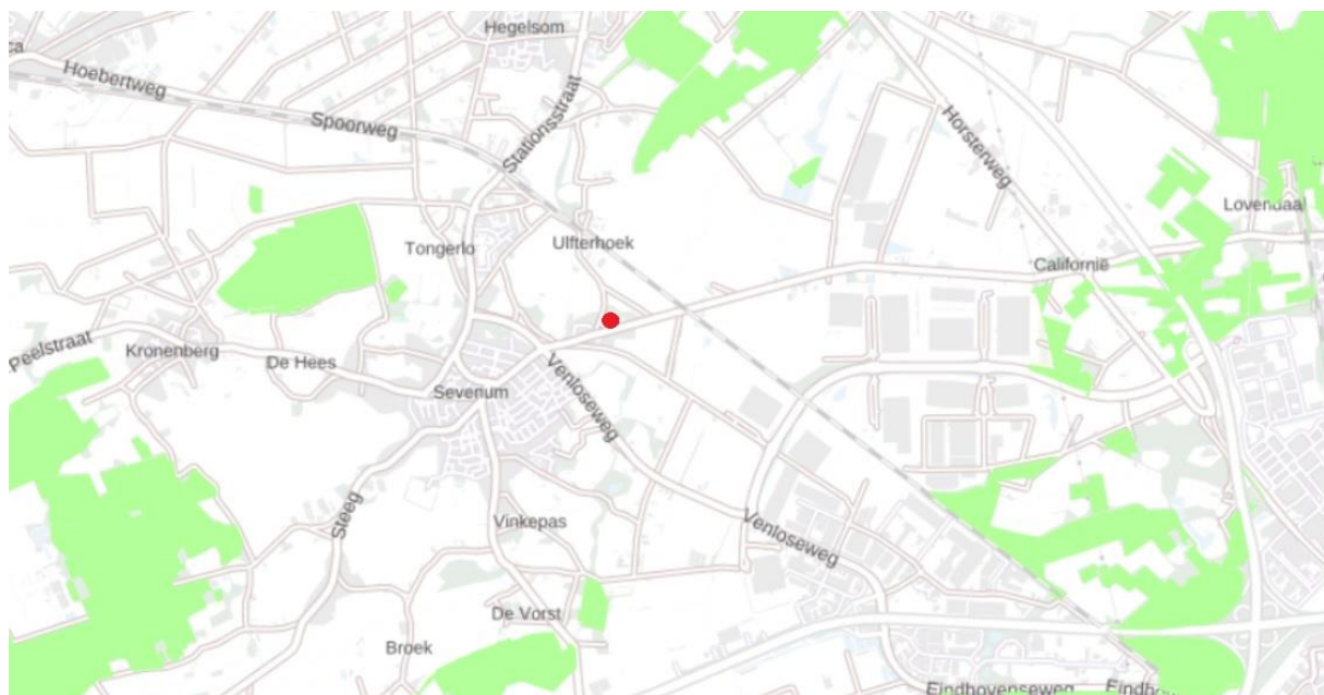
Figuur 4.3. Globale ligging van het plangebied (rode stip) ten opzichte van het NNN (Goudgroene natuurzone; groen gearceerd).

Het plangebied ligt op circa 1,3 kilometer afstand van het dichtstbijzijnde onderdeel van de Goudgroene Natuurzone, het Limburgse deel van Natuurnetwerk Nederland (NNN; zie figuur 4.3).