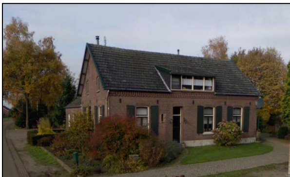
Afbeelding 5. Impressie voormalige woning