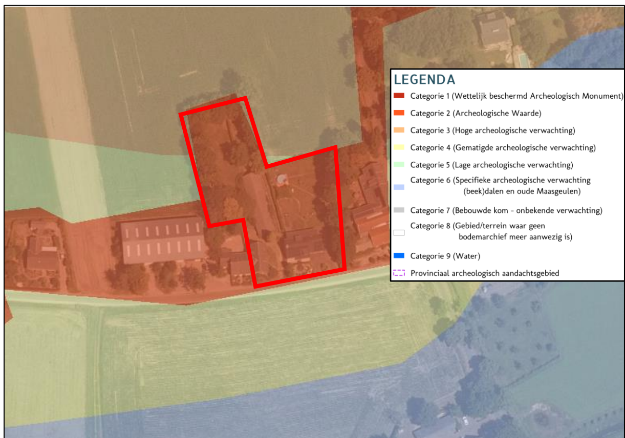
Afbeelding 12. Uitsnede archeologische waardenkaart met plangebied rood omlijnd

De gemeente Horst aan de Maas heeft voor haar grondgebied een Archeologische Maatregelenkaart ontwikkeld welke op 26 mei 2015 is vastgesteld. Conform deze kaart is het plangebied gelegen in een gebied met een archeologische verwachting en met een hoge archeologische verwachting. Conform het vigerende bestemmingsplan zijn aan het plangebied dan ook de dubbelbestemmingen 'Waarde – Archeologie 2' en 'Waarde – Archeologie 3' toegekend.