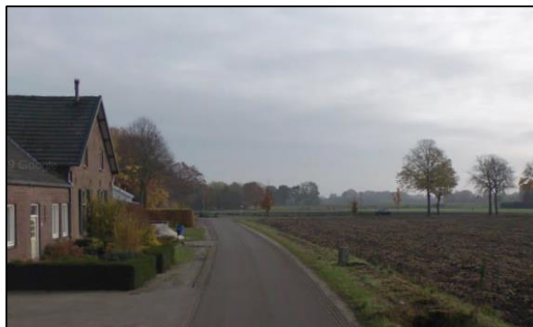
Afbeelding 6. Impressie Snelkensstraat / Maasbreeseweg

In de omgeving zijn diverse bos- en natuurgebieden gelegen waaronder het Elsbeemden. De Elsbeemden is een 65 ha groot natuurgebied dat is gelegen in het beekdal van de Grootte Molenbeek en de Elsbeek. Dit natuurgebied bestaat dan ook voor een groot deel uit broekbossen en natte graslanden. Ten zuidwesten is tevens een uitloper van dit natuurgebied gelegen.