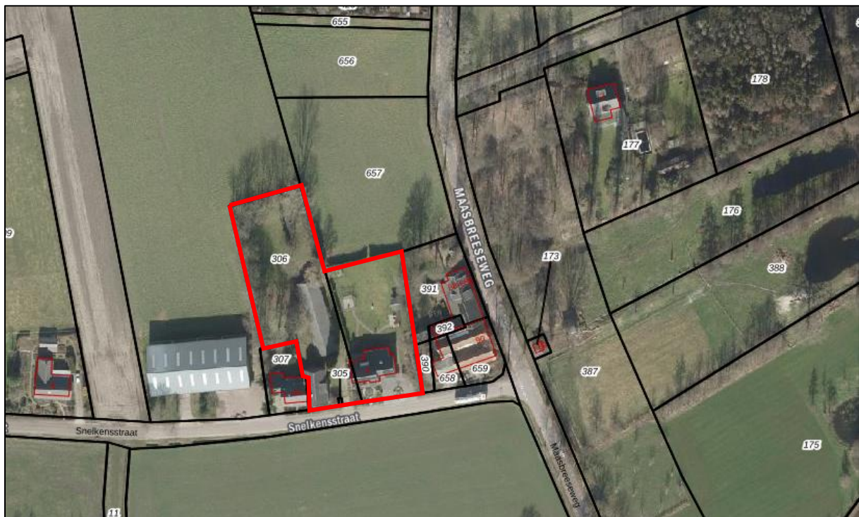
Afbeelding 2. Luchtfoto en kadastrale begrenzingen Snelkensstraat 4 en omgeving (plangebied rood omlijnd)

De locatie is gelegen in het buitengebied van Sevenum, aan de Snelkensstraat. De locatie staat kadastraal bekend als gemeente Sevenum, sectie R en perceelnummers 305, 306 en 657 (ged.). De betreffende percelen worden in onderhavig bestemmingsplan aangemerkt als “het plangebied”.