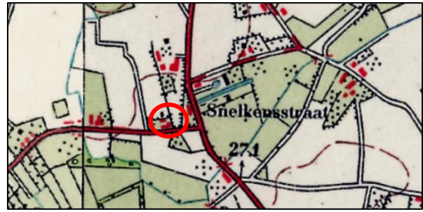
Afbeelding 8. Situatie omstreeks 1950

De open velden zijn de oudste landbouwgronden. De hoger geleden gronden werden collectief ontgonnen en gebruikt. Langs de randen van de velden stonden de gebouwen. In dit geval nog steeds duidelijk herkenbaar als het bebouwingslint van de Snelkensstraat. De velden zijn van oorsprong grote open akkerbouwgebieden. Bemesting vond plaats vanuit het potstalsysteem, waardoor dikke humusrijke enkeerdgronden zijn ontstaan. De velden werden slechts doorsneden door smalle zandpaden, zonder opgaande beplanting.