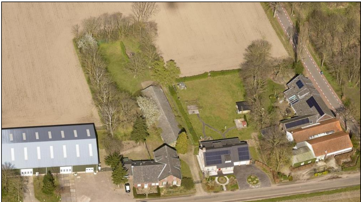
Afbeelding 10. Luchtfoto van het plangebied met de bestaande groenelementen

De voormalige woning zal met het initiatief zijn functie als woning terugkrijgen. Ter compensatie van het opnieuw bestemmen van het pand als woning zal een voormalige stal, dat achter de woning is gelegen, worden gesloopt.