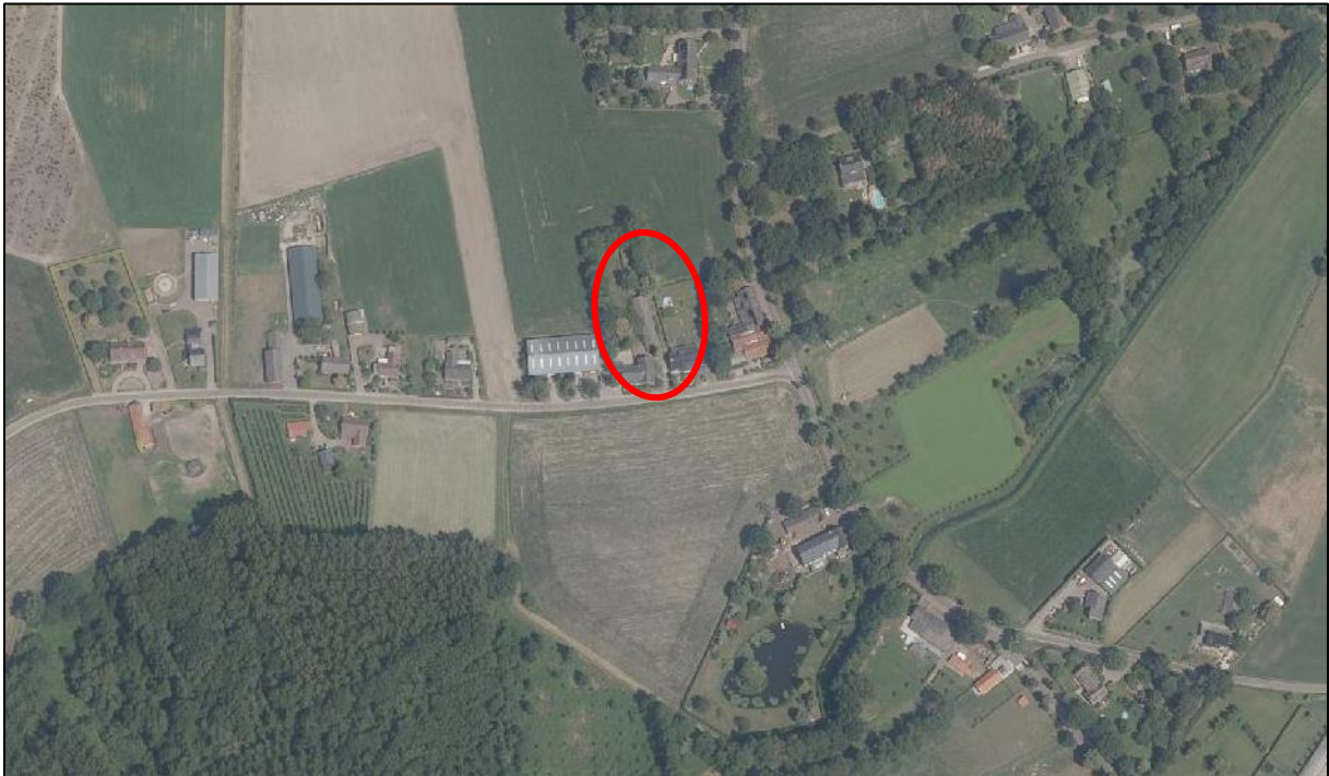
Afbeelding 11. Ligging risicovolle bedrijvigheid ten opzichte van het plangebied

hoogte van het groepsrisico bij ruimtelijke ontwikkelingen. Echter, het gemeentebestuur is wel verplicht voor het invloedsgebied verantwoording af te leggen over de hoogte van het groepsrisico, de te nemen maatregelen om de effecten van deze risico's te reduceren en de eventuele restrisico's.