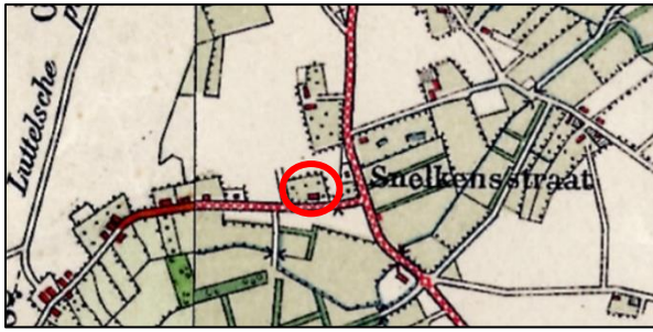
Afbeelding 7. Situatie omstreeks 1918