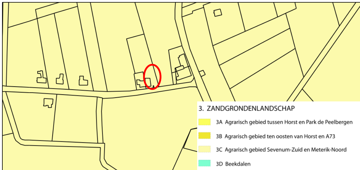
Afbeelding 9. Gebiedsindeling gemeentelijke structuurvisie met plangebied rood omcirkeld

Het plangebied is gelegen in deelgebied 3C 'Agrarisch gebied Sevenum-Zuid en Meterik-Noord'. Voor nieuwe woningen in deelgebied 3C geldt een voorwaardelijke grondhouding (nee, tenzij). Bij een voorwaardelijke grondhouding kan een ontwikkeling enkel doorgang vinden, wanneer voldaan wordt aan strikte voorwaarden die een ontwikkeling alsnog acceptabel maken.