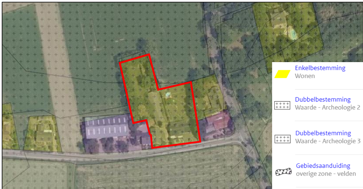
Afbeelding 3. Uitsnede vigerend bestemmingsplan – beoogde locatie voor nieuwe woning aangeduid

De voor 'Wonen' aangewezen gronden zijn bestemd voor wonen in een woning. Deze gronden zijn daarnaast onder andere bestemd voor tuinen, paden, parkeervoorzieningen en water en waterhuishoudkundige voorzieningen. Per bestemmingsvlak is één woning toegestaan.