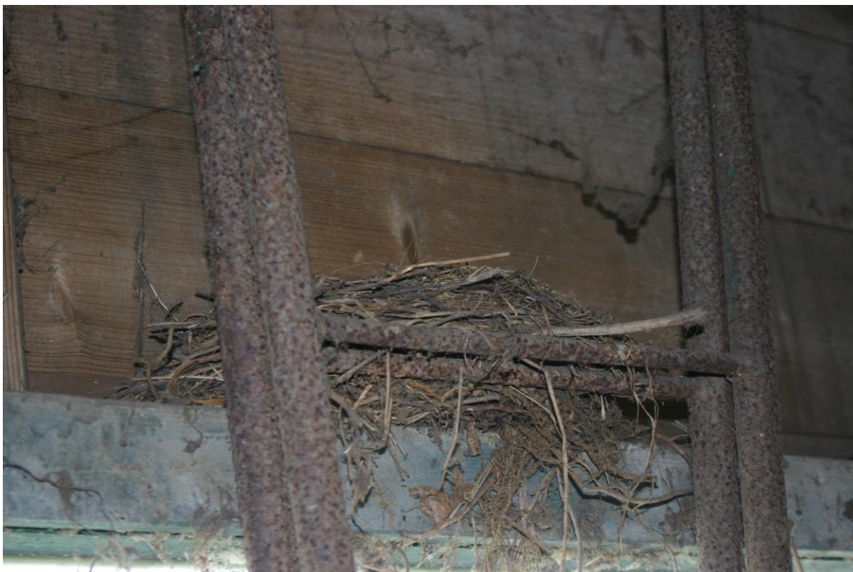
Figuur 4.2. Het oude merelnest.