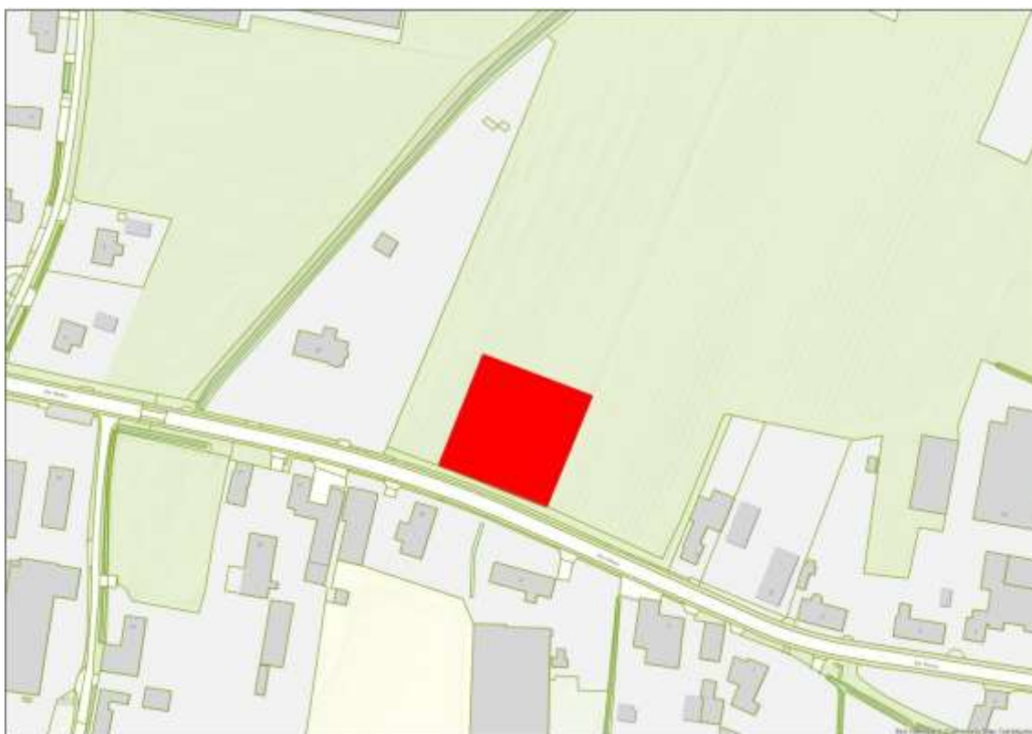
Afbeelding 1 - beoogde locatie woningbouw

Voor dit perceel tussen De Hees 12 en 20 bestaat het voornemen twee woningen te realiseren. Zie onderstaande afbeelding.