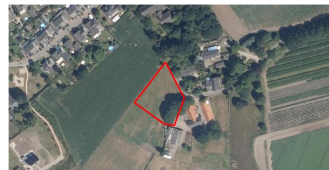
Figuur 2: Luchtfoto plangebied en directe omgeving