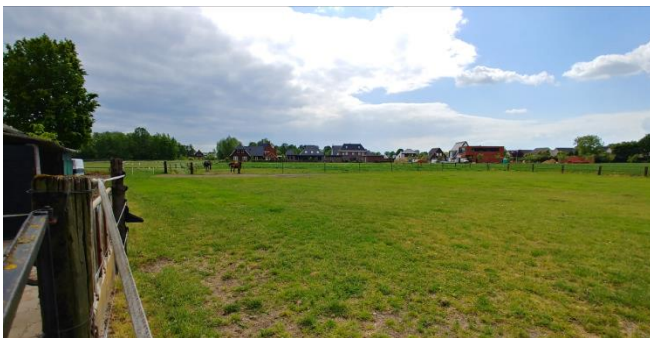
Figuur 7: Weiland ten zuiden van het plangebied