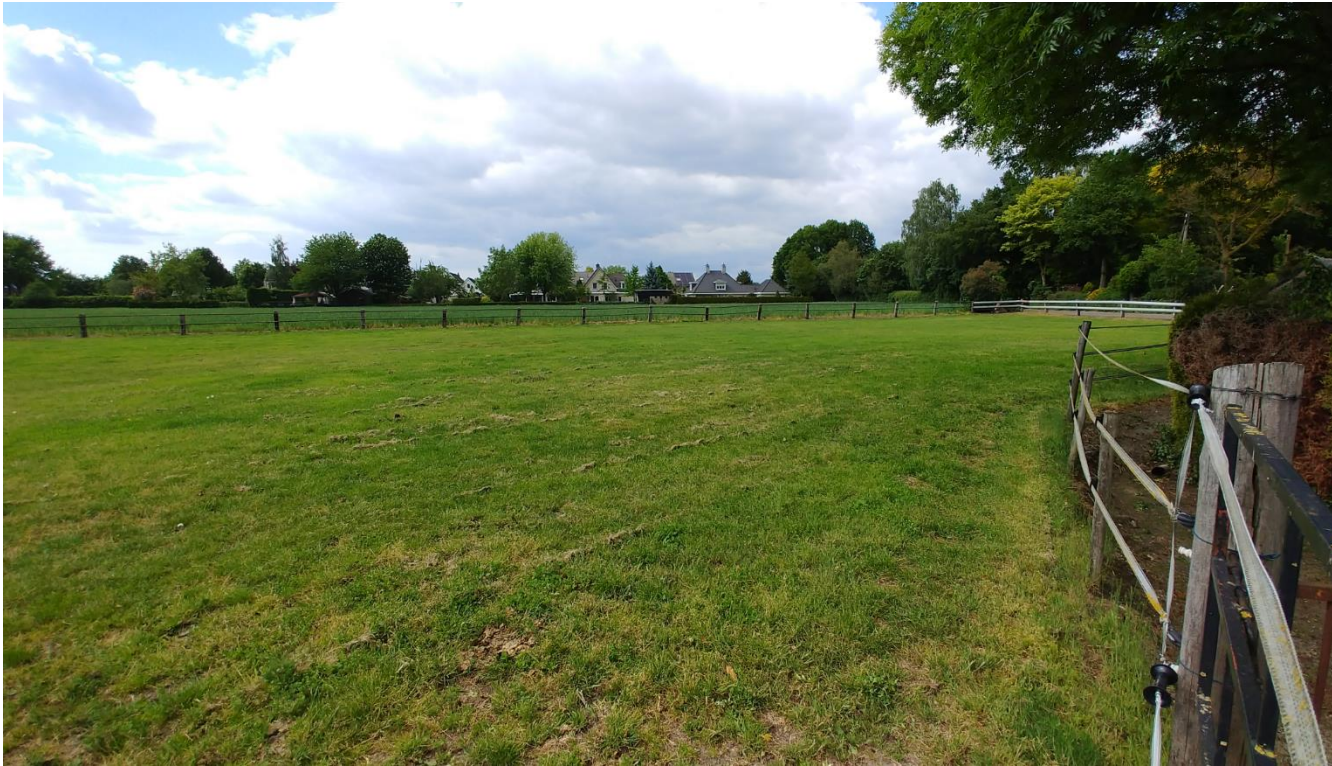
Figuur 4: Plangebied gezien vanuit het zuidoosten