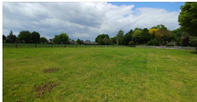
Figuur 8: Plangebied gezien vanuit het zuiden