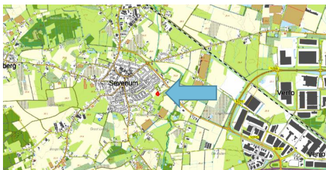
Figuur 1: Topografische kaart ligging plangebied (1:25.000)

De initiatiefnemer is voornemens een woonhuis en opstal te realiseren binnen het plangebied. Hierbij zal de benodigde infrastructuur moeten worden aangelegd, daar deze nog afwezig is binnen het plangebied. Figuur 3 geeft een beeld van de toekomstige situatie.