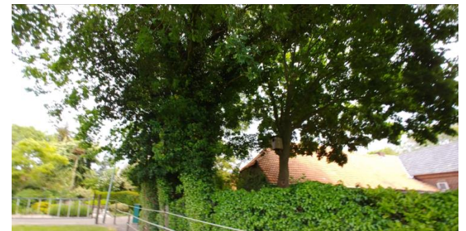
Figuur 9: Groenstructuren in het zuidoosten van het plangebied