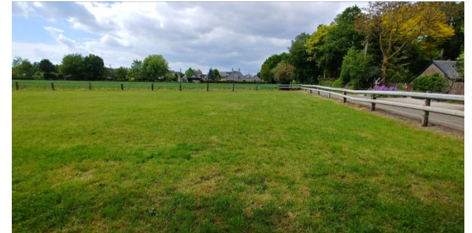
Figuur 5: Beoogde locatie woonhuis binnen het plangebied