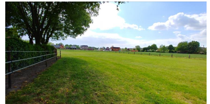
Figuur 6: Plangebied gezien vanuit het noorden