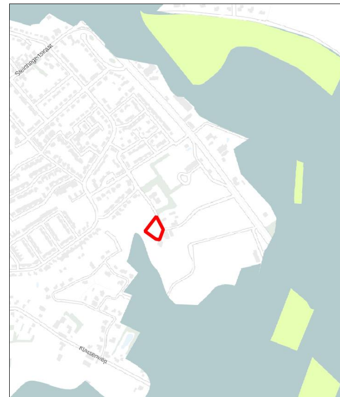
Figuur 10: Ligging goudgroene natuurzone (groen), zilvergroene natuurzone (geel) en bronsgroene landschapszone (blauw) ten opzichte van perceel plangebied (rood omlijnd)

Het plangebied is niet gelegen binnen de goudgroene natuurzone, zilvergroene natuurzone of bronsgroene landschapszone (zie figuur 10). Het dichtstbijzijnde onderdeel van betreft de bronsgroene landschapszone, en ligt ongeveer 25 meter ten zuidwesten van het plangebied. Gezien de aard van de voorgenomen plannen zullen de omgevingscondities redelijkerwijs gelijk blijven, waardoor de wezenlijke kenmerken en waarden van de bronsgroene landschapszone niet worden aangetast. Vervolgonderzoek in het kader van het NNN wordt dan ook niet noodzakelijk geacht.