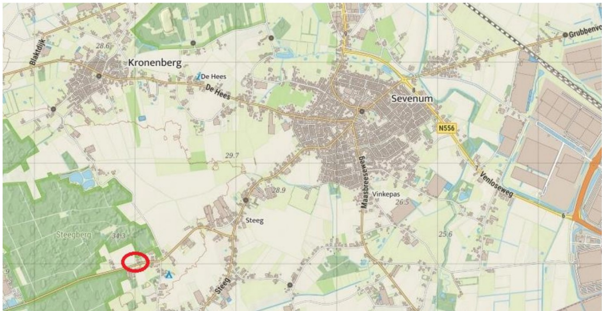
Afbeelding 1: Globale ligging van het plangebied. De locatie waar de landschappelijke inpassing toegepast gaat worden, wordt aangeduid met de rode cirkel.

Het plangebied is gelegen ten zuidwesten van Sevenum, liggende binnen de gemeente Horst aan de Maas (zie afbeelding 1). Het plangebied betreft de locatie: Helenaveenseweg ong., waarop diverse ruimtelijke ontwikkelingen gepland zijn (zie afbeelding 2). Met betrekking tot deze ruimtelijke ontwikkelingen is dit landschappelijk inpassingsplan opgesteld welke voldoet aan de geldende wet- en regelgeving en gestelde eisen.