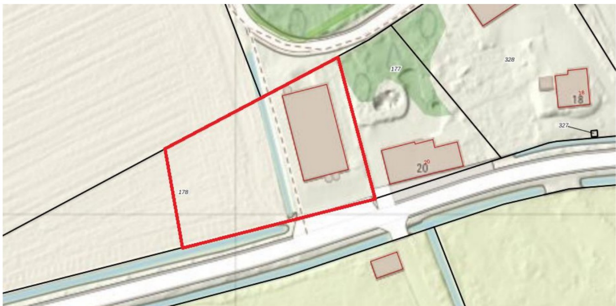
Afbeelding 2: Begrenzing van het plangebied waarbinnen de ruimtelijke ontwikkelingen plaats gaan vinden, binnen de rode lijnen.