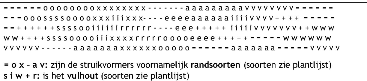
Afbeelding 6: mengingsschema struweel

Het is belangrijk om de planten te mengen. Onder menging wordt verstaan het mengen van de plantsoorten in het struweel. Hoe groter de struwelen zijn des te groter de plantgroepen worden. Bij kleine plantvakken (<50 m 2 ) wordt gebruik gemaakt van 3-5 planten per soort en bij grote plantvakken (>50) wordt gebruik gemaakt van 5-8 planten per soort in een groep. Deze groepen plant men gemengd in wildverband, zodat geen vakken van soorten ontstaan (zie afbeelding 6).