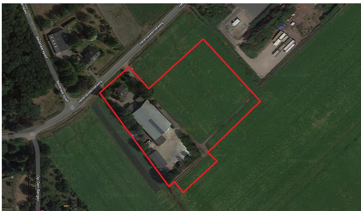
Figuur 4.1. Ligging van het plangebied (rood omlijnd gebied).

Het plangebied zelf bestaat uit akkerland met aan de randen algemeen voorkomende plantensoorten als Canadese fijnstraal, kleine brandnetel, paarse dovennetel, melkdistel, winterpostelein en klein kruiskruid. Aan de zuidzijde van het bestaande bouwvlak bevindt zich een greppel. Op het huidige bouwvlak bevinden zich algemeen voorkomende bomensoorten als ruwe berk en zomereik en een heg van zomereik, hazelaar, hulst en gewone vlier.