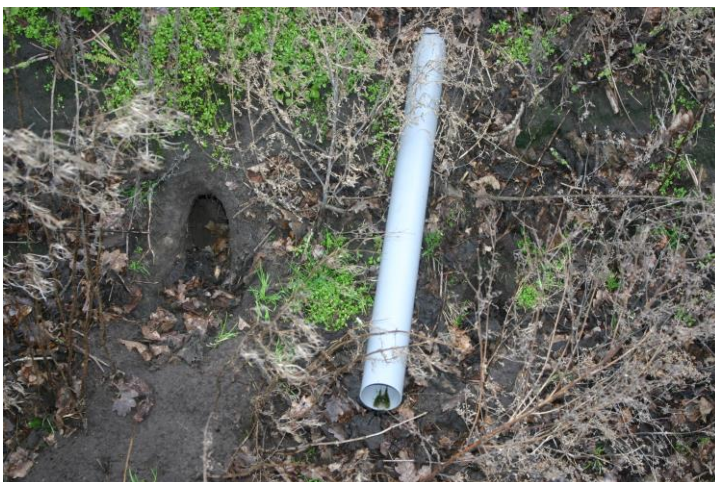
Figuur 4.2.2. In de greppel aan de zuidzijde van het bestaande bouwvlak is een konijnenpijp aanwezig.