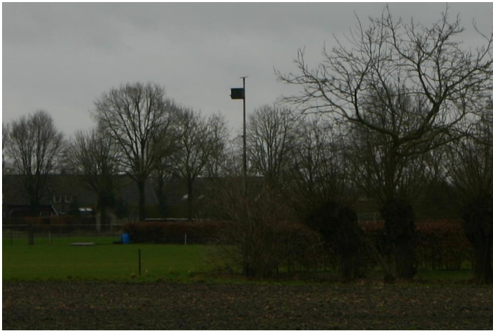
Figuur 4.2.1. Op zo'n 80 meter ten zuiden van het plangebied is een torenvalkennestkast aanwezig.

In de greppel aan de zuidzijde van het bestaande bouwvlak is een konijnenpijp aanwezig (zie figuur 4.2.2). Dassenburchten, -wissels, -snuitpuntjes en -latrines zijn afwezig. Voor (kleine) marterachtigen biedt het plangebied onvoldoende dekking. Algemene zoogdieren als de aarmuis of veldmuis kunnen wel in het plangebied voorkomen.