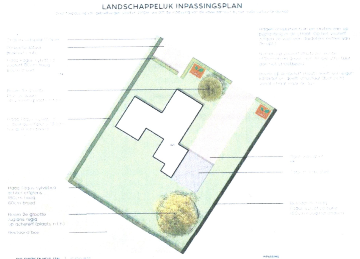
Afbeelding 1. Ontwerp van inpassing bouwplan. Oranje kaders geven beoogde locaties voor perken met waardplanten weer.

Op de planlocatie wordt een woonhuis met praktijkruimten en bijhorende tuin gerealiseerd. Zoals in onderstaande afbeelding aangegeven, zullen er aan de noordkant van het perceel twee perkjes worden aangelegd waarin verschillende waardplanten worden gerealiseerd. Deze perkjes zullen ongeveer 5 m 2 aan ruimte voor waardplanten creëren.