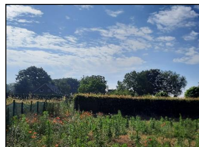
Figuur 8. Indrukken plangebied. Kijk-richting noordwestelijk.