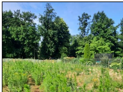
Figuur 4. Indrukken plangebied. Kijk-richting zuidelijk.