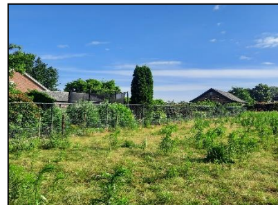
Figuur 5. Plangebied omheind door hekwerk. Kijkrichting oostelijk.