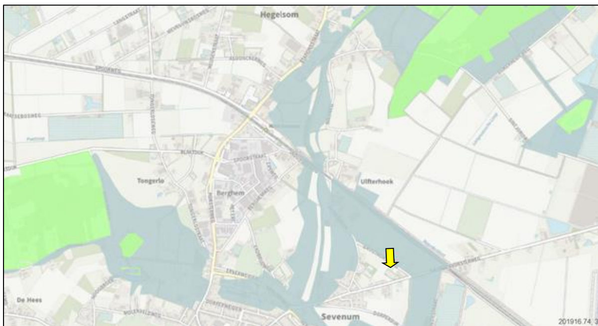
Figuur 10. Ligging onderzoekslocatie (gele pijl) ten opzichte van het Natuurnetwerk Nederland (groene vlakken).

De provincie Limburg, heeft haar landschap en natuurgronden onderverdeeld in Bronsgroene, Zilvergroene en Goudgroene zones. Goudgroene zones maken deel uit van het Nationaal Natuurnetwerk Nederland (NNN). De onderzoekslocatie maakt geen deel uit van het Natuurnetwerk. De onderzoekslocatie ligt echter wel in de nabijheid van tot het Natuurnetwerk Nederland: circa 1,1 kilometer ten noorden van de onderzoekslocatie. In figuur 10 is de ligging van de onderzoekslocatie ten opzichte van het Natuurnetwerk Nederland weergegeven. Een extern effect valt niet te verwachten, omdat door de voornemens de huidige aanwezige wezenlijke kenmerken en waarden niet zullen veranderen. Dit gezien de aard van de ingreep tezamen met de afstand. Vervolgonderzoek in het kader van het Natuurnetwerk Nederland wordt niet noodzakelijk geacht.