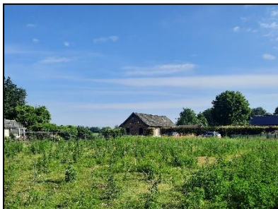
Figuur 3. Indrukken plangebied. Kijk-richting noordelijk.