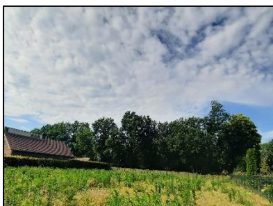
Figuur 6. Indrukken plangebied. Kijk-richting zuidelijk.