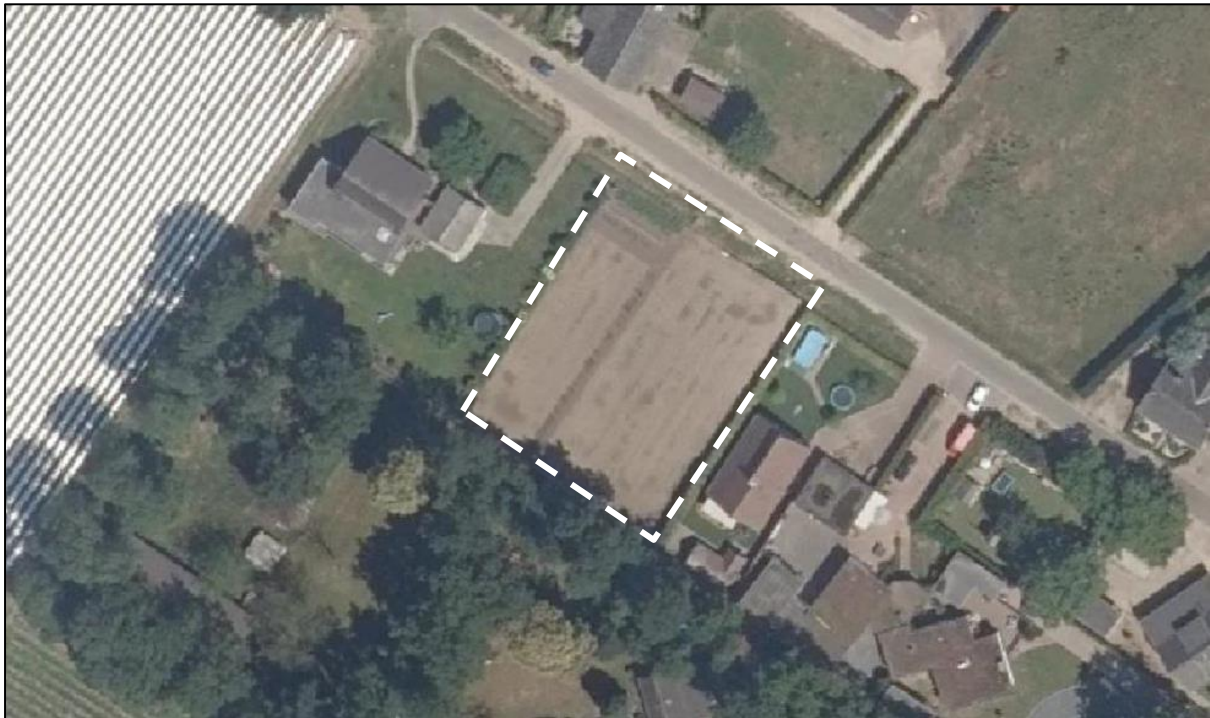
Figuur 2. Luchtfoto onderzoekslocatie (wit omkaderd) en directe omgeving.