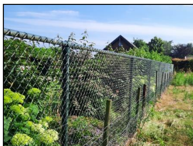
Figuur 7. Plangebied omheind door hekwerk. Kijkrichting zuidoostelijk.