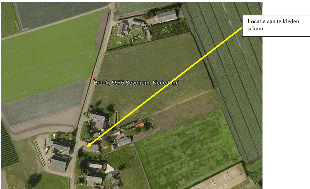
Figuur 1 De locatie voor extra aankleding bestaande schuur