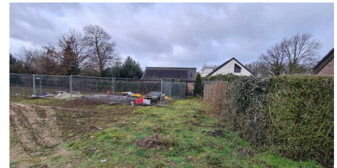
Figuur 6: Noordhoek plangebied