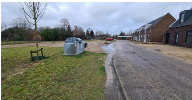
Figuur 7: Bertus Aafjesstraat vanuit zuiden