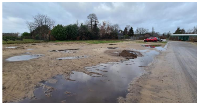
Figuur 8: Plangebied vanaf zuiden