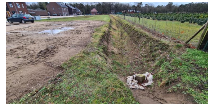
Figuur 9: Sloot startende in zuidwesthoek plangebied