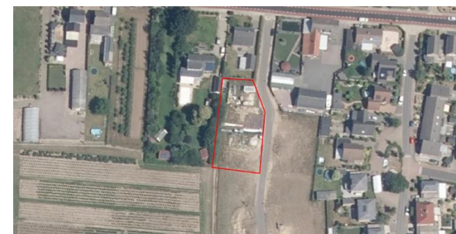
Figuur 2: Luchtfoto plangebied en directe omgeving