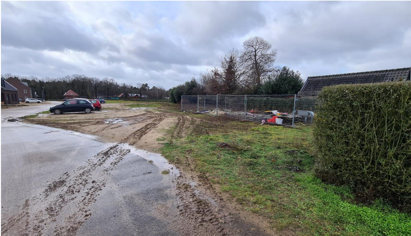
Figuur 4: Plangebied gezien vanuit noorden