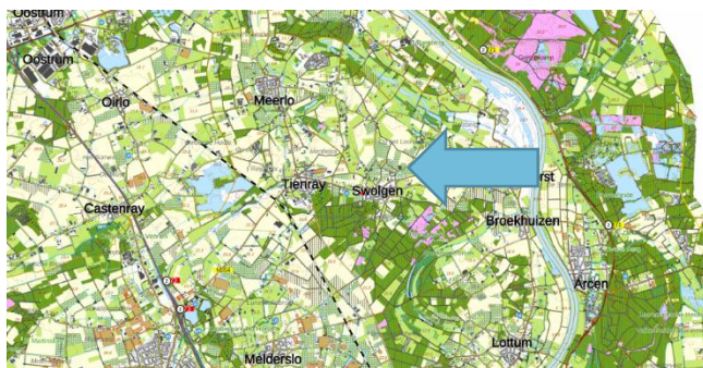
Figuur 1: Topografische kaart ligging plangebied (1:25.000)

Binnen het plangebied worden 5 woningen gerealiseerd, met de bijbehorende parkeerplaatsen. Figuur 3 geeft een beeld van de toekomstige situatie.