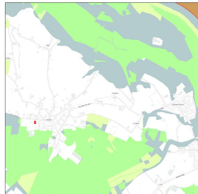
Figuur 10: Ligging goudgroene natuurzone (groen), zilvergroene natuurzone (geel), bronsgroene landschapszone (blauw) en Natura 2000-gebieden (paars gearceerd) ten opzichte van perceel plangebied (rood omlijnd)

Het plangebied is niet gelegen binnen de goudgroene natuurzone (zie figuur 10). Het dichtstbijzijnde onderdeel van de goudgroene natuurzone ligt ongeveer 150 meter ten zuiden van het plangebied. Gezien de aard van de voorgenomen plannen zullen de omgevingscondities redelijkerwijs gelijk blijven, waardoor de wezenlijke kenmerken en waarden van de goudgroene natuurzone niet worden aangetast. Vervolgonderzoek in het kader van de goudgroene natuurzone wordt