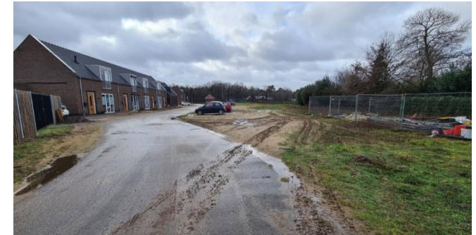
Figuur 5: Bertus Aafjesstraat vanuit noorden