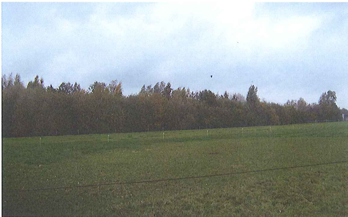
Foto 1. Perceel Horst sectie T nummer 971, vanaf de St. Jorisweg in noordelijke richting.