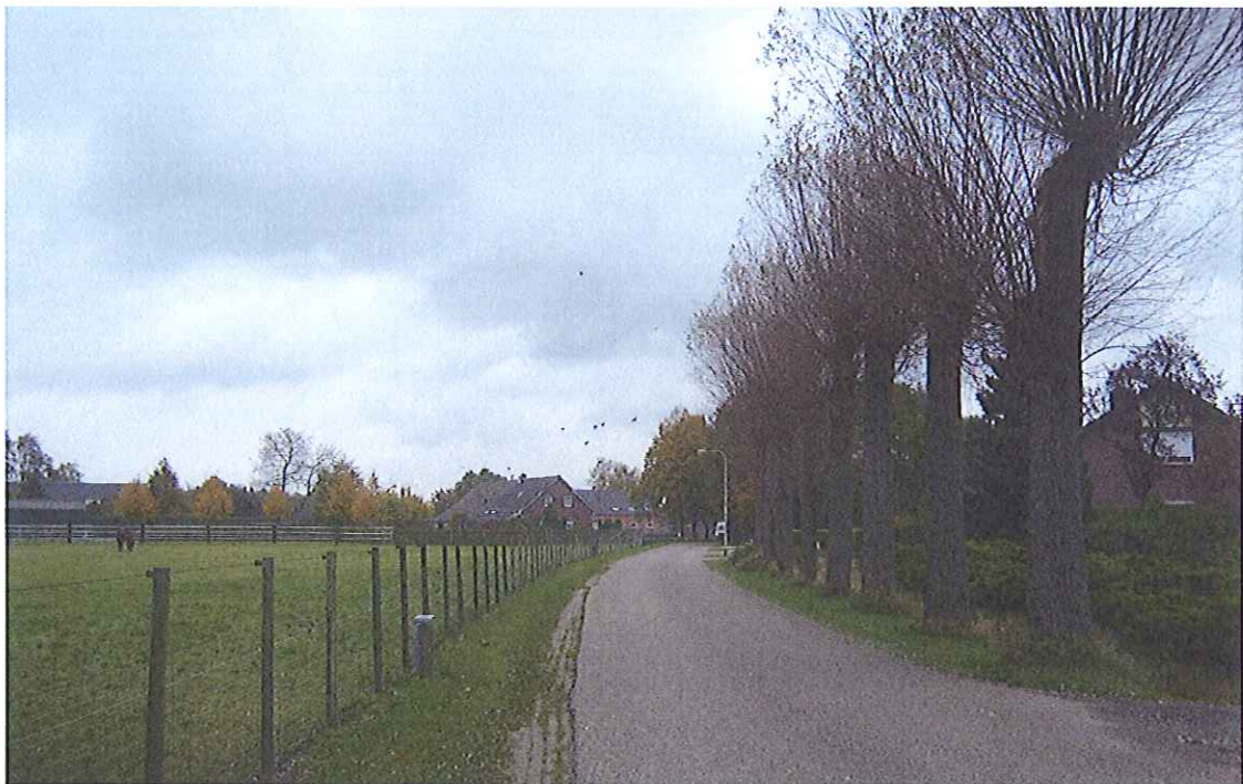
Foto 3. Perceel Horst sectie T nummer 971, vanaf de St. Jorisweg in oostelijke richting.