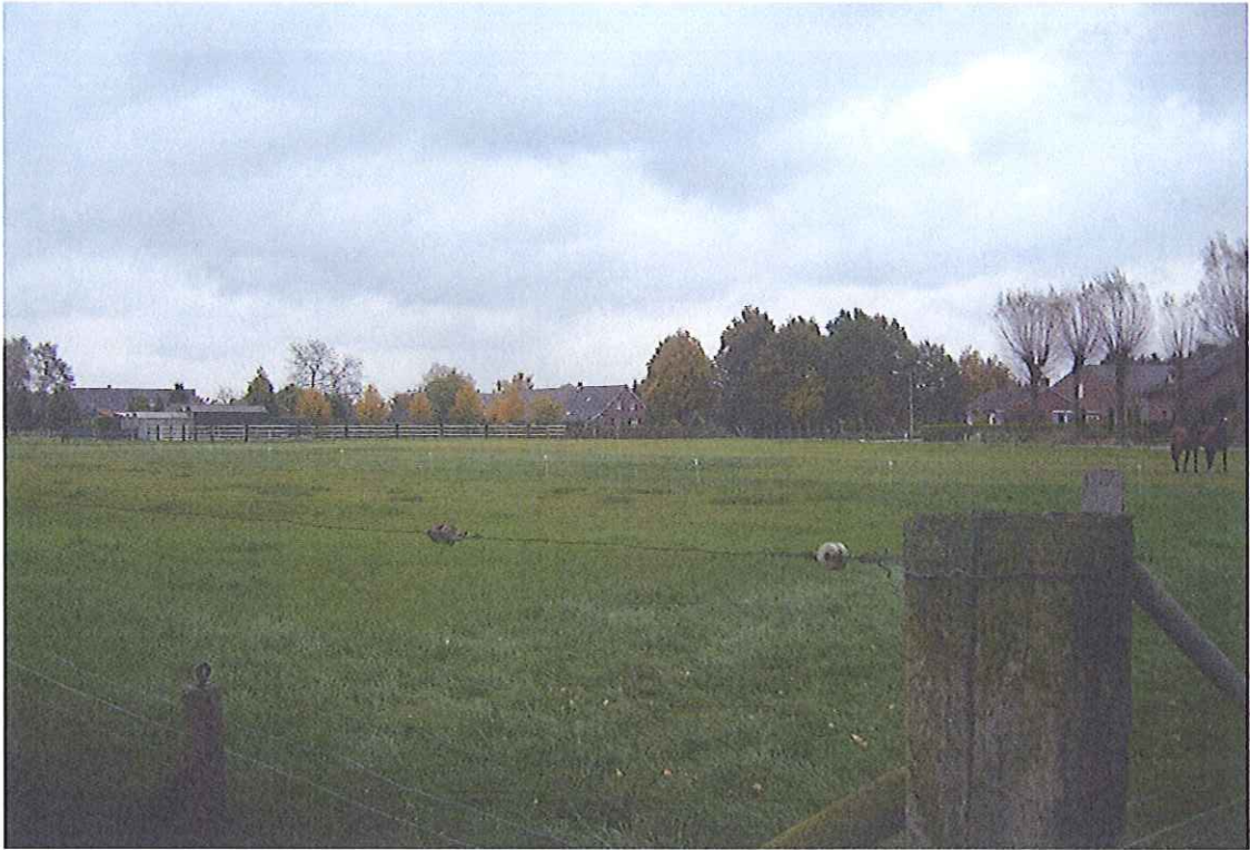
Foto 4. Perceel Horst sectie T nummer 971, vanaf de Groote Molenbeek in zuidoostelijke richting.