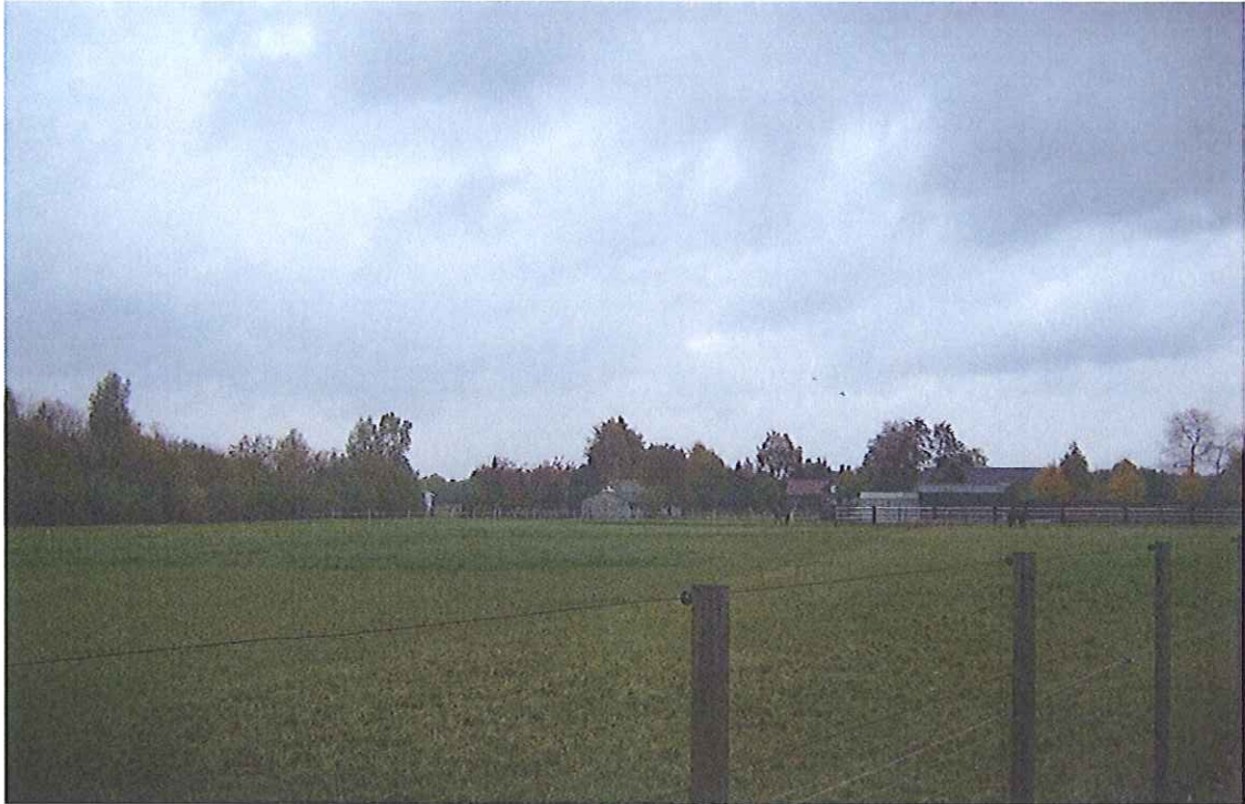
Foto 2. Perceel Horst sectie T nummer 971, vanaf de St. Jorisweg in noordoostelijke richting.