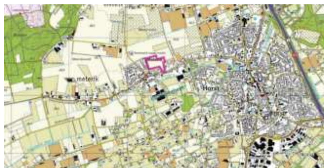
Figuur 1: Ligging plangebied