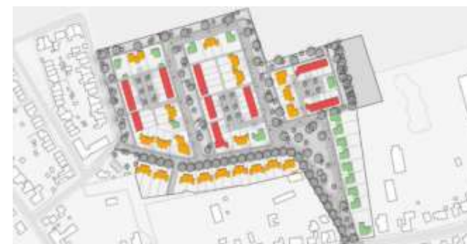
Figuur 3: Suggestie woningtypen (groen = vrijstaand, oranje = tweekappers, rood = rijwoningen)