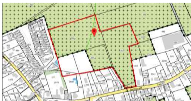
Figuur 2: Afbakening plangebied

Voor het antwoord onderzoeken we zowel de kwantitatieve als kwalitatieve behoefte aan de ontwikkeling binnen het verzorgingsgebied. Ook wordt gekeken naar de locatieafweging binnen of buiten het bestaand stedelijk gebied. Bovendien worden door middel van het onderzoek de te verwachten effecten van de beoogde ontwikkeling in beeld gebracht. Met de resultaten van het onderzoek is de Ladder voor Duurzame Verstedelijking doorlopen.