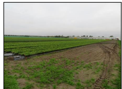
Figuur 5. Korte begroeiing op landbouwweg