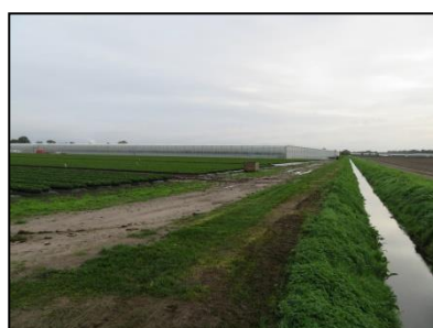
Figuur 7. Landbouwweg en afwateringssloot ten zuiden van de locatie