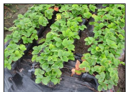
Figuur 8. Bloembedden