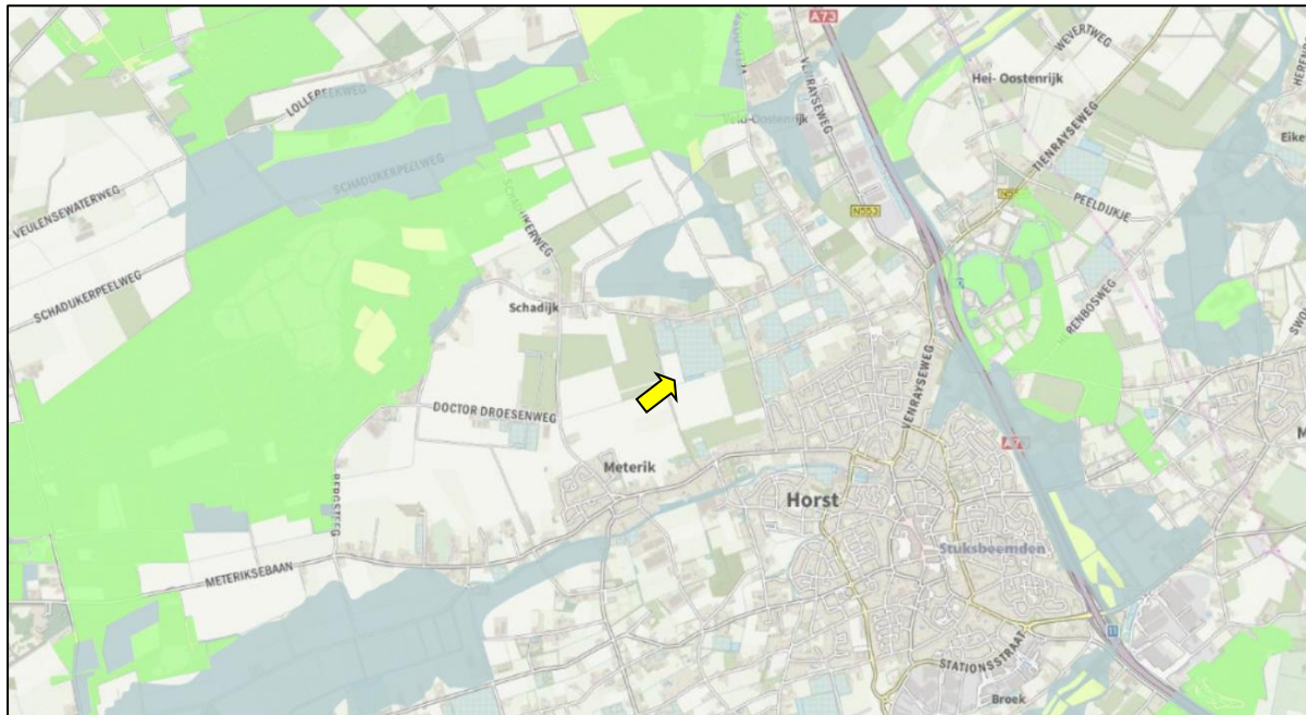
Figuur 10. Ligging onderzoekslocatie (gele pijl) ten opzichte van de goudgroene (groen gemarkeerd) en zilvergroeene (geel gemarkeerd) natuurzone en bronsgroene (grijs gemarkeerd) landschapszone van het Natuurnetwerk Nederland.

De onderzoekslocatie maakt geen deel uit van het Natuurnetwerk. Het meest nabijgelegen gebied bevindt zich circa 600 meter ten noorden van de onderzoekslocatie. Het betreft een gebied in de bronsgroene landschapszone. Op 1,4 kilometer ten noordwesten van de onderzoekslocatie bevinden zich de Schadijse bossen, een gebied dat behoort tot de goudgroene natuurzone. In figuur 10 is de ligging van de onderzoekslocatie ten opzichte van het Natuurnetwerk Nederland weergegeven.