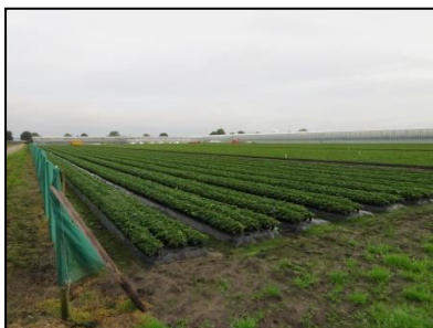
Figuur 3. De locatie vanaf de zuidwestelijke zijde