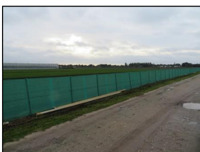
Figuur 6. Afscheiding met worteldoek tussen locatie en halfverharde weg