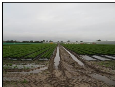
Figuur 4. Bloembedden met braakliggende stroken