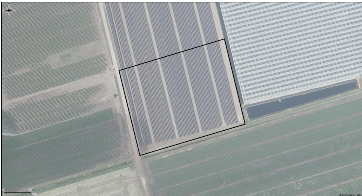
Figuur 2. Luchtfoto onderzoekslocatie (zwart omlijnd) en directe omgeving.