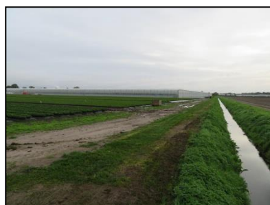
Figuur 7. Landbouwweg en afwateringssloot ten zuiden van de locatie