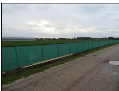
Figuur 6. Afscheiding met worteldoek tussen locatie en halfverharde weg