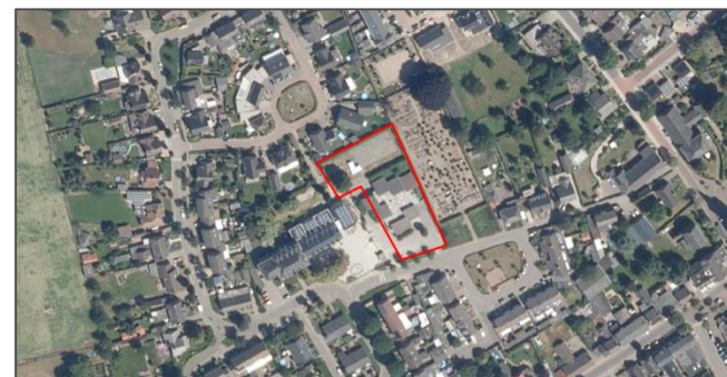
Figuur 2: Luchtfoto plangebied en directe omgeving