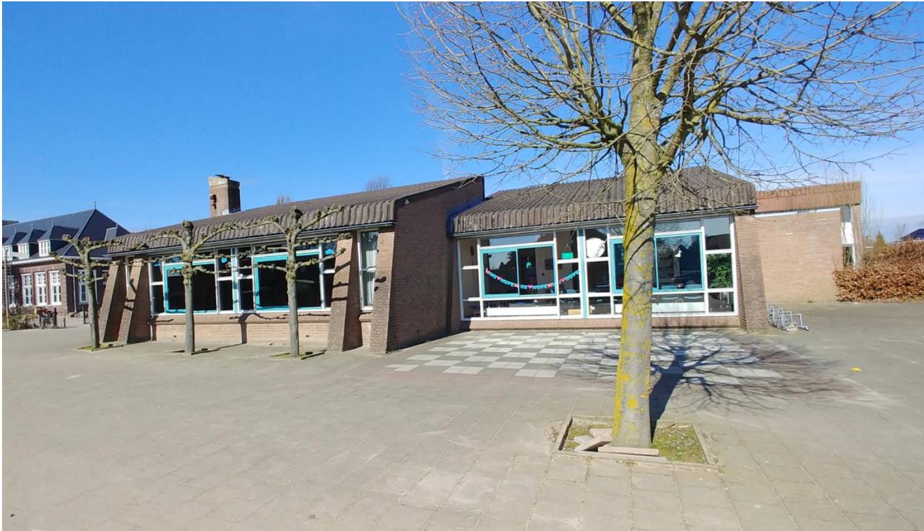
Figuur 4: Zuidzijde schoolgebouw met schoolplein