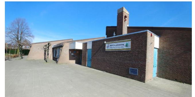
Figuur 6: Westzijde schoolgebouw