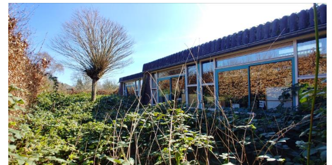
Figuur 9: Noordzijde school met verruigde gedeelte en heg