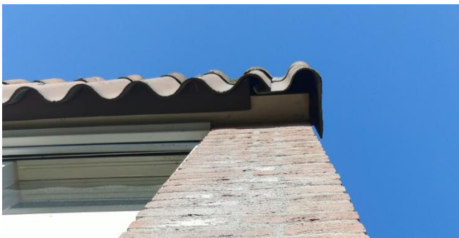
Figuur 7: Detailopname dakplaten schoolgebouw