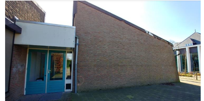
Figuur 5: Westzijde schoolgebouw