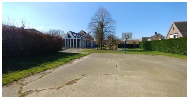
Figuur 8: Heg noordkant school en naastgelegen speelterrein