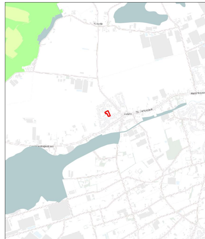
Figuur 10: Ligging goudgroene natuurzone (groen), zilvergroene natuurzone (geel) en bronsgroene landschapszone (blauw) ten opzichte van perceel plangebied (rood omlijnd)

Het plangebied is niet gelegen binnen de goudgroene natuurzone (zie figuur 10). Het dichtstbijzijnde onderdeel van de goudgroene natuurzone ligt ongeveer 1,3 kilometer ten noordwesten van het plangebied. Gezien de aard van de voorgenomen plannen zullen de omgevingscondities redelijkerwijs gelijk blijven, waardoor de wezenlijke kenmerken en waarden van de goudgroene natuurzone niet worden aangetast. Vervolgonderzoek in het kader van de goudgroene natuurzone wordt dan ook niet noodzakelijk geacht.