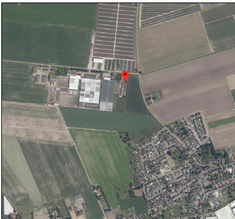
Afbeelding 2: Omgeving plangebied