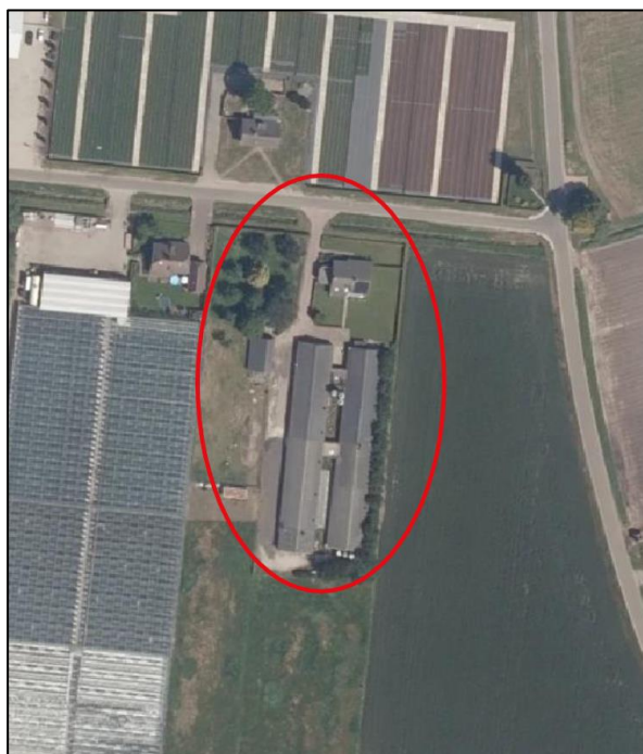
Afbeelding 1: Ligging plangebied

Het plangebied is gelegen in het buitengebied van Meterik, ten noordoosten van de bebouwde kom van de kern Meterik. Het plangebied is kadastraal bekend als gemeente Horst, sectie K, nummer 164 en is plaatselijk bekend als Dr. Drosenweg 1 te Meterik en heeft betrekking op het gedeelte gelegen binnen het bouwvlak met de aanduiding 'intensieve veehouderij'.