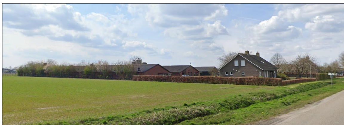
Afbeelding 3: Plangebied gezien vanuit Noordoostzijde (Schadijkerweg).

In de opslagboxen wordt materieel van particulieren opgeslagen. Volgens de handreiking 'Bedrijven en milieuzonering' valt dit soort opslag onder categorie 2 – opslag gebouwen (verhuur gebouwen).