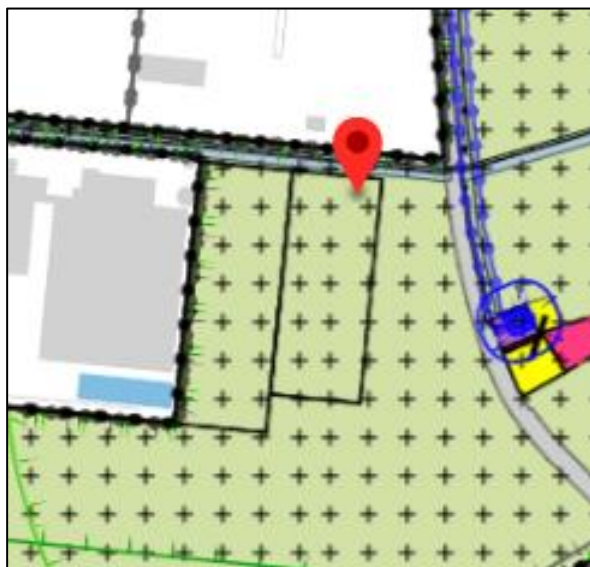
Afbeelding 8: Uitsnede bestemmingsplan 'Buitengebied Horst aan de Maas'

Het plangebied heeft op basis van de bestemmingsplannen de enkelbestemming 'Agrarisch met waarden' met een bouwvlak met de functieaanduiding 'intensieve veehouderij' en daarnaast is het plangebied gelegen in de dubbelbestemming 'Waarde – Archeologie 3' en de gebiedsaanduidingen 'milieuzone- grondwaterbeschermingsgebied Venloschol', 'overige zone – velden' en 'vrijwaringszone – molenbiotoop'.