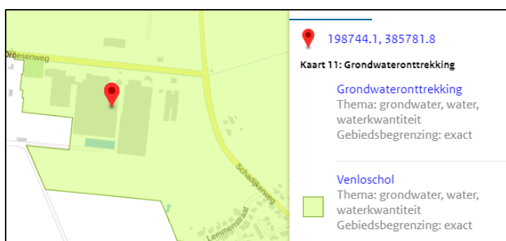
Afbeelding 7: Grondwaterbeschermingsgebied Venloschol

Behalve de toevoeging van het hoofdstuk Ruimte zijn in de Omgevingsverordening Limburg 2014 ook de Verordening Veehouderijen en Natura 2000 (van oktober 2013) en de Verordening Wonen Zuid-Limburg (van juli 2013) vrijwel ongewijzigd overgenomen. Het plangebied is volgens de kaarten bij de Omgevingsverordening niet gelegen binnen milieubeschermingszones of beschermingszones ten behoeve van natuur en landschap. Het plangebied is in het grondwaterbeschermingsgebied Venloschol' gelegen zoals op onderstaande afbeelding is weergegeven.