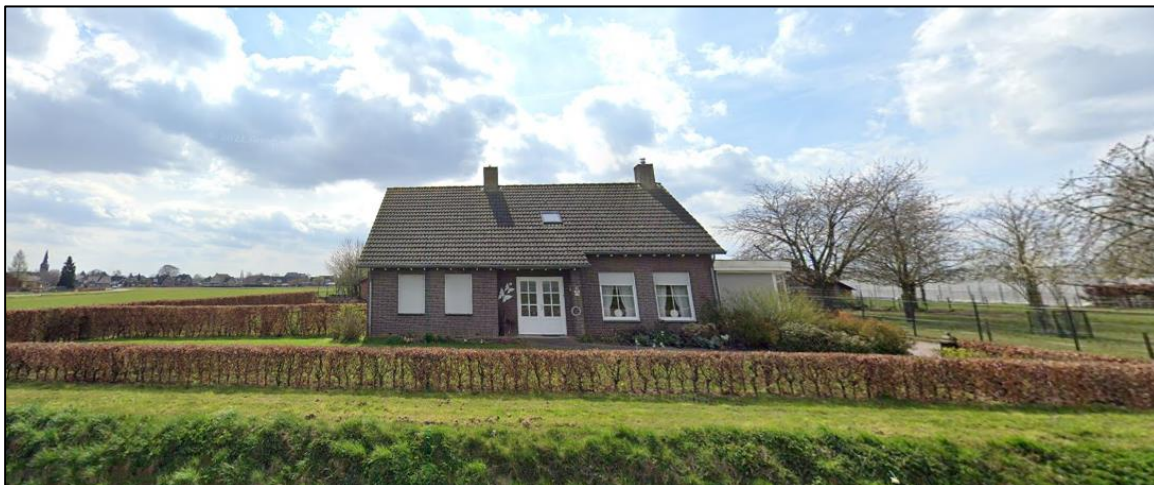
Afbeelding 5: Voorzijde vanaf de Dr. Droesenweg.