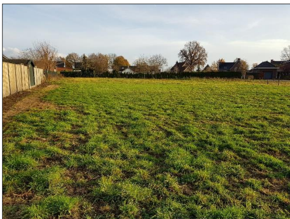
Figuur 8. Noordelijk deel plangebied