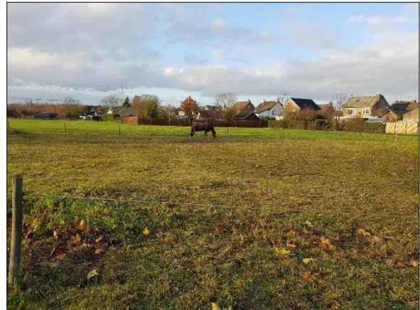
Figuur 5. Midden plangebied vanuit zuiden