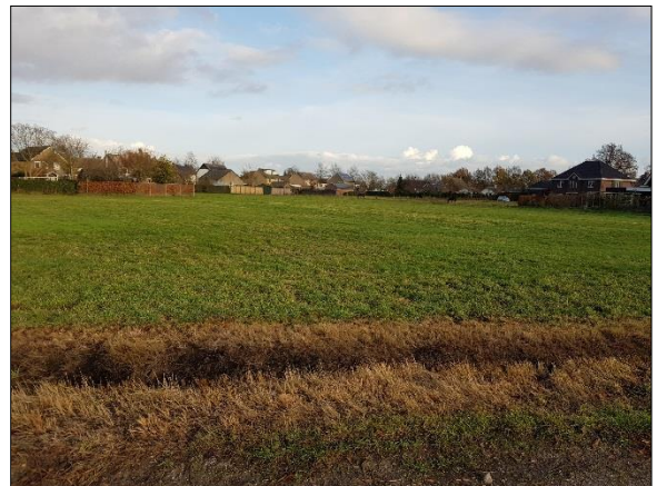
Figuur 7. Plangebied vanaf westelijk gelegen zandweg