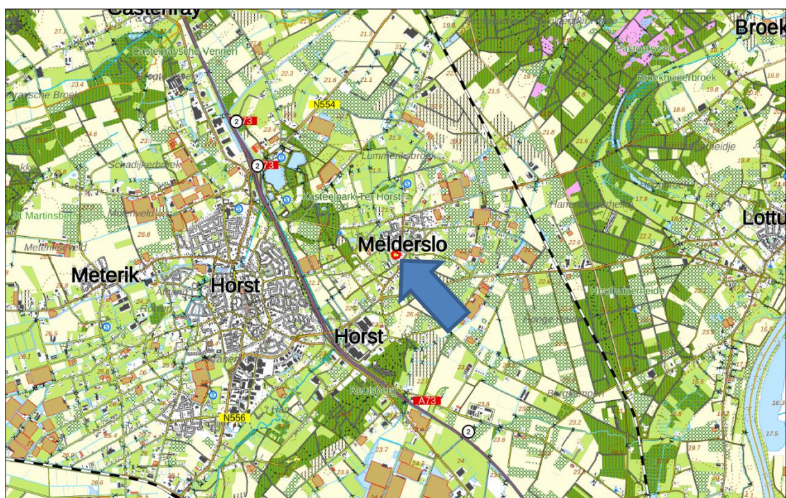
Figuur 1. Topografische kaart ligging van het plangebied (1:25.000)

Het plangebied is gelegen in het zuiden van Melderslo. In figuur 1 is de topografische ligging van het plangebied weergegeven.