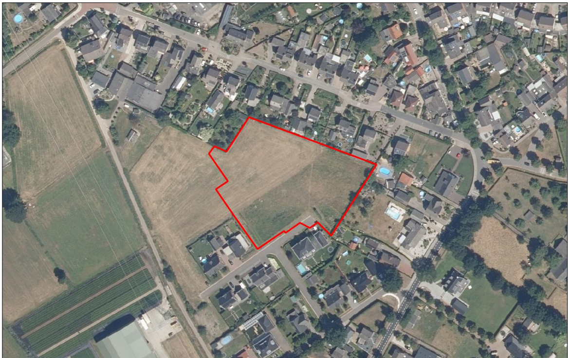
Figuur 2. Luchtfoto van het plangebied en de directe omgeving