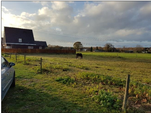
Figuur 4. Westelijk deel plangebied vanuit zuiden