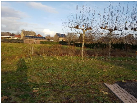
Figuur 6. Oostelijk deel plangebied