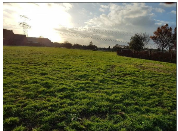
Figuur 9. Plangebied vanuit noorden