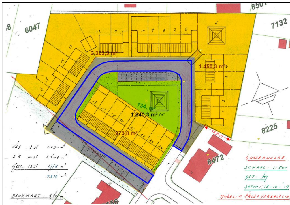
Figuur 3. Toekomstige situatie plangebied