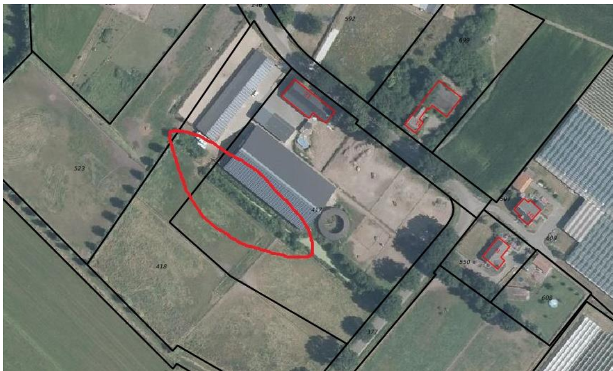
Figuur 4.1. Ligging van het plangebied (rood omlijnd).

Het plangebied is weergegeven in figuur 4.1. Het is gelegen in het noorden van Melderslo, buiten de bebouwde kom. De noordoostzijde van het plangebied is begrensd door een rijhal. De overige zijdes grenzen aan een paardenwei. Het plangebied zelf is deels ook in gebruik als paardenwei (zie foto's voorzijde). Daarnaast omvat het plangebied een droogstaande greppel en een vrij jonge houtsingel met soorten als liguster, berk, Spaanse aak, smalbladige wilg, veldboom, es, zomereik. In het plangebied bevinden zich kruiden als bijvoet, zomerfijnstraal, akkerdistel, grote brandnetel, melkdistel, smalle weegbree, vogelwikke, bezemkruiskruid, melganzenvoet, reukloze kamille, zachte ooievaarsbek, kleine klaver, grote weegbree, ridderzuring, varkensgras, fluitenkruid en paardenbloem.