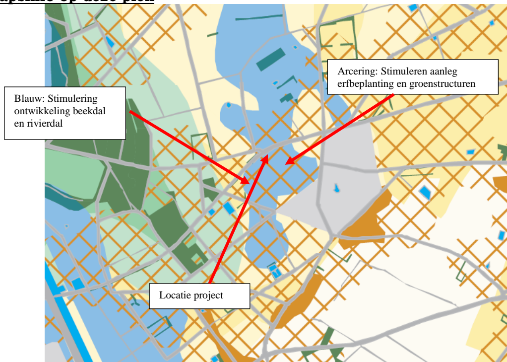
Figuur 3: Handreiking vanuit Landschapskader provincie Limburg

Vanuit het Landschapskader staat aangegeven dat de locatie gelegen is in een zone waar sterk wordt ingezet op stimulering erfbeplanting en groenstructuren. Gelegen in een beekdal, dus hier is aankleding gericht op dit landschapstype.