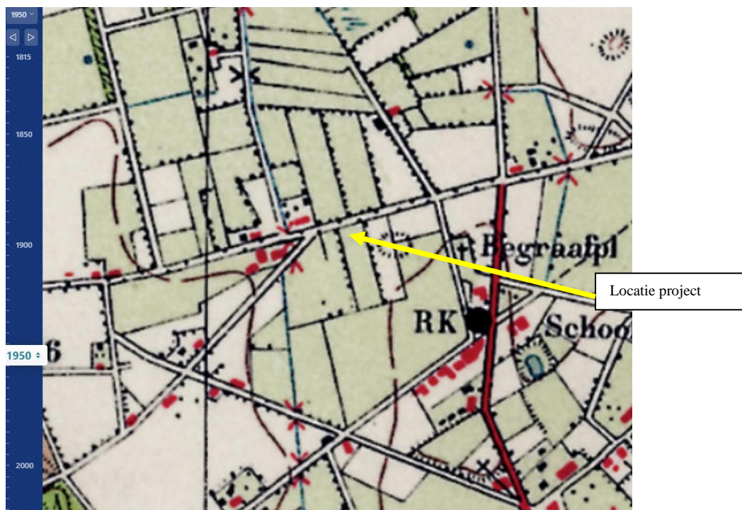
Figuur 2: Locatie van project op kaart 1950