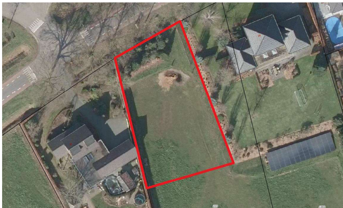
Figuur 4.1. Ligging van het plangebied (rood omlijnd).

Het plangebied bevindt zich in de noordwesthoek van het dorp Melderslo. Aan de west- en oostzijde grenzen vrijstaande woningen. Ten noorden bevindt zich de Daniëlweg met daarachter woningen. Aan de zuidzijde grenst het plangebied aan een weiland. Het plangebied zelf bestaat uit een weiland met aan de noordzijde wat opgaande vegetatie, waaronder enkele kleine naaldbomen.