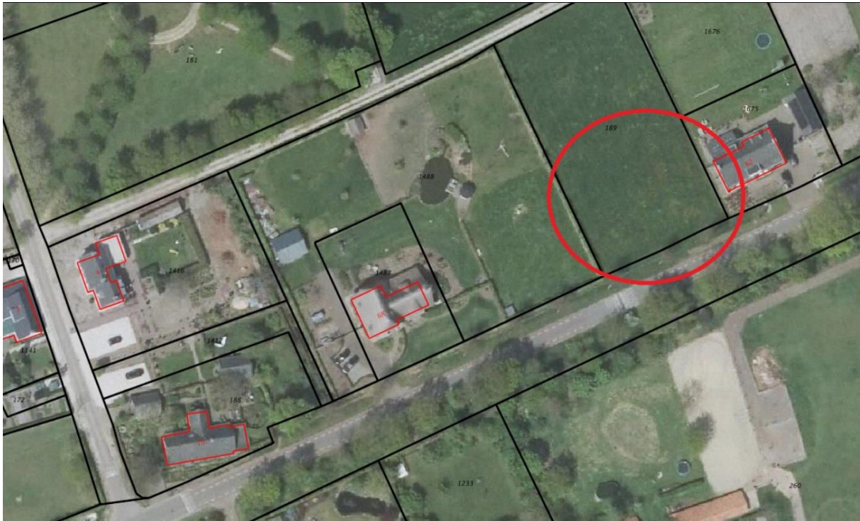
Figuur 1. Het plangebied (rood omcirkeld).

Pijnenburg agrarisch advies & onroerend goed begeleidt de realisatie van een woning aan de Daniëlweg te Melderslo (Gemeente Horst aan de Maas). Pijnenburg agrarisch advies & onroerend goed heeft ecologisch adviesbureau Faunaconsult opdracht gegeven op deze locatie een flora- en fauna-inspectie uit te voeren. De ligging van het plangebied is weergegeven in figuur 1.