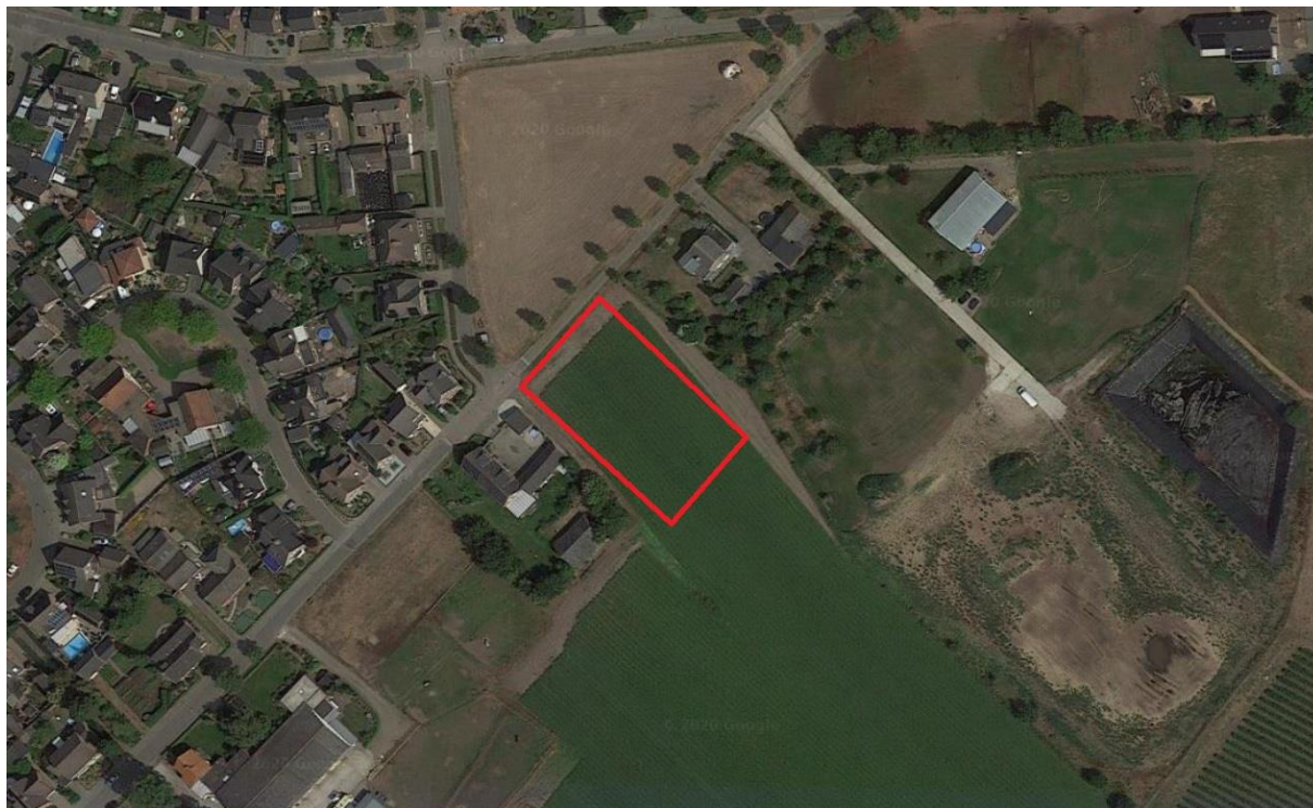
Figuur 4.1. Ligging van het plangebied (rood omlijnd).

Het plangebied is weergegeven in figuur 4.1. Het is gelegen in het oosten van de dorpskern van Melderslo. De noordwestzijde van het plangebied is begrensd door de Blaktweg met daarnaast een grasveld. Aan de zuidoostzijde grenst het plangebied aan een akker. De overige zijdes grenzen aan woningen met tuinen. Het plangebied zelf is ook in gebruik als akker (zie foto's voorzijde). In het plangebied zijn soorten aanwezig als melganzenvoet, duizendblad, vogelmuur, teunisbloem, winterpostelein, zachte ooievaarsbek, grote brandnetel, groot kaasjeskruid en late guldenroede.