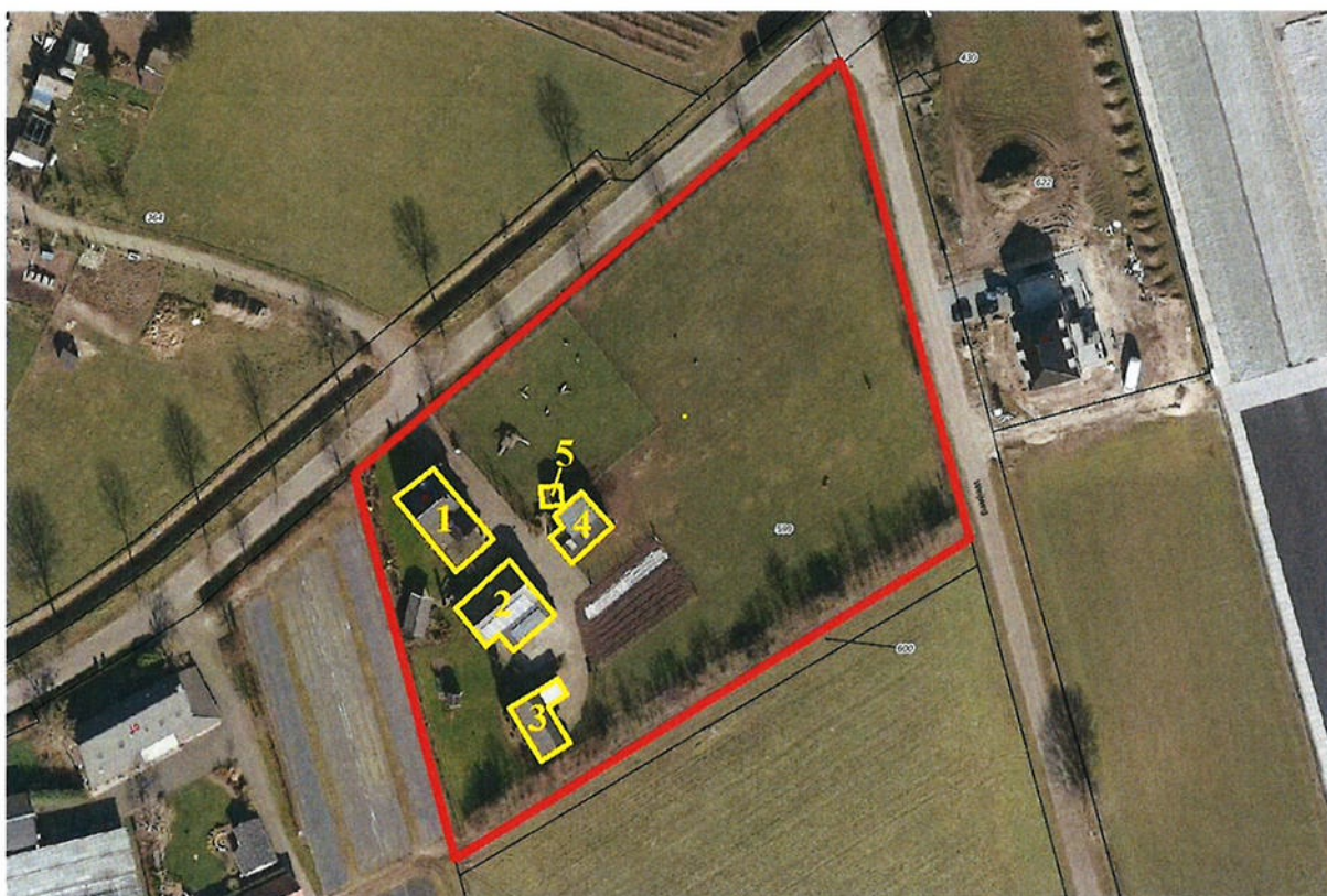
Figuur 4.1. Het plangebied (rood omlijnd) met de verschillende gebouwen.

In het plangebied zelf bevinden zich een woning met aanbouw, een voormalige ketelhuis, een halfopen werkschuur, een stal/hooiopslag en een geitenstalletje. Bij de gebouwen is verharding aanwezig. Aan de westzijde van de verharding bevindt zich een grasveld en aan de oostzijde een grote weide voor pony's en dwerggeiten. Verder komen er algemeen voorkomende plantensoorten voor als fluweelboom, hortensia en taxus.