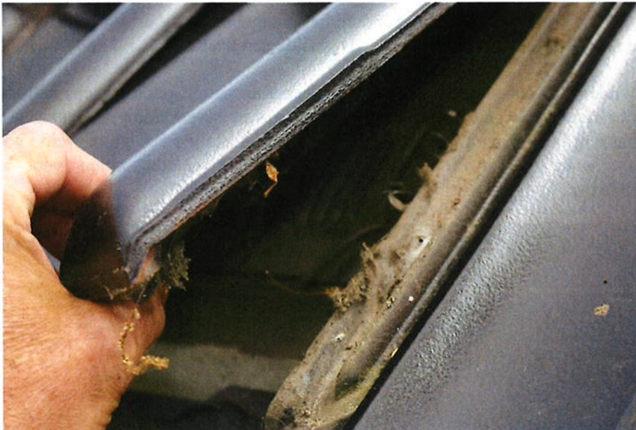
Figuur 4.2.1. Onder de eerste rij dakpannen van de woning en aanbouw is vogelschroot aanwezig.

kruipen. Er zijn echter nergens vleermuizen uitwerpselen rond of in de kier en op de gevel aanwezig, waardoor het niet aannemelijk is dat hier een vleermuisverblijf aanwezig is. Alleen in de westgevel van de woning zijn vier stootvoegen aanwezig. Doordat de spouw hier is na-geïsoleerd (opgevuld met korrels), hebben vleermuizen hier geen toegang tot de spouw. (Jaarrond beschermde) vogelnesten en vleermuisverblijven zijn in dit gebouw dus afwezig.