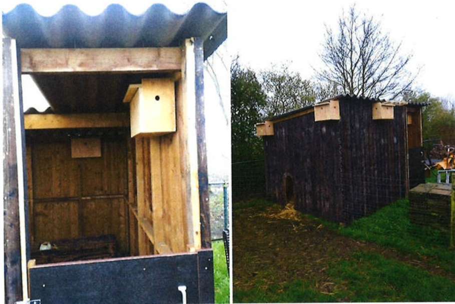
Figuur 6.1. De in/tegen de nieuwe geitenstal gerealiseerde huismussennestkasten.

worden voldaan door extra hagen en bomen aan te planten (zie figuur 3.1). Daarnaast zal het houden van geiten resulteren in het ontstaan van kale bodems waar mussen stofbaden kunnen nemen en waar onkruiden als straatgras etc. kunnen kiemen. Om aan punt 4 te voldoen zullen er tegen de nieuwe werkloods 10 huismussennestkasten worden opgehangen, zie figuur 3.1.