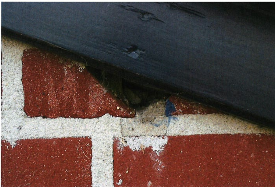
Figuur 4.2.4. In de enkele gaten in de gevel bevindt zich specie.

Het voormalige ketelhuis (2 in figuur 4.1) bevat een enkelwandig dak van isolatieplaten en een dubbele stenen gevel zonder echte spouw (de gevels zijn tegen elkaar aan gebouwd). Binnen in het gebouw zijn geen vogelnesten, vleermuisuitwerpselen of steenmarteruitwerpselen aanwezig. In de voorgevel zitten enkele gaten maar deze zijn volledig opgevuld met specie (zie figuur 4.2.4). Daarmee is het voorkomen van (jaarrond beschermde) vogelnesten en vleermuisverblijven in dit gebouw uitgesloten.