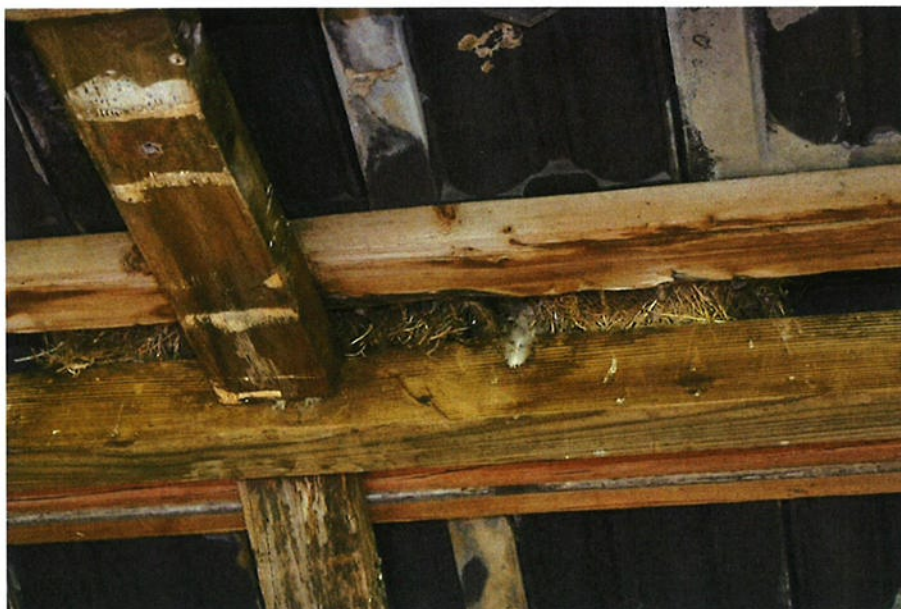
Figuur 4.2.5. Op de nokbalk van het geitenstalletje zijn vijf huismusnesten aanwezig.

Het geitenstalletje (5 in figuur 4.1) bevat een enkelwandig dak en enkelwandige gevels. Het dak bevat echter een nokbalk waar 5 huismusnesten op aanwezig zijn (zie figuur 4.2.5). Tijdens het veldbezoek vlogen er ook huismussen via de nok naar binnen. Dit duidt erop dat de nesten in gebruik zijn. Overige vogelnesten en vleermuisverblijven zijn in het stalletje afwezig.