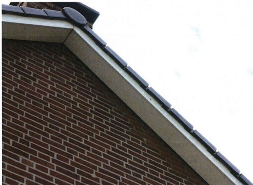
Figuur 4.2.2. Het boeiboord is te glad voor vogels of vleermuizen om onder de gevelpannen te komen.