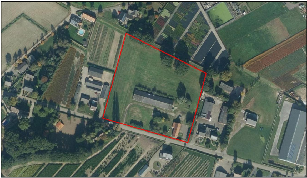
Figuur 2. Luchtfoto van het plangebied en de directe omgeving