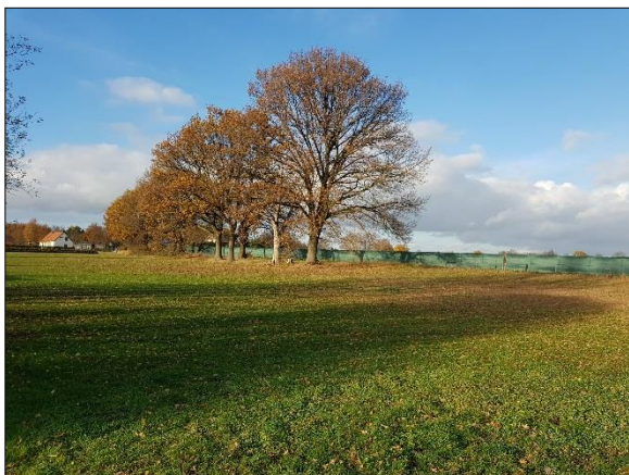
Figuur 8. Weiland en bomen in noordelijk deel plangebied