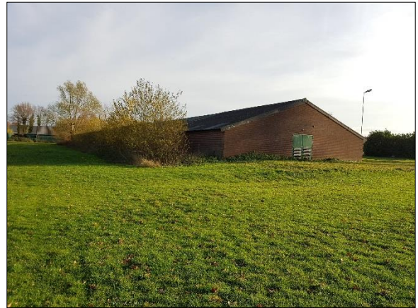
Figuur 5. Loods/stal vanaf noordwesten