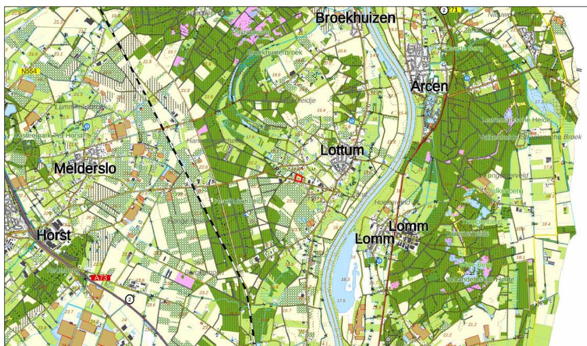
Figuur 1. Topografische kaart ligging van het plangebied (1:25.000)

Het plangebied is gelegen ten zuidoosten van Lottum, gemeente Horst aan de Maas. In figuur 1 is de topografische ligging van het plangebied weergegeven.