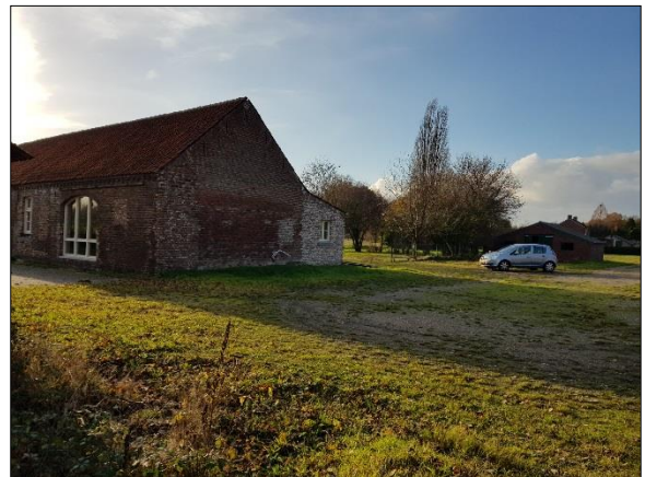
Figuur 7. Woonhuis (links) en schuurtje (rechts)