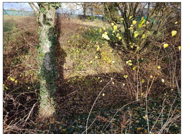
Figuur 9. Verdieping land in opgaand groen ten noordoosten loods/stal