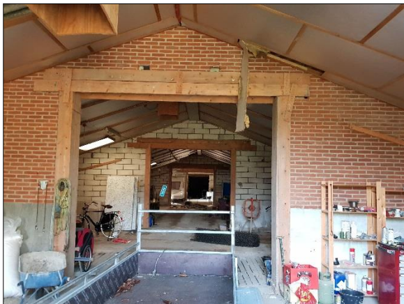
Figuur 6. Loods/stal aan binnenzijde