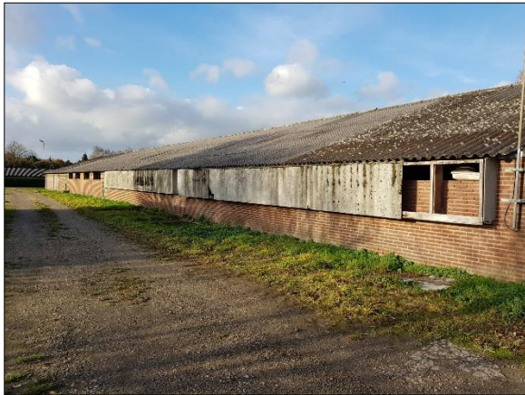
Figuur 4. Loods/stal vanaf zuidoosten