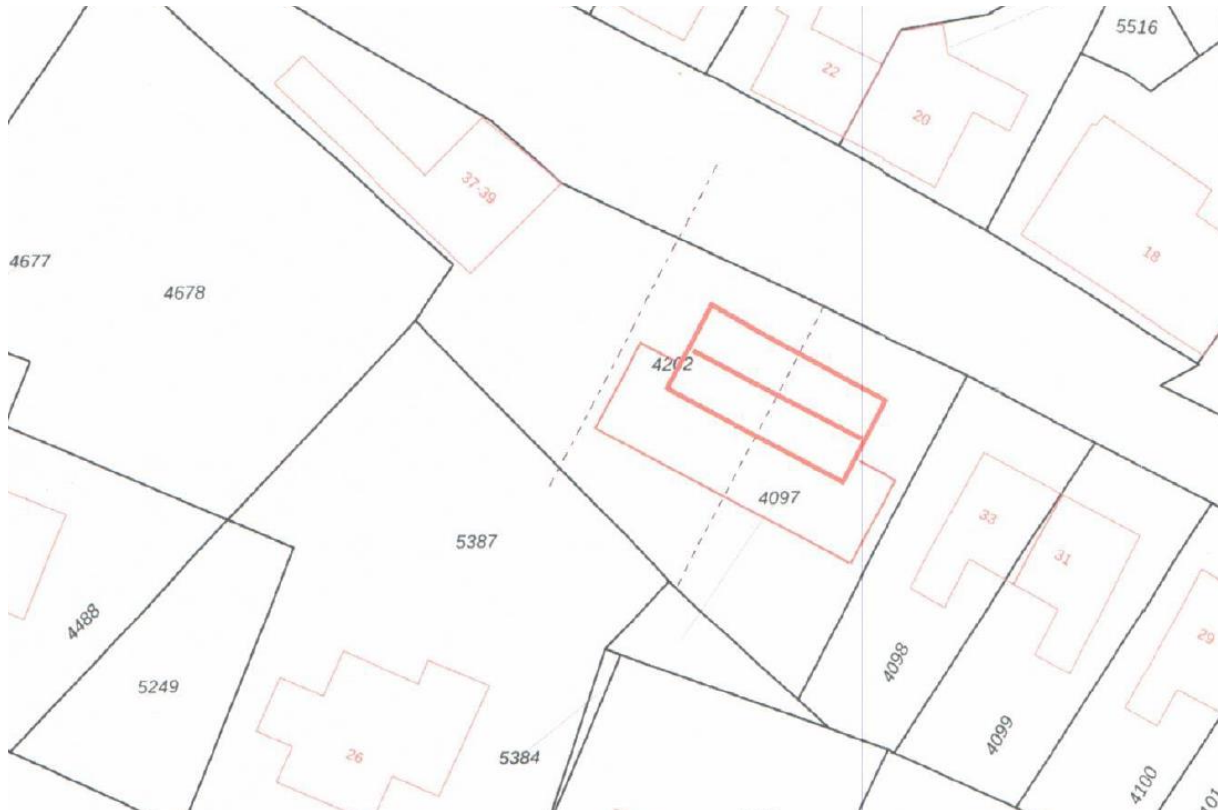
Figuur 3.1. De voorgestane situatie.

De bestaande vegetatie wordt verwijderd. Op deze locatie worden vervolgens twee woningen gebouwd (zie figuur 3.1).