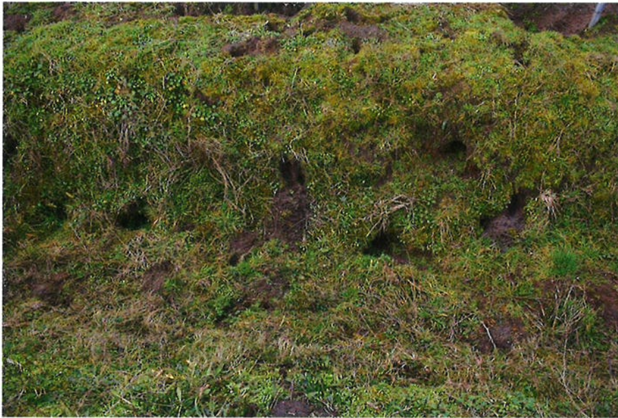
Figuur 4.2.3. In de greppel in deelgebied 1 zijn hollen en graafsporen van konijnen aanwezig.