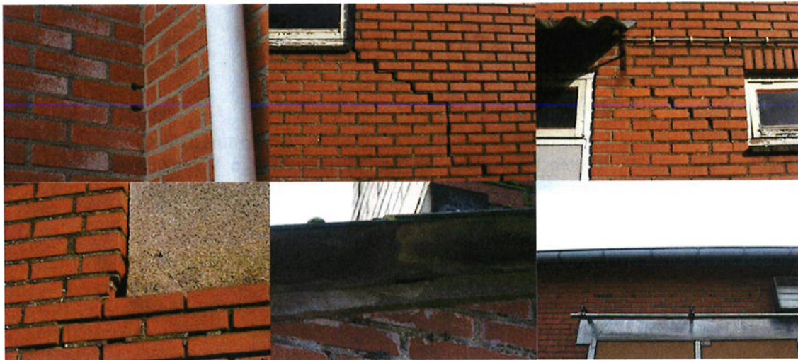
Figuur 4.2.1. Het opslaggebouw bevat meerdere kieren en gaten, en open stootvoegen waardoor vleermuizen de spouw kunnen bereiken.