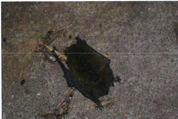
Figuur 4.2.2. In het opslaggebouw is een dode gewone dwergvleermuis aangetroffen.

In het gehele plangebied zijn geen bomen aanwezig. Daarmee zijn verblijven van boombewonende vleermuissoorten, uilen- en roofvogelnesten en eekhoornnesten uitgesloten. Overige vogelnesten zijn eveneens nergens waargenomen.