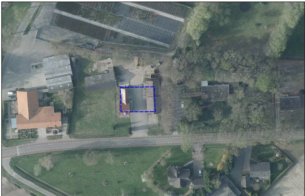
Figuur 3.1 Planindeling

In het akoestisch onderzoek wordt de geluidsbelasting op de toekomstige geluidgevoelige bestemming inzichtelijk gemaakt en getoetst aan het toetsingskader. Voor het plangebied is geen kavelandeling opgesteld. Derhalve is er uitgegaan van het toekomstige bouwvlak. Voor elke zijde van het bouwvlak zijn toetspunten ten behoeve van maximaal 3 bouwlagen gemodelleerd. In figuur 3.1 is het gehanteerde bouwvlak weergegeven.