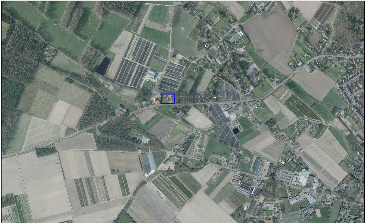
Figuur 1.1 Plangebied

Econsultancy heeft van Arvalis Oirlo opdracht gekregen voor het uitvoeren van een akoestisch onderzoek wegverkeerslawaaï voor de bestemmingsplanwijziging van het perceel aan de Horsterdijk 68 te Lottum. In figuur 1.1 is de situering van het plangebied globaal weergegeven. De initiatiefnemer is voornemens om een woning te realiseren op de locatie.