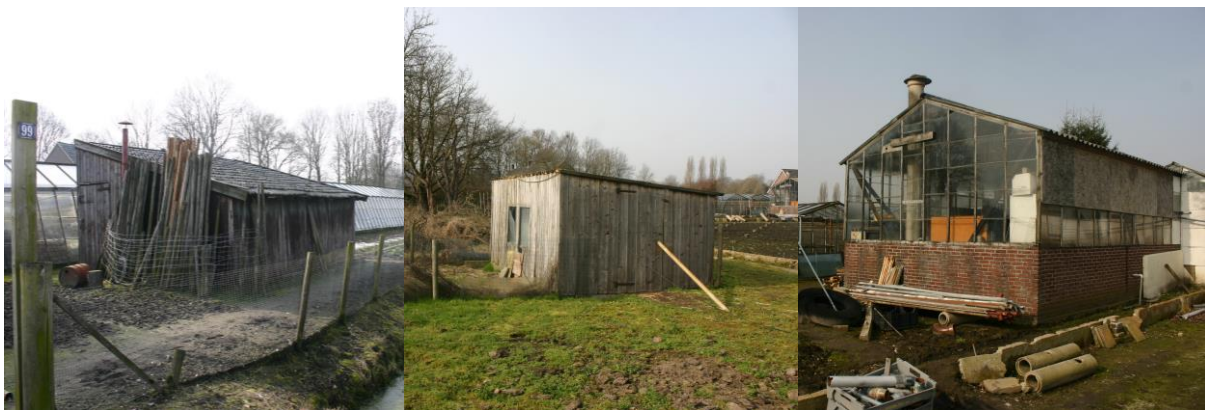
Figuur 4.2.2. V.l.n.r.: Bijgebouw aan de zijde van de Amerikaanseweg; het kippenhok; het bijgebouw aan de kassen.

Ook de drie bijgebouwtjes (zie figuur 4.2.2) vertoonden aan de binnenzijde nergens sporen van vleermuizen, vogels of andere dieren. In alle gebouwen in het plangebied zijn vleermuisverblijven dus afwezig.