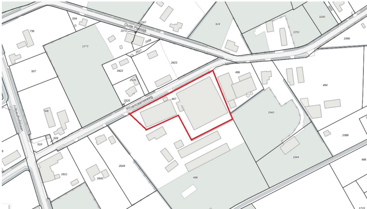
Figuur 4.1. Ligging van het plangebied (rood omlijnd).

Het plangebied (zie figuur 4.1) is gelegen ten zuiden van de dorpskern van Meterik. De noord-, zuid- en westzijde van het plangebied zijn begrensd door woningen met tuinen. In het oosten ligt een glastuinbouwbedrijf. Het plangebied zelf is ook in gebruik als glastuinbouwbedrijf (zie foto's voorzijde rapport). Het bestaat uit drie kassen, twee bijgebouwtjes, een kippenhok en een moestuin. In het plangebied zijn soorten aanwezig als fijnspar, kers, zachte ooievaarsbek, paarse dovenetel, veldzuring, vogelmuur, vroegeling en kleefkruid.