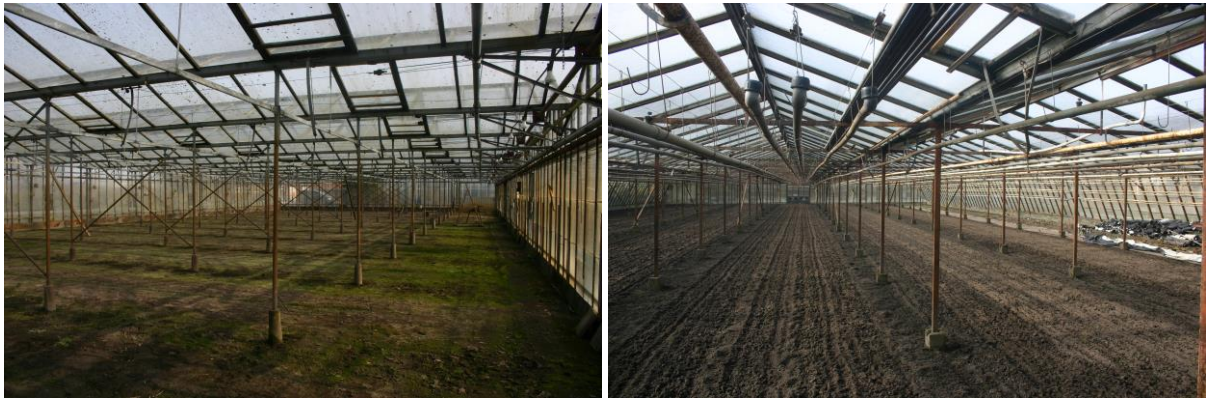
Figuur 4.2.1. Aan de binnenzijde van de oostelijk (links) en westelijk (rechts) gelegen kas werden nergens vleermuizen, vogelnesten, uitwerpselen, eierschalen etc. waargenomen.

Ook de drie bijgebouwtjes (zie figuur 4.2.2) vertoonden aan de binnenzijde nergens sporen van vleermuizen, vogels of andere dieren. In alle gebouwen in het plangebied zijn vleermuisverblijven dus afwezig.