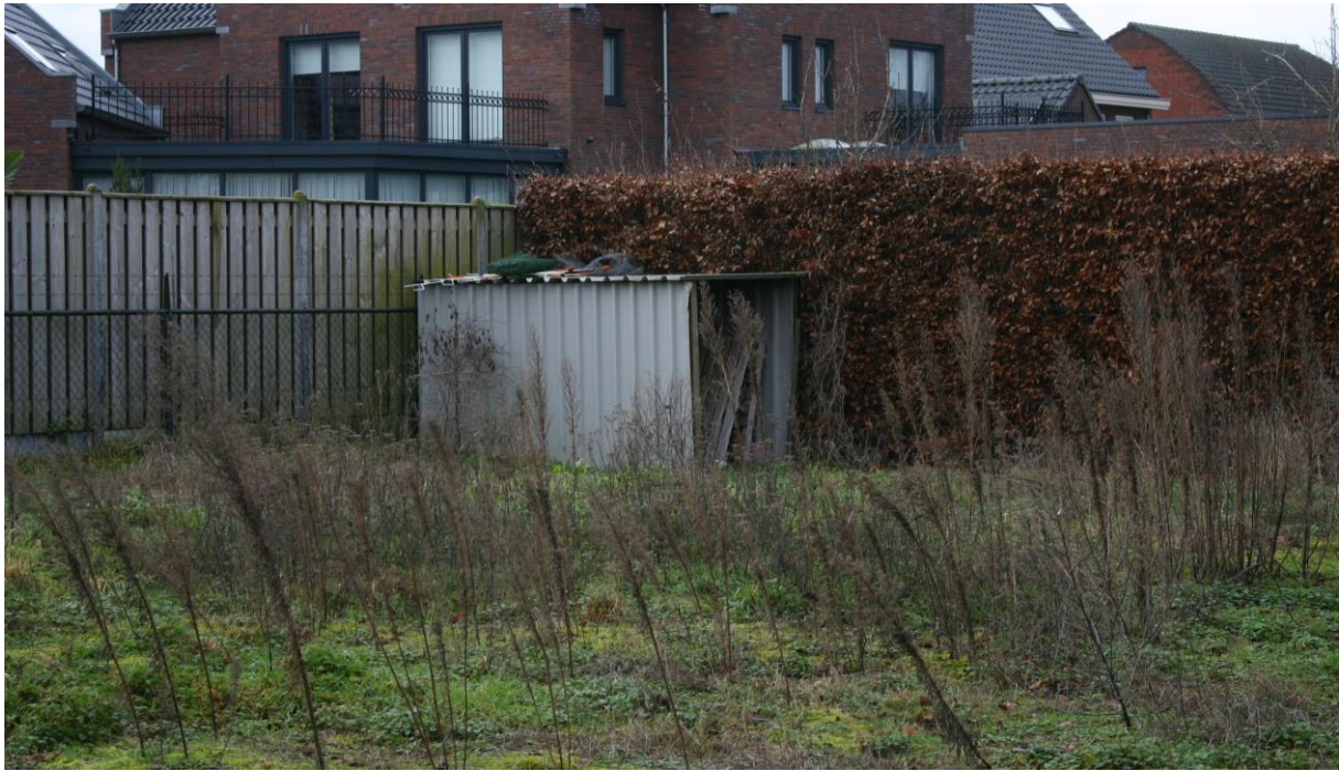
Figuur 4.2. In het plangebied bevindt zich een enkelwandig stalletje met golfstalen wanden en dak. Het is momenteel in gebruik als opslag.