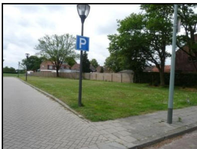
Figuur 3. Noordzijde onderzoekslocatie.