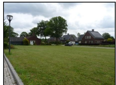
Figuur 5. Zuidzijde onderzoekslocatie.