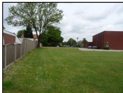
Figuur 4. Westzijde onderzoekslocatie.