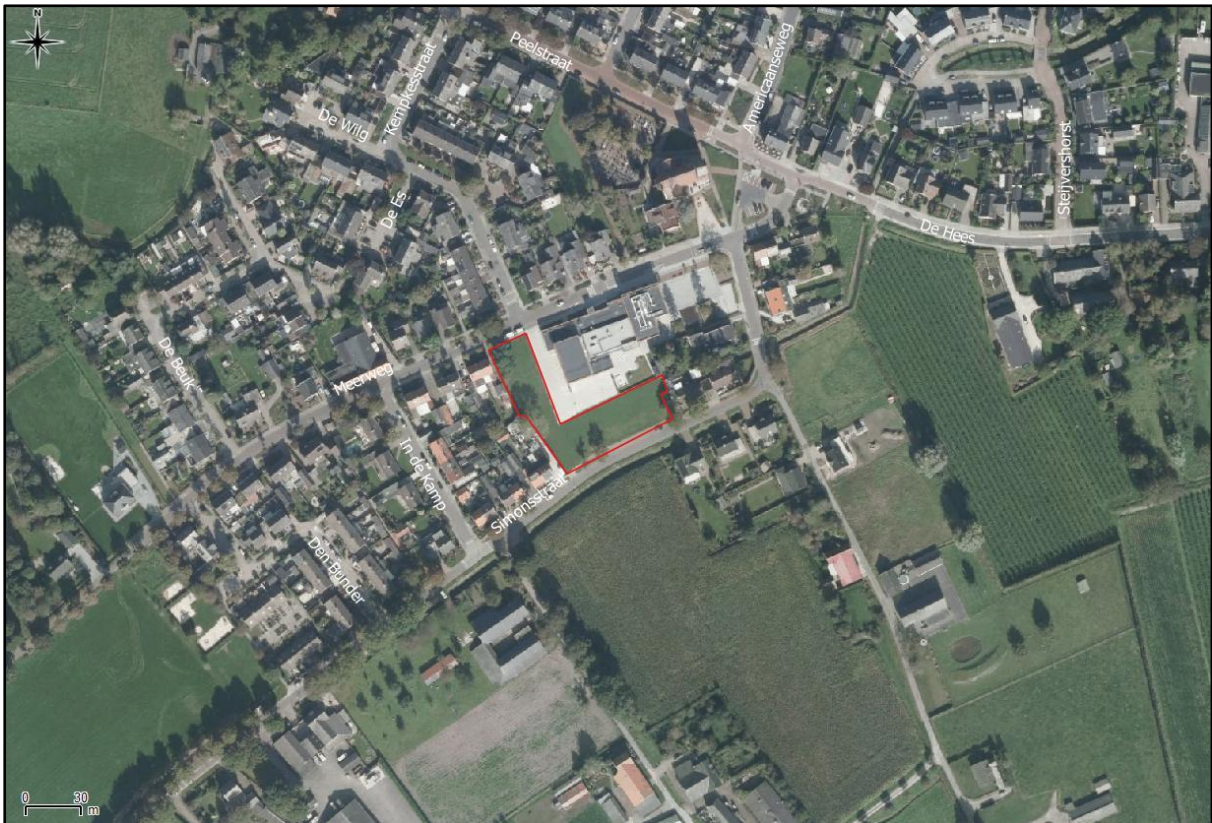
Figuur 2. Luchtfoto onderzoekslocatie en directe omgeving.