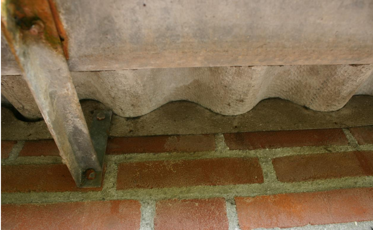
Figuur 4.2.1. Onder de golfplaten is vogelschroot aanwezig.

Aan de oostzijde van de westelijk gelegen stal bevinden zich ventilatie stenen met daar omheen houten bekistingen (zie figuur 4.2.2). Doordat de opening van die bekistingen zich op enkelhoogte bevindt en er voor de bekistingen hoog gras groeit, zijn deze openingen niet toegankelijk voor vleermuizen. Overige openingen in gevels zijn afwezig. Vleermuisverblijven zijn in de westelijke stal dus afwezig. Het is wel mogelijk dat algemene, grondgebonden zoogdieren zoals de veldmuis kunnen in het plangebied voorkomen.