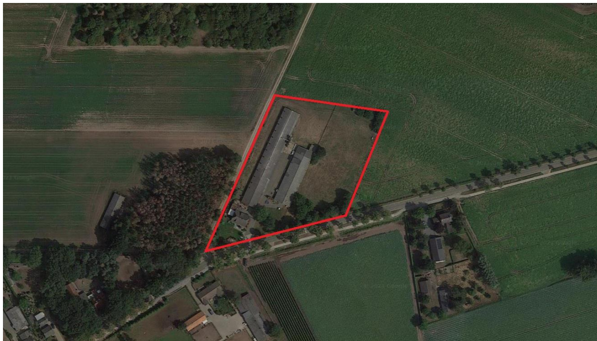
Figuur 4.1. Ligging van het plangebied (rood omcirkeld).

Het plangebied (zie figuur 4.1) bevindt zich ten westen van de kern van Kronenberg. De omgeving is agrarisch ingericht. Het plangebied zelf bestaat uit twee voormalige varkensstallen en een bedrijfswoning. Daarnaast is er gazon, wei en zijn er verhardingen aanwezig. Omdat de bestaande woning met tuin, de wei en een groot deel van de oostelijke stal worden behouden, vallen deze buiten het feitelijke plangebied. In het plangebied komen soorten voor als zachte ooievaarsbek, paardenbloem, herderstasje, grote brandnetel, witte klaver, ridderzuring en vogelmuur.