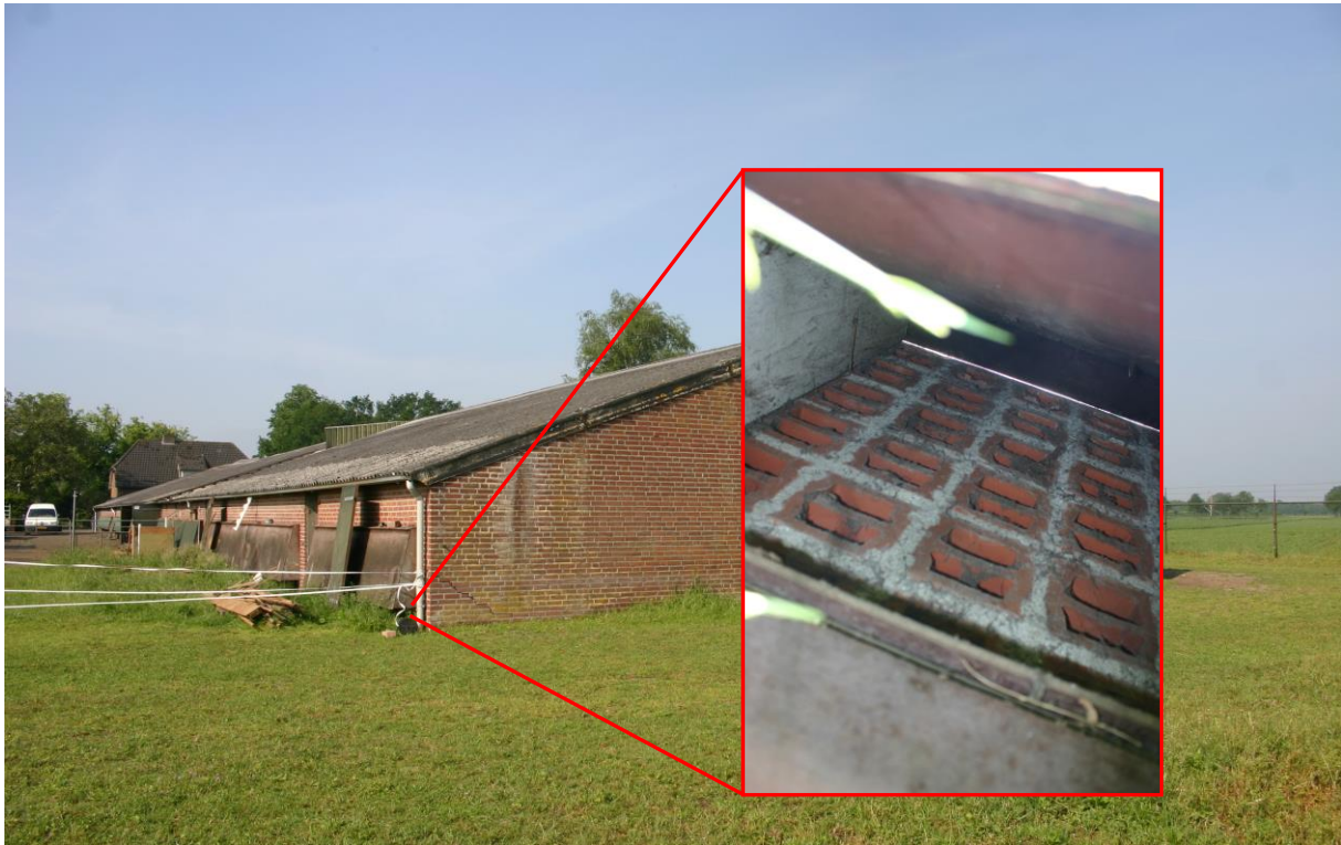
Figuur 4.2.2. De ventilatiestenen zijn toegankelijk voor kleine, grondgebonden zoogdieren, maar bevinden zich te laag bij de grond voor vleermuizen.

Aan de binnenzijde van de westelijke stal werden drie boerenzwaluwnesten waargenomen. Op één van deze nesten werd gedurende het veldbezoek gebroed. De overige twee nesten waren (deels) vervallen. Het betreft hier dus feitelijk één boerenzwaluwnest. In Limburg zijn nesten van de boerenzwaluw jaarrond beschermd (Gedeputeerde Staten van Limburg, 2017).