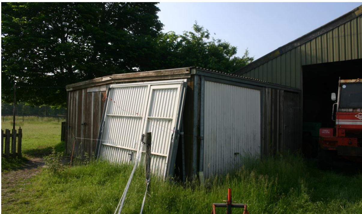
Figuur 4.2.3. In het schuurtje zijn vogelnesten en vleermuisverblijven afwezig.

Volgens de natuurgegevens van de Provincie Limburg ( www.natuurgegevensprovincielimburg.nl ) waren er in 2015 (niet nader getoonde) territoria van roofvogels/uilen in het kilometerhok van het plangebied aanwezig. Uit de veldinspectie blijkt echter dat nesten van deze soorten zeker niet in het plangebied voorkomen. De omgeving van het plangebied is in 2011 en 2015 op het voorkomen van beschermde of bijzondere planten onderzocht. Deze waren afwezig rond het plangebied ( www.natuurgegevensprovincielimburg.nl ). Dit blijkt ook uit het veldonderzoek (zie paragraaf 4.1).