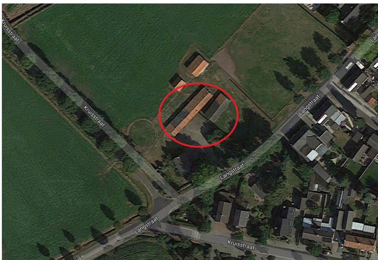
Figuur 3. De (deels) te slopen schuren (rood omcirkeld).

Het plangebied bevindt zich aan de westzijde van de bebouwde kom van Hegelsom, op de overgang van de bebouwde kom en het landelijk ingerichte gebied. In figuur 3 zijn de (deels) te slopen schuren rood omcirkeld.