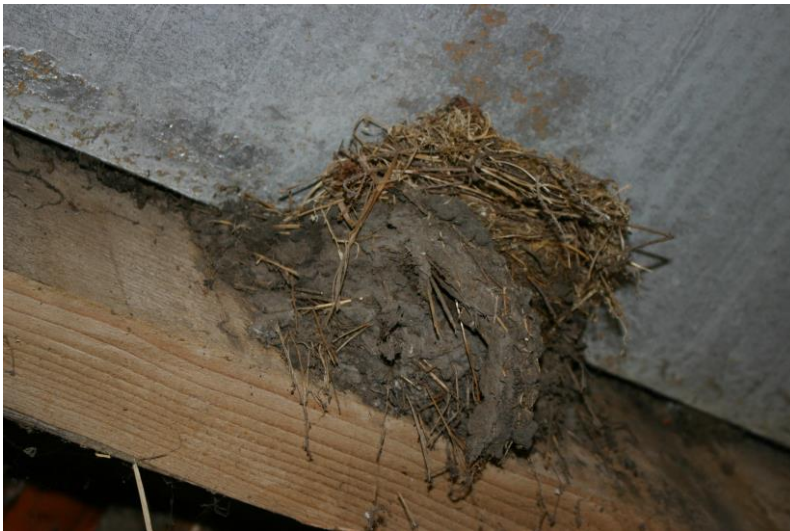
Figuur 5. Voormalig boerenwaluwnest waarop een winterkoning zijn nest heeft gebouwd.

Op een van de balken werd tijdens het veldbezoek een oud boerenwaluwnest aangetroffen, waarop een winterkoning een nest had gemaakt (zie figuur 5). Hieruit blijkt dat de boerenwaluw deze schuur niet meer als nestlocatie heeft gebruikt. Ook was er op twee balken een verlaten merelnest aanwezig.