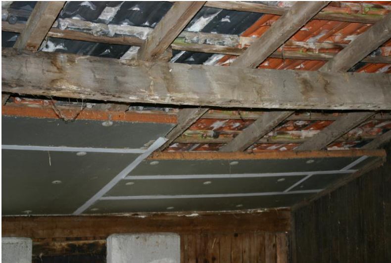
Figuur 4. In een deel van de grote schuur is gladwandig dakbeschoot aanwezig.

zijn de ruimten tussen het dakbeschoot en de dakpannen feitelijk ook ongeschikt voor dieren als huismus, steenuil en vleermuizen.