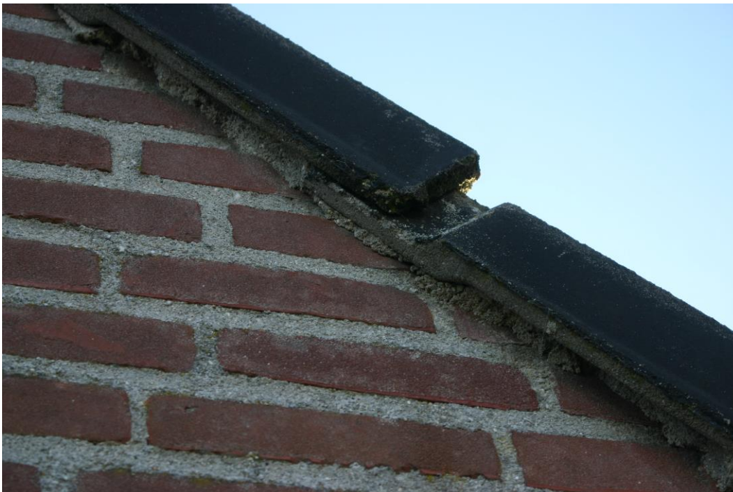
Figuur 4.2.2. De gevelpannen op de woning zijn in de specie gelegd.