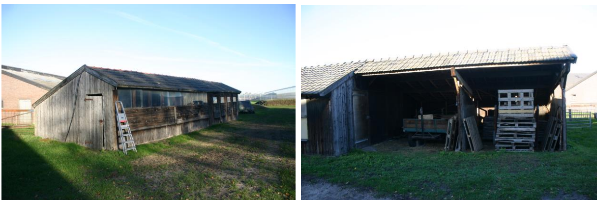
Figuur 4.2.4. Beide schuren zijn volledig enkelwandig.

Het dak en de gevels van beide schuren (zie figuur 4.2.4) zijn enkelwandig en in de schuren zijn geen vogelnesten, vleermuisuitwerpselen etc. aanwezig. Vleermuisverblijven zijn in de schuren dus afwezig.