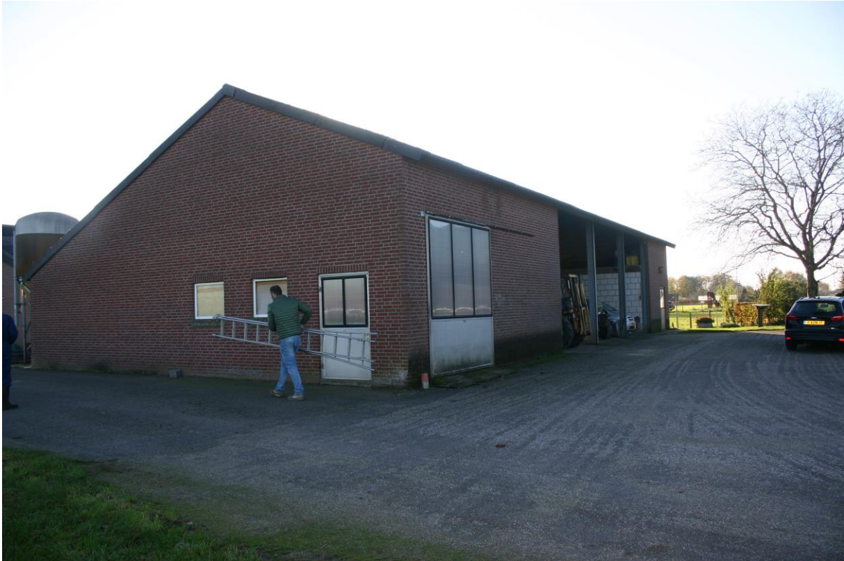
Figuur 4.2.3. De werktuigenstalling.

De werktuigenstalling (zie figuur 4.2.3) bevat gevels met spouw en open stootvoegen, maar de spouw is overal van boven open (geen muurplaat aanwezig). Hierdoor heerst er een zeer tochtig klimaat in de spouwen, zodat de aanwezigheid van vleermuisverblijven is uit te sluiten. Het dak is enkelwandig en vogeluitwerpselen, steenmarteruitwerpselen, braakballen etc. zijn afwezig. Vogelnesten of vleermuisverblijven zijn in de werktuigenstalling dus afwezig.