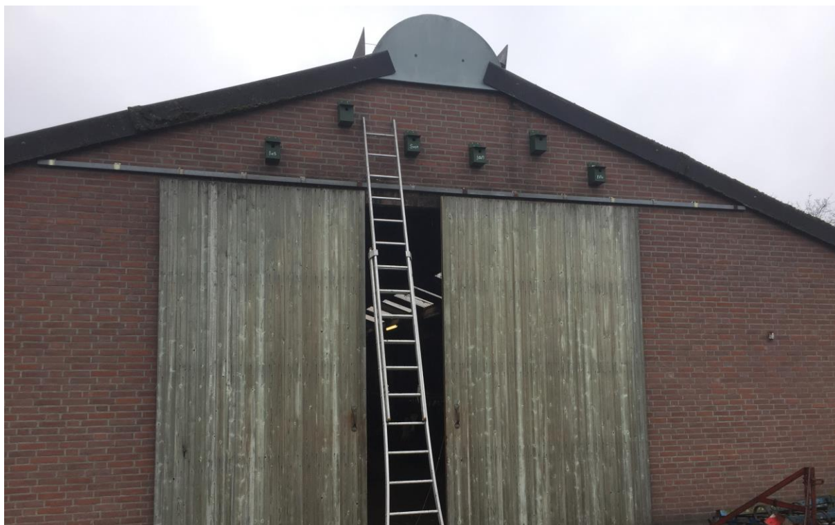
Figuur 6. Op 22 november 2020 zijn de tijdelijke huismusnestkasten ter mitigatie opgehangen.

Voor elk nest dat verloren gaat, dienen er meerdere alternatieve nestlocaties voor de huismus in de nieuwe situatie te worden gerealiseerd (BIJ12, 2017). Dat kan door het plaatsen van 6 nestkasten tegen de noordoostgevel van de te behouden jongveestal. Op 22 november 2020 is er een zestal huismusnestkasten tegen de noordoostgevel geplaatst (zie figuur 6). Huismussen hebben de tijd nodig om aan nieuwe nestplaatsen te wennen. Gedurende deze gewenningsperiode moeten zowel de oorspronkelijke situatie als de nieuw aangebrachte vervangende voorzieningen beiden aanwezig zijn (minimaal 3 maanden voor de start van de sloopwerkzaamheden). Dit dient te gebeuren onder begeleiding van een deskundige.