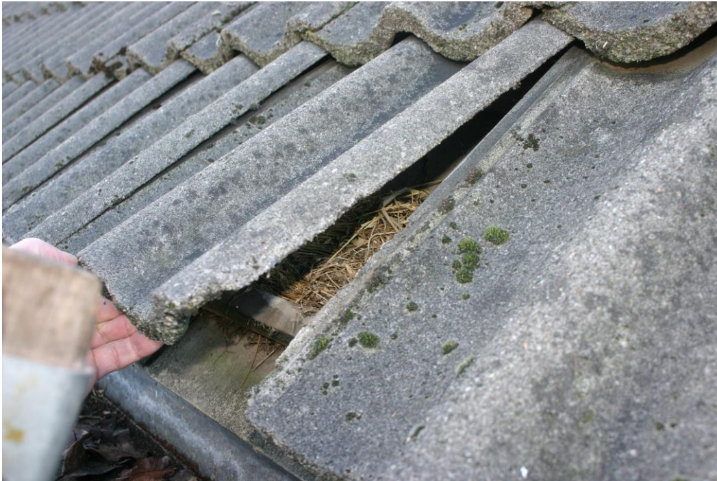
Figuur 4.2.1. Eén van de drie huismusnesten in de woning.

Onder de onderste rijen dakpannen van de woning (zie grote foto voorzijde) is geen vogelschroot aanwezig, zodat vogels hier kunnen nestelen. Tijdens het veldbezoek werd er onder alle onderste dakpannen gekeken en daarbij werden 3 huismusnesten aangetroffen (zie figuur 4.2.1). De gevelpannen zijn in de specie gelegd (zie figuur 4.2.2), zodat het onmogelijk is dat via de kopgevels vleermuizen of vogels het dak in kunnen gaan. Open stootvoegen of andere openingen zijn in de woning afwezig. Gierzwaluwnesten of vleermuisverblijven zijn in de woning dus afwezig.