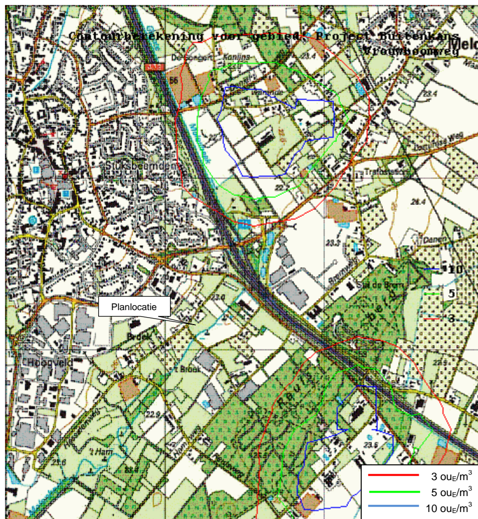
Figuur 3: Achtergrond geurbelasting omgeving locatie Vrouwboomweg