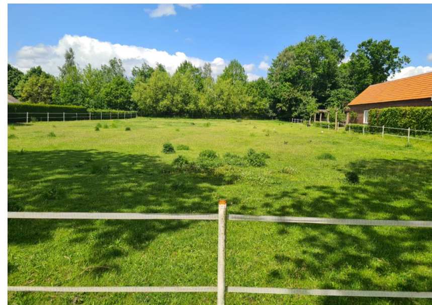
Figuur 4: Overzicht plangebied gezien vanaf de Vrouwboomweg