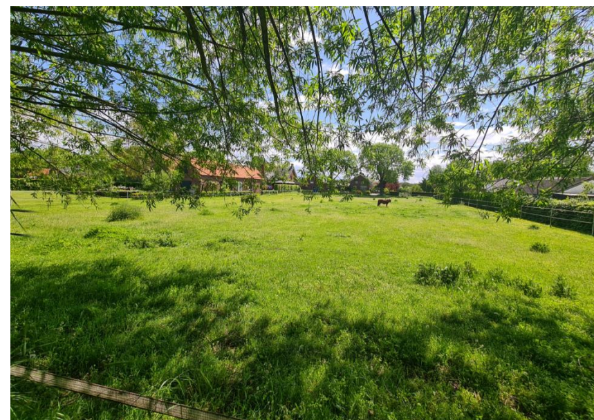
Figuur 7: Overzicht plangebied vanuit het noordwesten