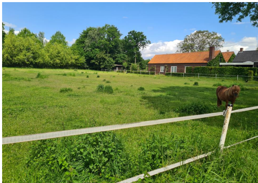
Figuur 3: Overzicht plangebied vanuit het zuidwesten