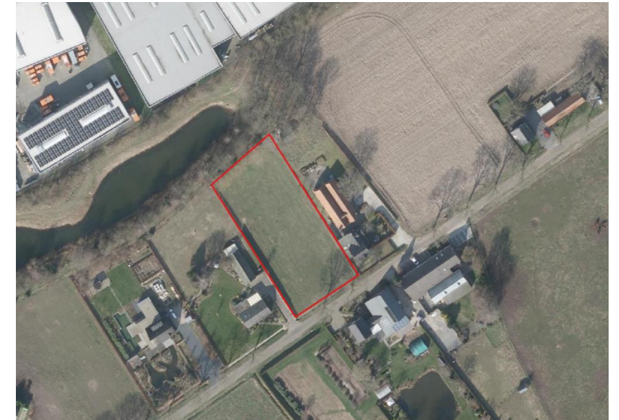
Figuur 2: Luchtfoto plangebied en directe omgeving