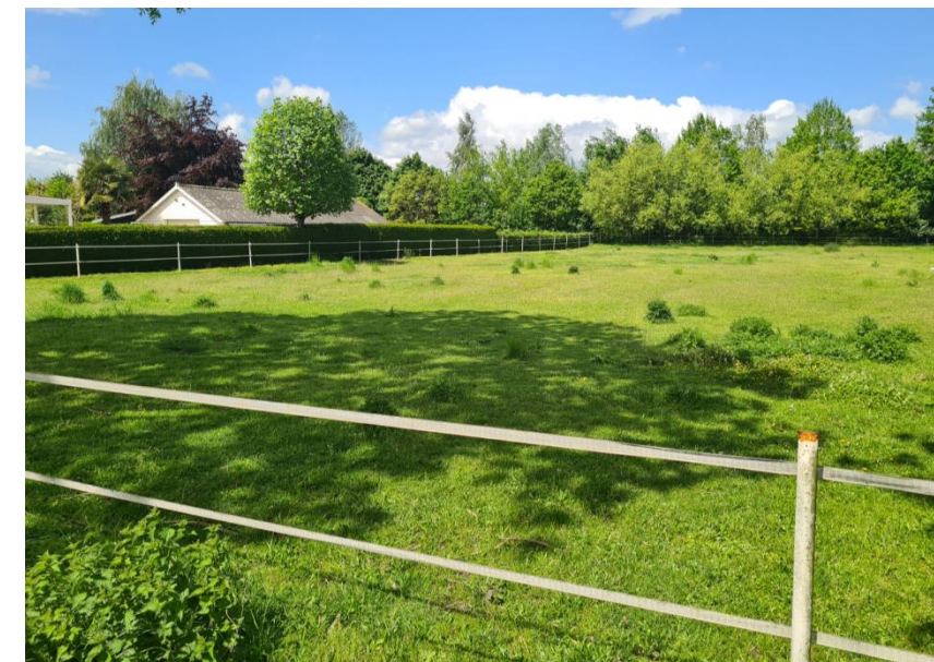
Figuur 5: Overzicht van het plangebied vanuit het zuidoosten