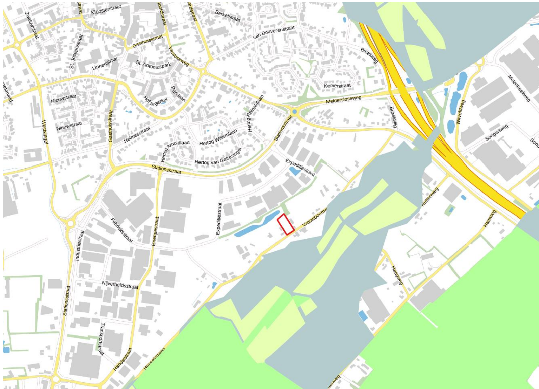
Figuur 9: Ligging goudgroene natuurzone (groen), zilvergroe natuurzone (geel), bronsgroene landschapszone (blauw) en Natura 2000-gebieden (paars gearceerd) ten opzichte van perceel plangebied (rood omlijnd)