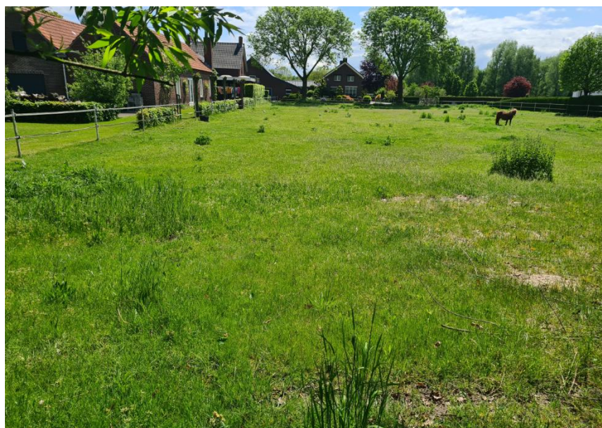
Figuur 6: Overzicht plangebied vanuit het noordoosten