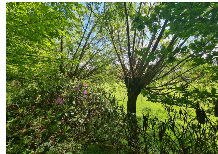
Figuur 8: Naastgelegen begroeiing in het noordwesten van het plangebied