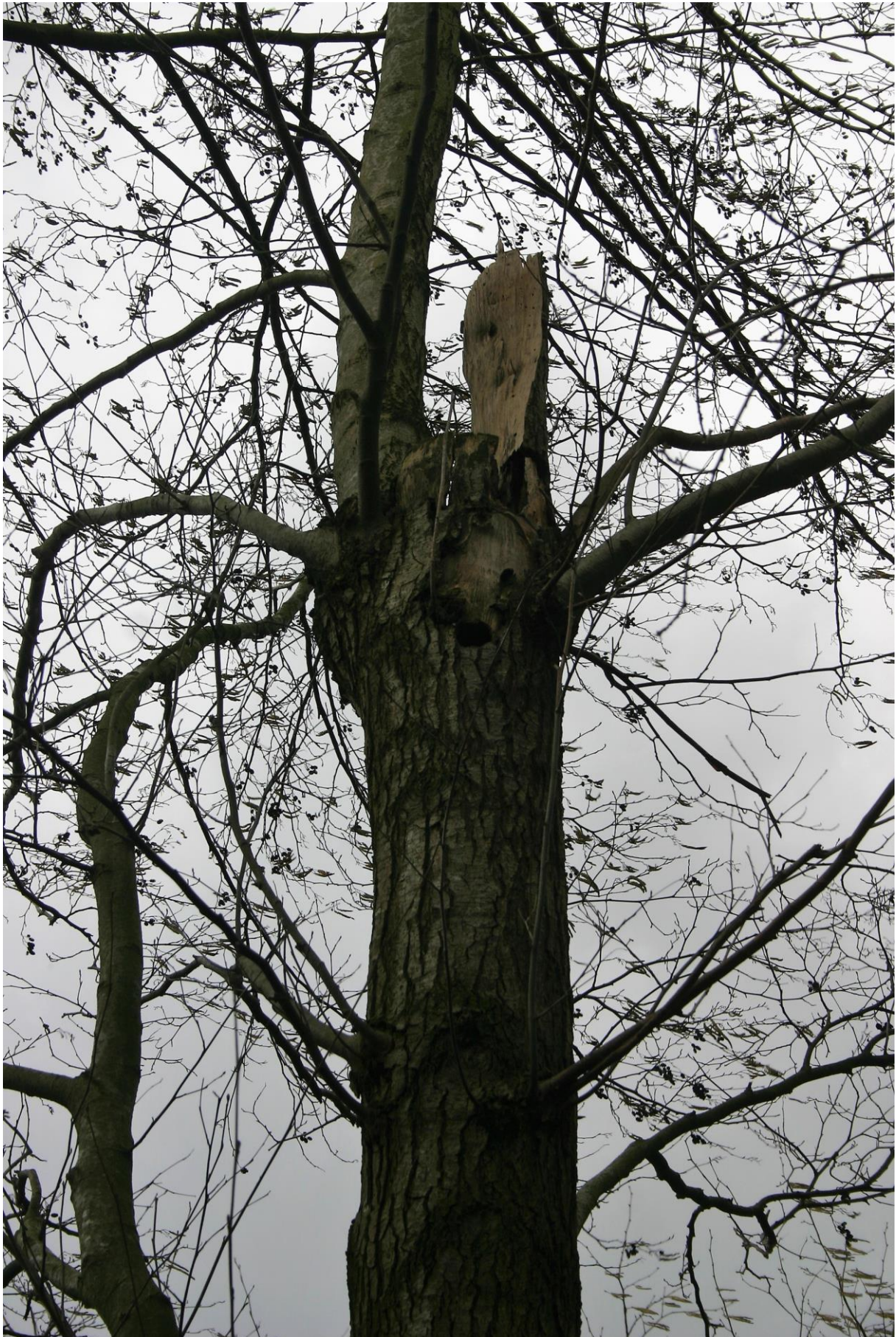
Figuur 5. De boom met het spechtenhol dat van boven helemaal open is.