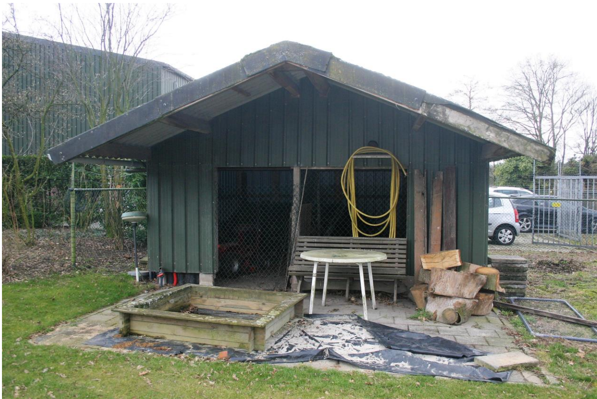
Figuur 6. Het tuinhuisje.

In het plangebied werd verder een aantal konijnenholen en molshopen aangetroffen. Sporen, wissels, uitwerpselen etc. van overige zoogdieren, die behoren tot de categorieën ‘Internationaal beschermde soorten’ zijn tijdens het veldbezoek niet aangetroffen. Tabel 1 geeft de mogelijk voorkomende beschermde zoogdieren in het plangebied weer.