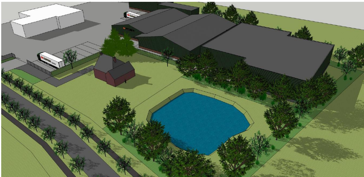
Figuur 3. De voorgestane situatie.