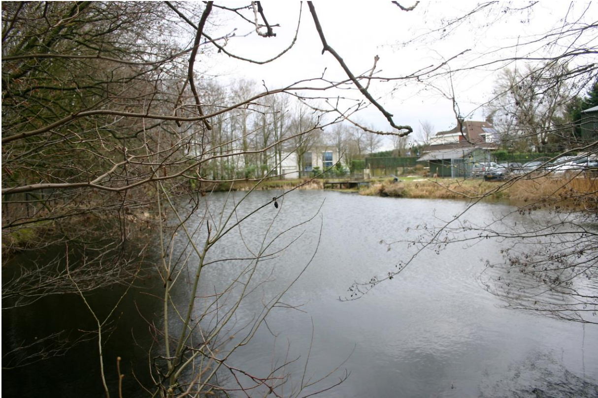
Figuur 4. De infiltratievijver met rechts het parkeerterrein en het tuinhuisje.