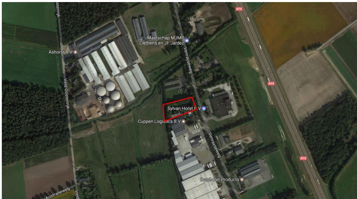
Figuur 1. Ligging van het plangebied (rood omlijnd).

Pijnenburg agrarisch advies & onroerend goed begeleidt de uitbreiding van Cuppen Logistics aan de Venrayseweg 143 in Horst. Op deze locatie ligt een perceel dat nu voornamelijk bestaat uit een infiltratievijver voor het aangrenzende bedrijventerrein en dat een groenbestemming heeft (zie figuur 1). Het bedrijventerrein wil ter plaatse van deze groenbestemming uitbreiden; de bestemming zal dus moeten worden gewijzigd naar 'bedrijventerrein'. De bedoeling is om de infiltratievijver op termijn geheel te dempen en het groen eromheen voor een deel te kappen en vervolgens het perceel te bebouwen. Pijnenburg heeft ecologisch adviesbureau Faunaconsult opdracht gegeven hiertoe een flora- en fauna-inspectie uit te voeren.