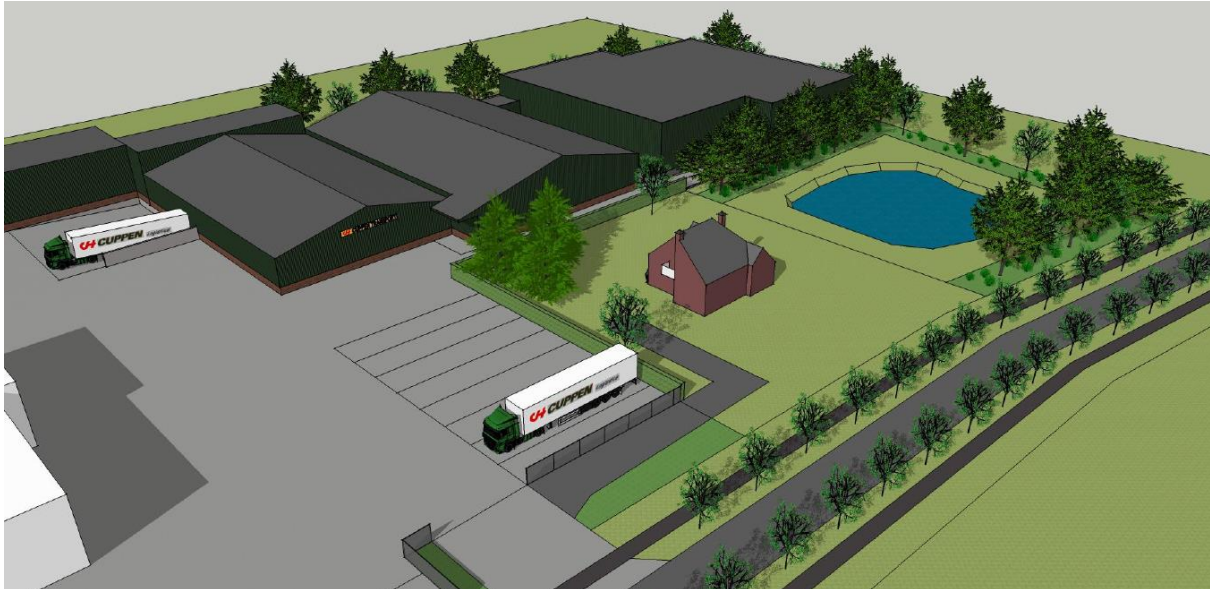
Figuur 2. De voorgestane situatie.

De infiltratievijver in het plangebied zal op termijn geheel worden gedempt en een deel van de houtsingel zal worden gekapt. Hierna zal er een bedrijfshal worden gerealiseerd (zie figuren 2 en 3).