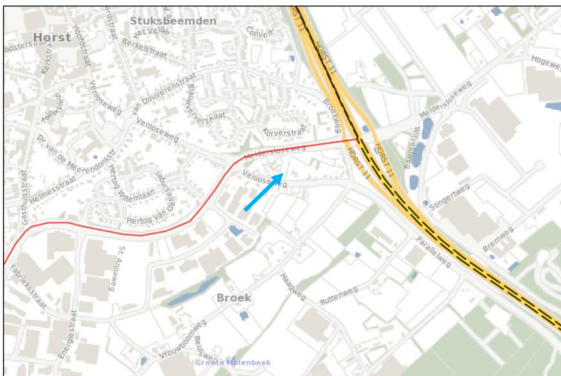
Uitsnede risicokaart met globale ligging plangebied (blauwe pijl)

Door de provincie Limburg is een risicokaart samengesteld waarop de meest belangrijke risico-veroorzakende bedrijven en objecten zijn aangegeven. Het gaat hierbij onder meer om risico's van opslag van patronen, stofexplosies, opslag van gasflessen, ammoniakinstallaties, LPG-tankstations enz.