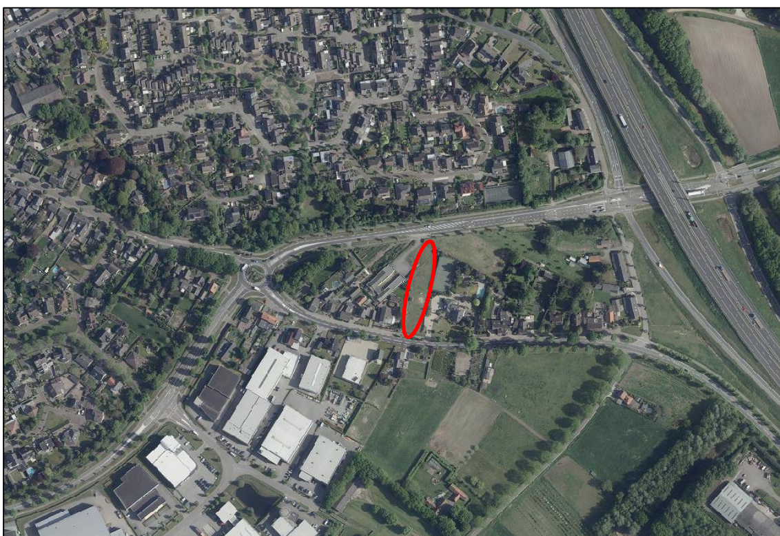
Luchtfoto met globale ligging plangebied (rood omcirkeld) en omgeving

Het plangebied ligt aan de rand van het stedelijk bebouwd gebied, aan een bebouwingslint met voornamelijk woningen. Aan de zuidwestzijde ligt een bedrijventerrein, aan de zuidoostzijde ligt het agrarisch gebied en verder ten noorden ligt de woonwijk Stuksbeemden.