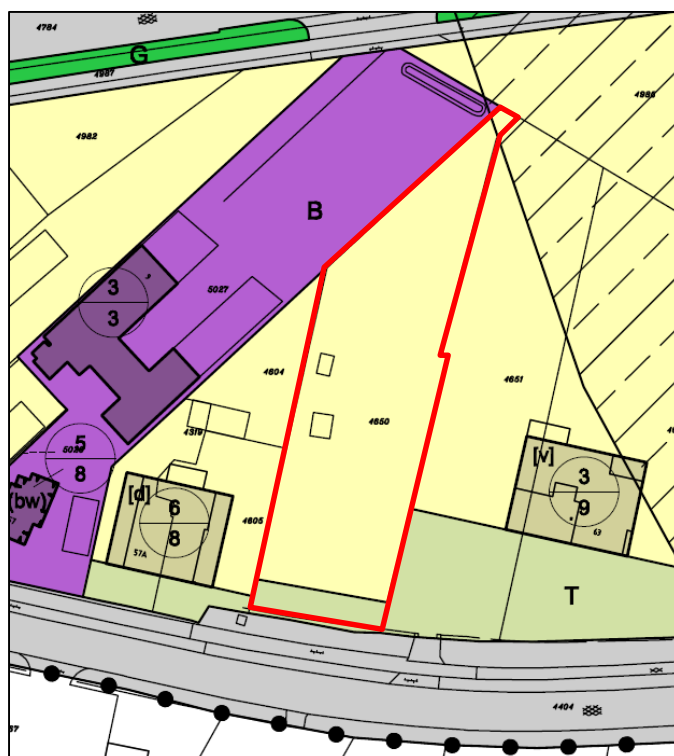
Uitsnede verbeelding bestemmingsplan 'Peelkernen' met ligging plangebied (rood omlijnd)

Ter plaatse van de dubbelbestemming 'Veiligheidszone – Snelweg' zijn de gronden tevens bestemd voor de bescherming van het woon- en leefklimaat in verband met het vervoer van gevaarlijke stoffen over de snelweg A73. Nieuwe kwetsbare en beperkt kwetsbare objecten zijn op basis van deze dubbelbestemming niet toegestaan. In dit deel van het plangebied zijn geen woningbouwontwikkelingen voorzien, waardoor deze ligging binnen de veiligheidszone geen belemmering vormt. Bovendien blijkt uit paragraaf 5.2.6 van deze toelichting dat er geen belemmeringen zijn voor de voorliggende ontwikkeling vanwege het vervoer van gevaarlijke stoffen over de A73.