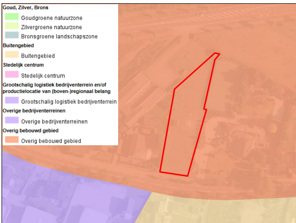
Uitsnede POL2014-kaart 'Zonering Limburg' met ligging plangebied (rood omlijnd)