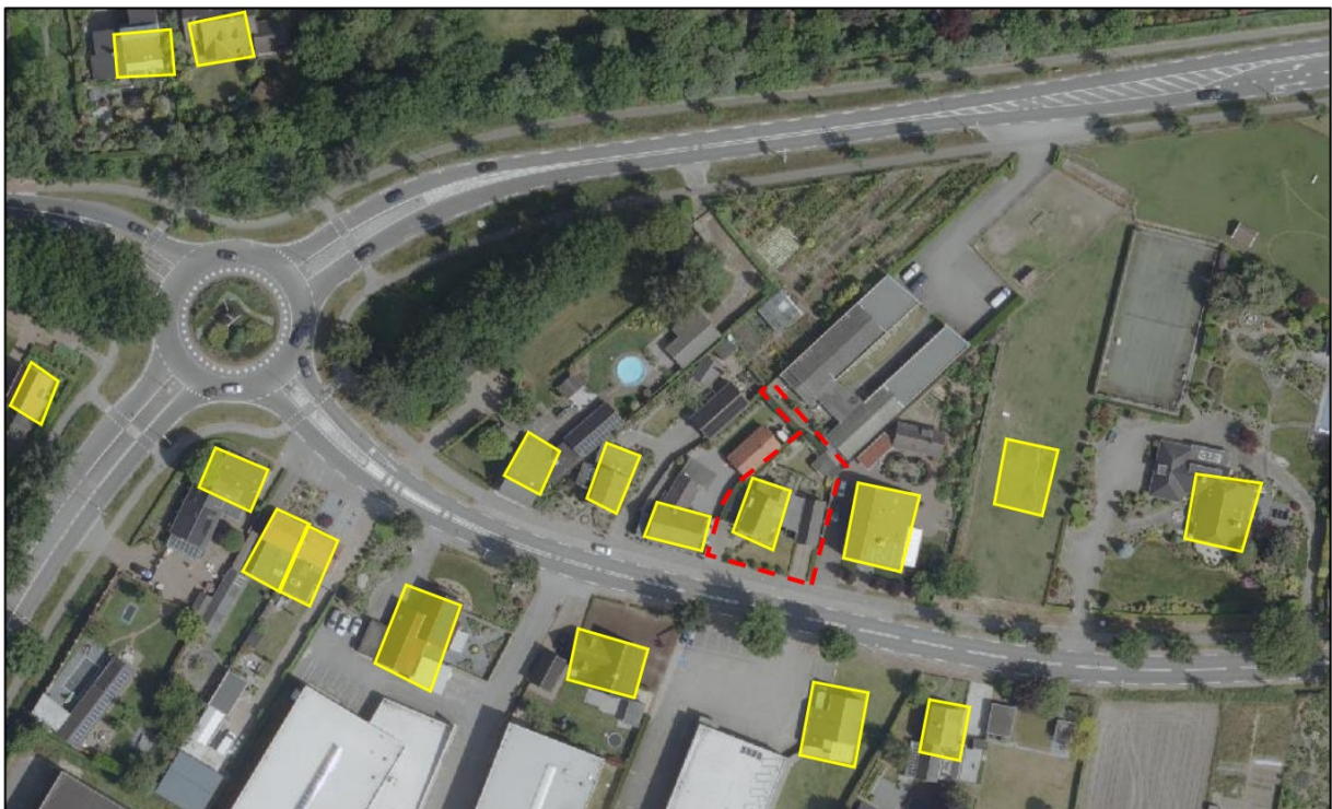
Afbeelding 5 Toekomstige situatie als burgerwoning

Er ontstaan dan twee separate locaties, de bedrijfsruimte aan de achterzijde welke reeds voorzien is van een eigen entree aan de Meldersloseweg en de woning aan de voorzijde eveneens voorzien van een eigen entree maar dan aan de Venloseweg. Het omzetten van de bedrijfswoning naar burgerwoning sluit uit functioneel oogpunt goed aan op de omgeving, daar de omliggende woningen allen burgerwoningen betreffen.