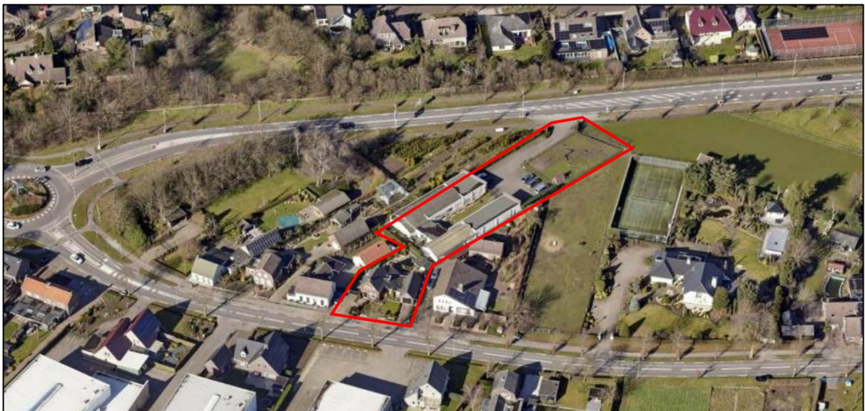
Afbeelding 4 Luchtfoto plangebied

Het plangebied is al sinds 1982 in gebruik voor bedrijfsactiviteiten, specifiek voor de kunstgalerie en lijstenmakerij. In de loop der jaren zijn er diverse burgerwoningen rondom het plangebied gebouwd. Rond 2004 is aan de overzijde het bedrijventerrein Hoogveld uitgebreid richting de Venloseweg. Feitelijk gezien wordt de gehele locatie ingeklemd door aan de zuidzijde de Venloseweg en aan de noordzijde de Meldersloseweg. Het bedrijf wordt ontsloten aan de Meldersloseweg en de woning aan de Venloseweg. Hierdoor is er sprake van twee afzonderlijke locaties.