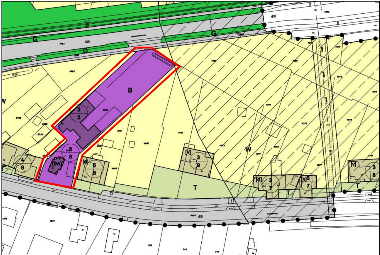
Afbeelding 3 Uitsnede vigerend omgevingsplan