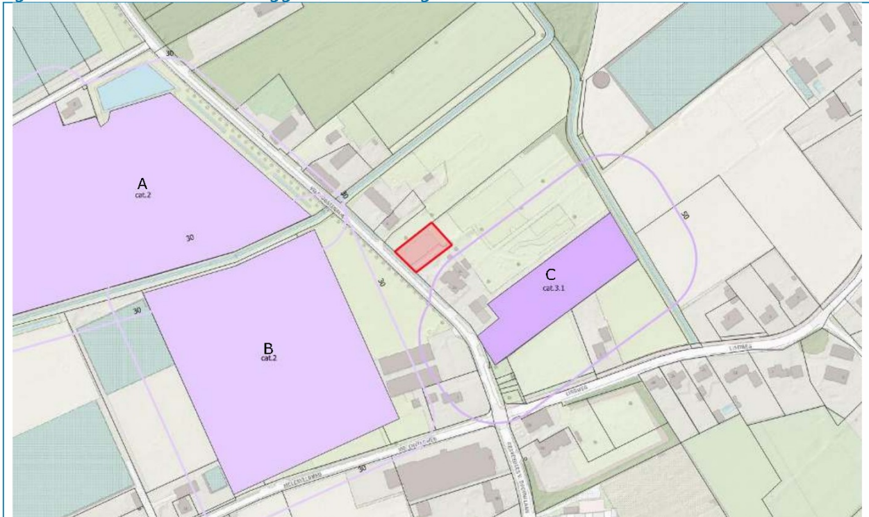
figuur 3: richtafstanden omliggende inrichtingen

In de omgeving van de onderzoekslocatie bevinden zich enkele bedrijven, zie ook figuur 3.