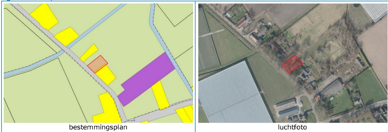
figuur 2: impressie onderzoekslocatie

Opdrachtgever is voornemens om op de onderzoekslocatie een nieuwe woning te realiseren. De plannen passen niet binnen de vigerende bestemming. De locatie bevindt zich buiten de bebouwde kom van Horst. In de omgeving bevinden zich zowel bestaande woningen van derden als verschillende bedrijven. Tevens bevindt de locatie zich binnen de invloedssfeer van enkele omliggende wegen. Onderstaande figuur 2 geeft een impressie van de onderzoekslocatie.