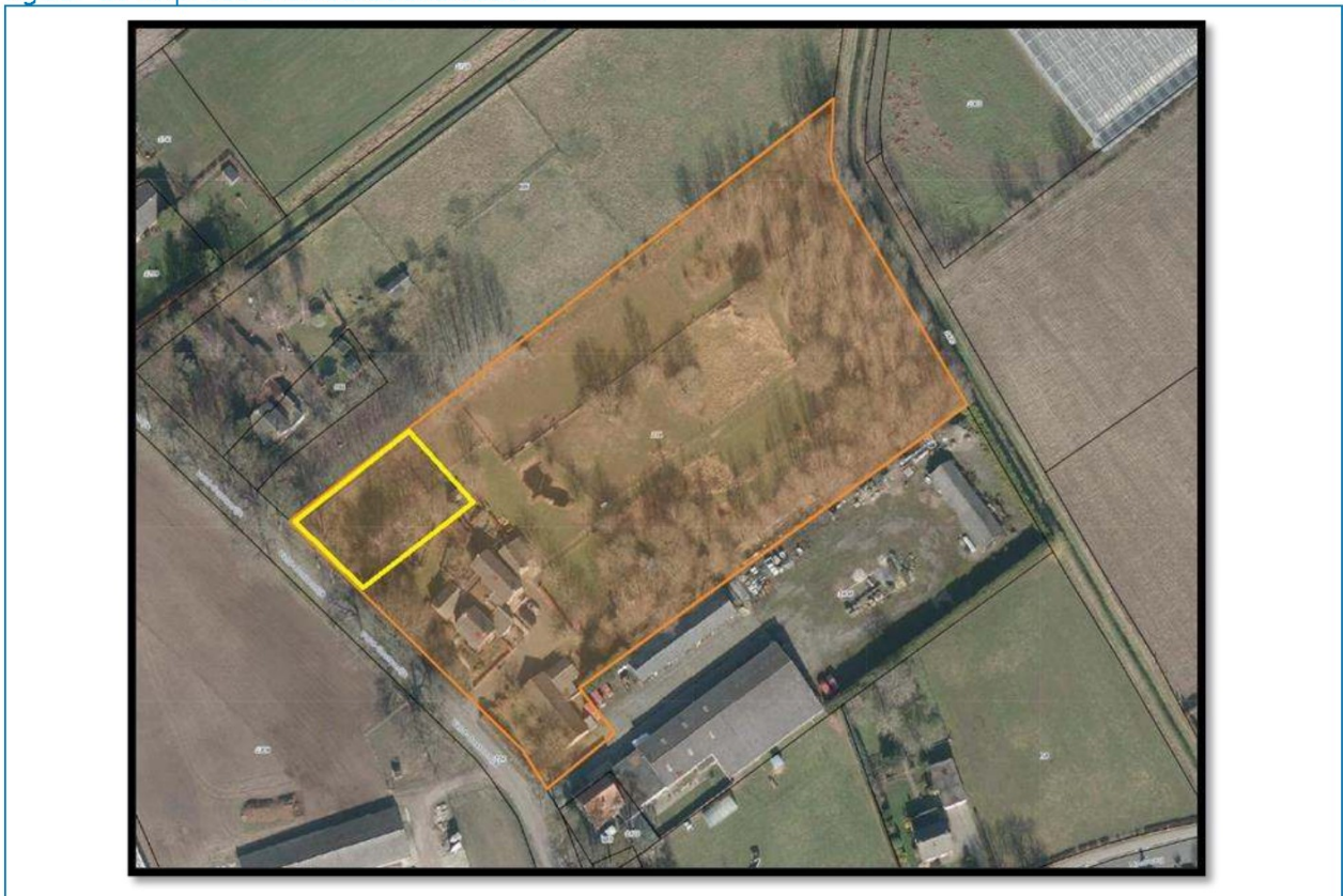
figuur 1: impressie onderzoekslocatie

Het voorliggende rapport doet verslag van de uitgangspunten en berekening.