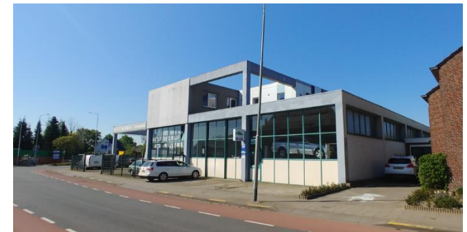
Figuur 6: Plangebied gezien vanuit het noorden, vanaf de Doolgaardstraat