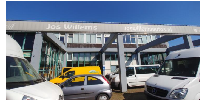
Figuur 5: Zuidgevel van bebouwing