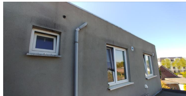
Figuur 8: Dakrand noordgevel van tweede verdieping