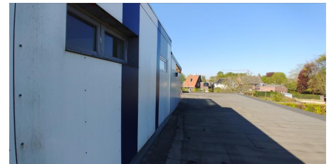
Figuur 9: Noordgevel van tweede verdieping