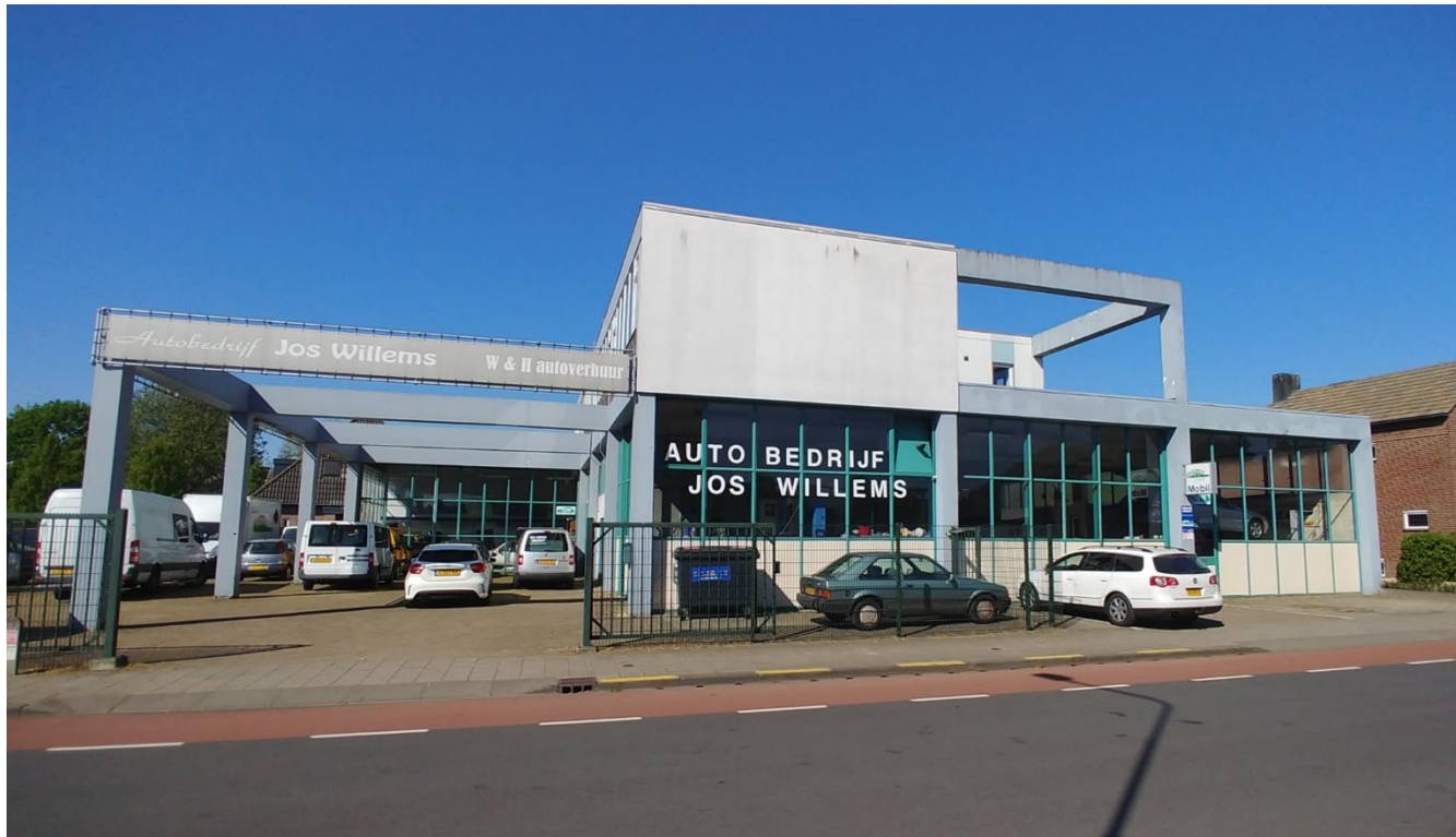
Figuur 4: Plangebied gezien vanuit het oosten, vanaf de Doolgaardstraat