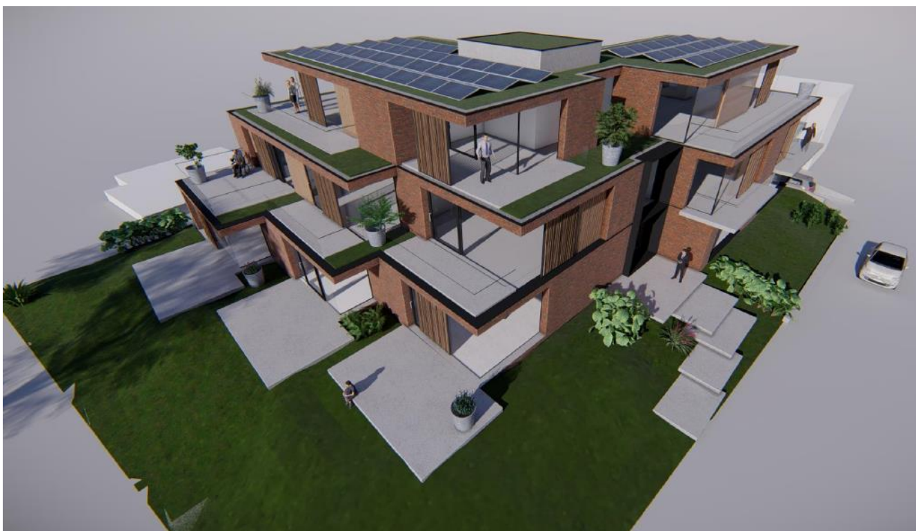
Figuur 3: Toekomstige situatie plangebied