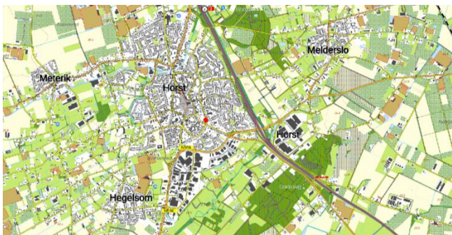
Figuur 1: Topografische kaart ligging plangebied (1:25.000)

Alle huidige bebouwing binnen het plangebied zal worden gesloopt. De initiatiefnemer is voornemens een appartementencomplex met 12 levensloopbestendige appartementen te realiseren. Onder het appartementencomplex, in de kelder, zal een parkeergarage, bestaande uit 21 parkeergelegenheden, en berging worden gecreëerd. Een collectief dakterras zal in het noordwesten boven de parkeerruimte worden aangelegd. Het complex zal 2 verdiepingen hoog worden. Figuur 3 geeft een beeld van de toekomstige situatie.