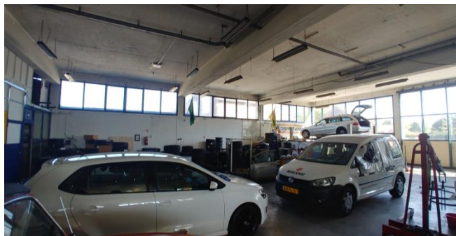
Figuur 7: Binnenzijde bebouwing, waar momenteel een autobedrijf gevestigd is