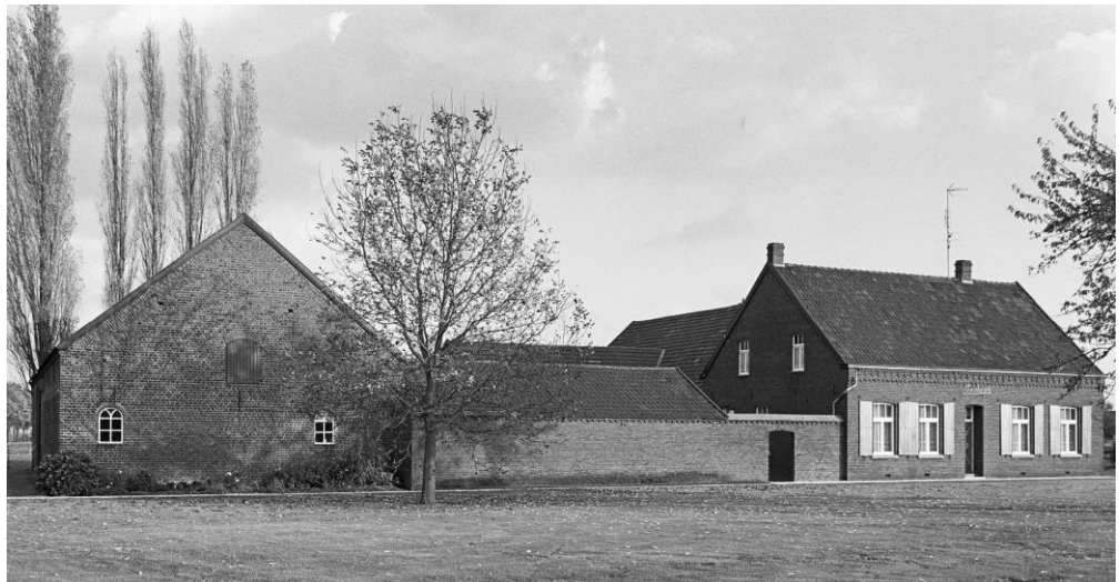
Afbeelding 7. Boerderij Steinhagen in 1979. Deze foto laat duidelijk het imponerende front van de boerderij naar de weg zien.

Bij de oude boerderij Steinhagen was het erf tussen de beide vleugels goeddeels open. In de nieuwe situatie is het erf aan de westzijde afgesloten door een muur, met aan de erfzijde een gereedschapsberging. Deze afsluiting is niet alleen functioneel, maar heeft ook een esthetische functie, omdat ze de boerderij een gesloten front geeft en daarmee vanaf de weg een voornaam aanzien. Aan de oostzijde is het erf gedeeltelijk afgesloten door een varkensstal, dwars op de gevel van de koestal.