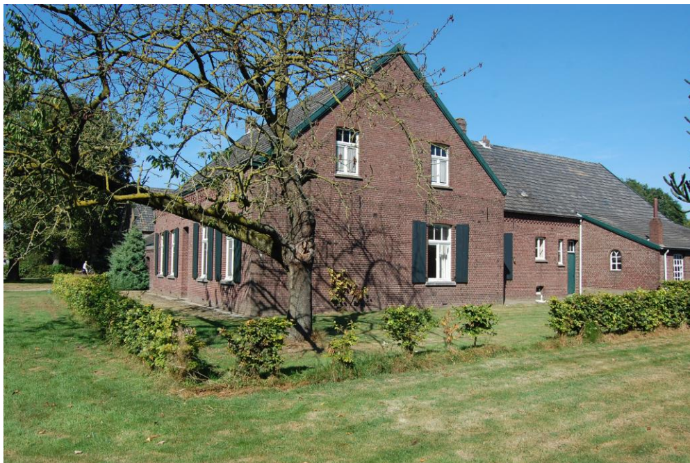
Afbeelding 1. Boerderij Steinhagen. (Foto Thijs Pubben, 30 augustus 2016.)