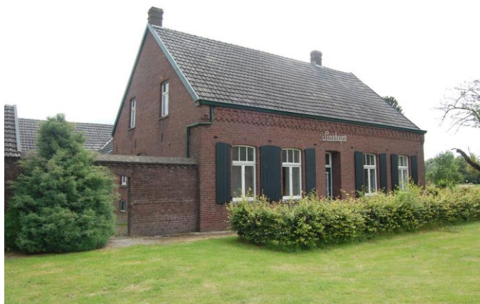
Afbeeldingen 11. De voorgevel van boerderij Steinhagen is symmetrisch ingedeeld met een centraal geplaatste voordeur tussen twee keer twee vensters.

Op deze foto zijn ook het metselwerk in kruisverband, het siermetselwerk, de ontlastingsbogen boven de muuropeningen, het uitspringende metselwerk onder de dakranden en het dominerende venstertype zichtbaar.