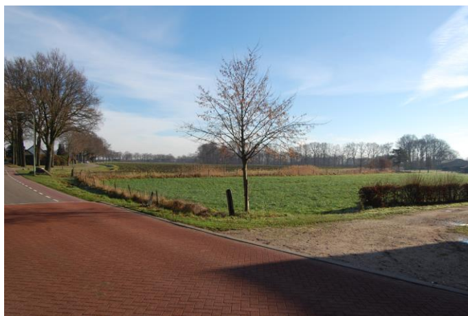
Afbeelding 12. Het landschap ten oosten van de boerderij Steinhagen. In de verte – rechts van de Dorperdijk – Steinhagens Veld. Het grasland op de voorgrond was vroeger hooiland bij de boerderij. Aan het bruine vegetatie die een deel van het hooiland omzoomd, is de ligging van een deel van de vroegere omgrachting herkenbaar.

De landbouw heeft in belangrijke mate bijgedragen aan de totstandkoming van het cultuurlandschap op de Noord-Limburgse zandgronden. Dat maakt de boerderijen van waaruit het land werd bewerkt en vormgegeven tot belangrijke elementen in dat landschap. Dat geldt ook voor de boerderij Steinhagen, niet in de laatste plaats omdat het Steenhagens Veld, waar het meeste akkerland lag dat bij de boerderij hoorde, tot op de dag van vandaag als veld herkenbaar is.