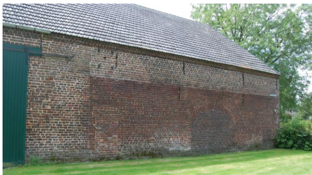
Afbeelding 10. De noordgevel van het schuurgebouw van de boerderij Steenhagen. Duidelijk zichtbaar zijn de gevel van het vroegere voorname huis (links), de muur van de later aangebouwde stal met de dichtgemetselde stalpoort voor de mestkar en het nieuwere metselwerk uit oude stenen, om de stal op te hogen toen die tot schuur werd herbestemd. (Foto Thijs Pubben, 4 juli 2016.)

Voor de ombouw van het woonstalhuis tot schuur zijn de zolder en de verdieping van het huis verwijderd en zijn binnenmuren en balklagen gesloopt. Bovendien is toen ook de muur gesloopt die woonhuis en stal van elkaar scheidde, oorspronkelijk een buitenmuur van het stenen huis. Om voldoende berg- en inrijruimte te bieden is een schuur in de regel hoger dan een stal. Daarom is het stalgedeelte van het oude woonstalhuis opgehoogd. Daarvoor lijken stenen van het oude huis te zijn hergebruikt, vandaar dat in de noordgevel van de huidige schuur oude bakstenen boven nieuwer metselwerk voorkomen.