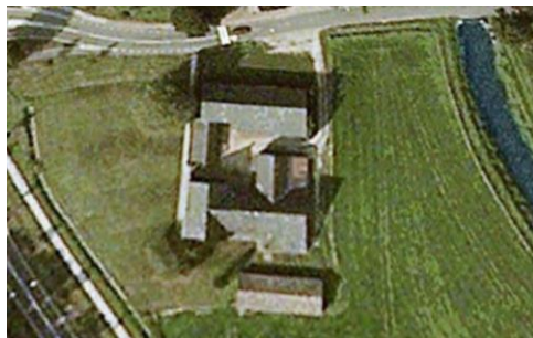
Afbeelding 6. Boerderij Steinhagen vanuit de lucht. De structuur van de boerderij is duidelijk zichtbaar, met schuur en woonstalhuis parallel aan elkaar. Verder herkenbaar het dwarsgeplaatste woonhuis en de gereedschapsberging en varkensstal die het erf aan de west- en oostzijde afsluiten. Apart gelegen aan de zuidzijde van de boerderij een in de jaren zestig gebouwde kippenschuur.

Begin vorige eeuw voldeed boerderij Steinhagen niet langer aan de eisen, waarna omstreeks 1926 werd besloten tot ver- en nieuwbouw. De oude schuur werd afgebroken en op die plaats is – in een T-vorm – een nieuw woonstalhuis gebouwd. Het woonstalhuis van de oude boerderij – het voorname huis en de aangebouwde stal – is omgebouwd tot schuur. De nieuwe stalvleugel en de schuur kwamen opnieuw parallel aan elkaar te liggen.