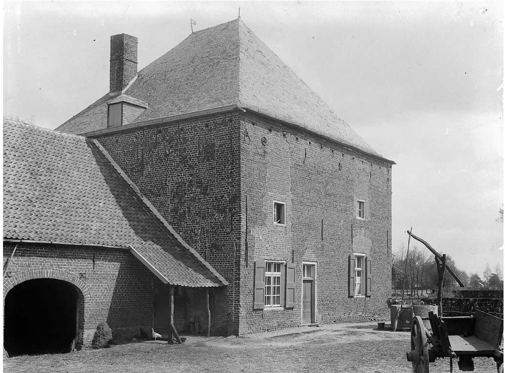
Afbeelding 5. Huis Steenhagen gefotografeerd door C.J. Steenbergh tussen 1910 en 1926. (Beeldbank RCE.)

Uit het begin van de twintigste eeuw is een foto van C.J. Steenbergh bekend, gemaakt voor het tijdschrift Buiten . Ze is opgenomen in de collectie van de Rijksdienst voor het Cultureel Erfgoed (RCE) 3 . Het is voor zover bekend de enige afbeelding van het dan al lang tot boerderij herbestemde Huis Steenhagen. Op de foto zijn de jaartalankers te zien die het bouwjaar 1659 aangeven. Gezien de op de foto zichtbare bouwkundige details, zoals de ontlastingsbogen boven de ramen, is dat bouwjaar aannemelijk.