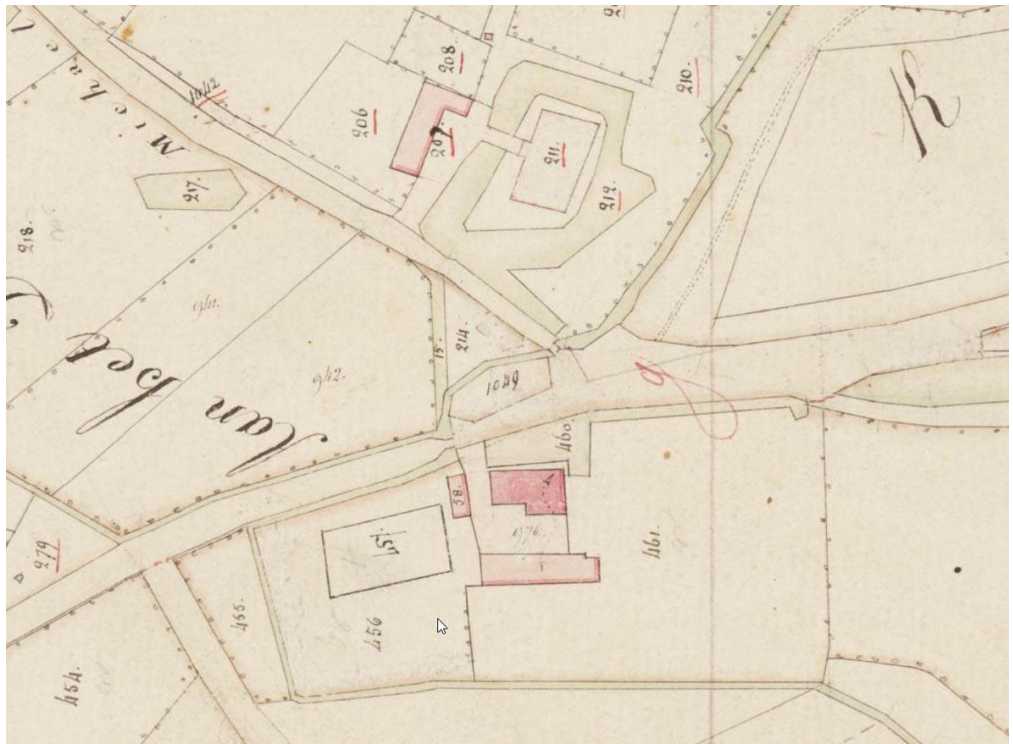
Afbeelding 4. Huis Steenhagen/boerderij Steinhagen op het kadastrale minuutplan H1 van de kadastrale gemeente Sevenum. (Schaal 1:2.500; het detail is noord-georiënteerd.)