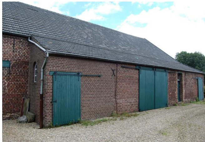
Afbeeldingen 8 en 9. Links de oostelijke kopgevel van de schuur, met bouwsporen van het voormalige woonhuis en de in deze gevel hergebruikte ankers die eerst in de naar het zuiden gerichte voorgevel van Huis Steenhagen waren gebruikt. Rechts de naar het erf gerichte zuidgevel van de schuur. Behalve oud metselwerk is hier weinig van de oorspronkelijke gevel bewaard gebleven. (Foto's Thijs Pubben, 4 juli 2016.)

Voor de ombouw van het woonstalhuis tot schuur zijn de zolder en de verdieping van het huis verwijderd en zijn binnenmuren en balklagen gesloopt. Bovendien is toen ook de muur gesloopt die woonhuis en stal van elkaar scheidde, oorspronkelijk een buitenmuur van het stenen huis. Om voldoende berg- en inrijruimte te bieden is een schuur in de regel hoger dan een stal. Daarom is het stalgedeelte van het oude woonstalhuis opgehoogd. Daarvoor lijken stenen van het oude huis te zijn hergebruikt, vandaar dat in de noordgevel van de huidige schuur oude bakstenen boven nieuwer metselwerk voorkomen.