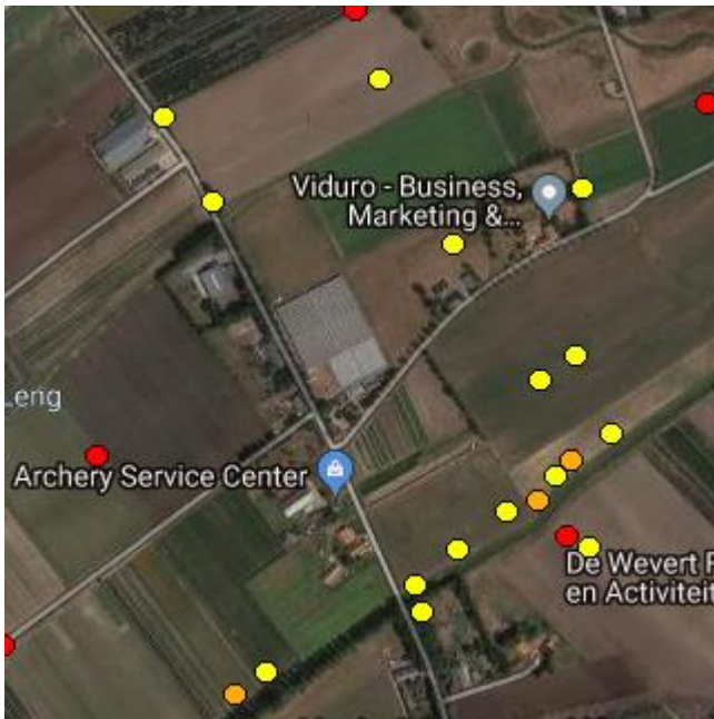
Afbeelding 5, Beschermde broedvogels 3e kartering.

In het plangebied zijn geen rode lijst waarneming gedaan en er zijn tevens geen waarnemingen gedaan van beschermde soorten en planten. De locatie is reeds jaren in gebruik voor agrarische doeleinden.