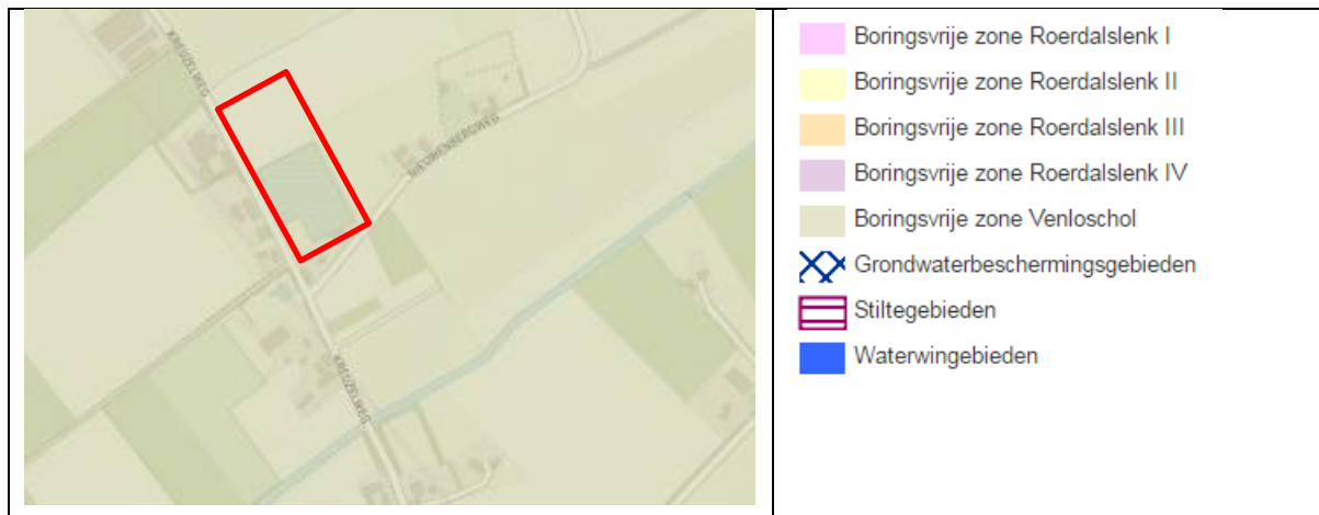
afbeelding 3, uitsnede provinciale omgevingsverordening met aandachtsgebieden.