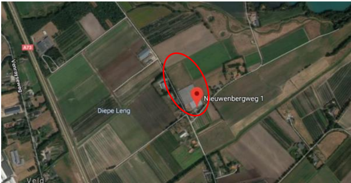
afbeelding 1, ligging plangebied

De projectlocatie is gelegen in het buitengebied van de gemeente Horst aan de Maas ten noorden van de kernen Horst en Melderslo. De locatie ligt in een gebied dat voornamelijk in agrarisch gebruik is.