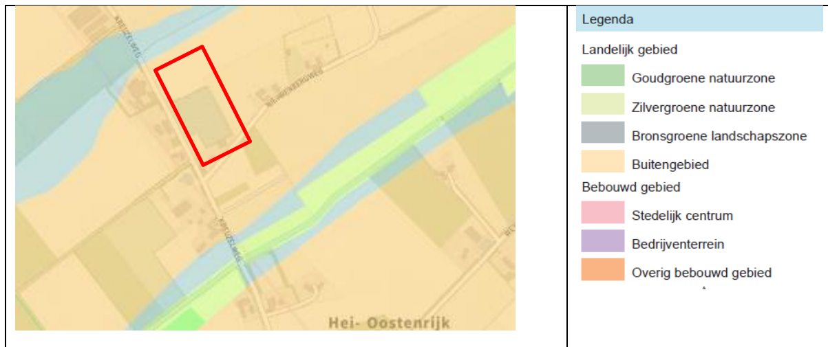
afbeelding 2, POL kaart1, zonering Limburg

behoud van een goede landbouwstructuur, veerkrachtige watersystemen en robuuste natuurnetwerken.