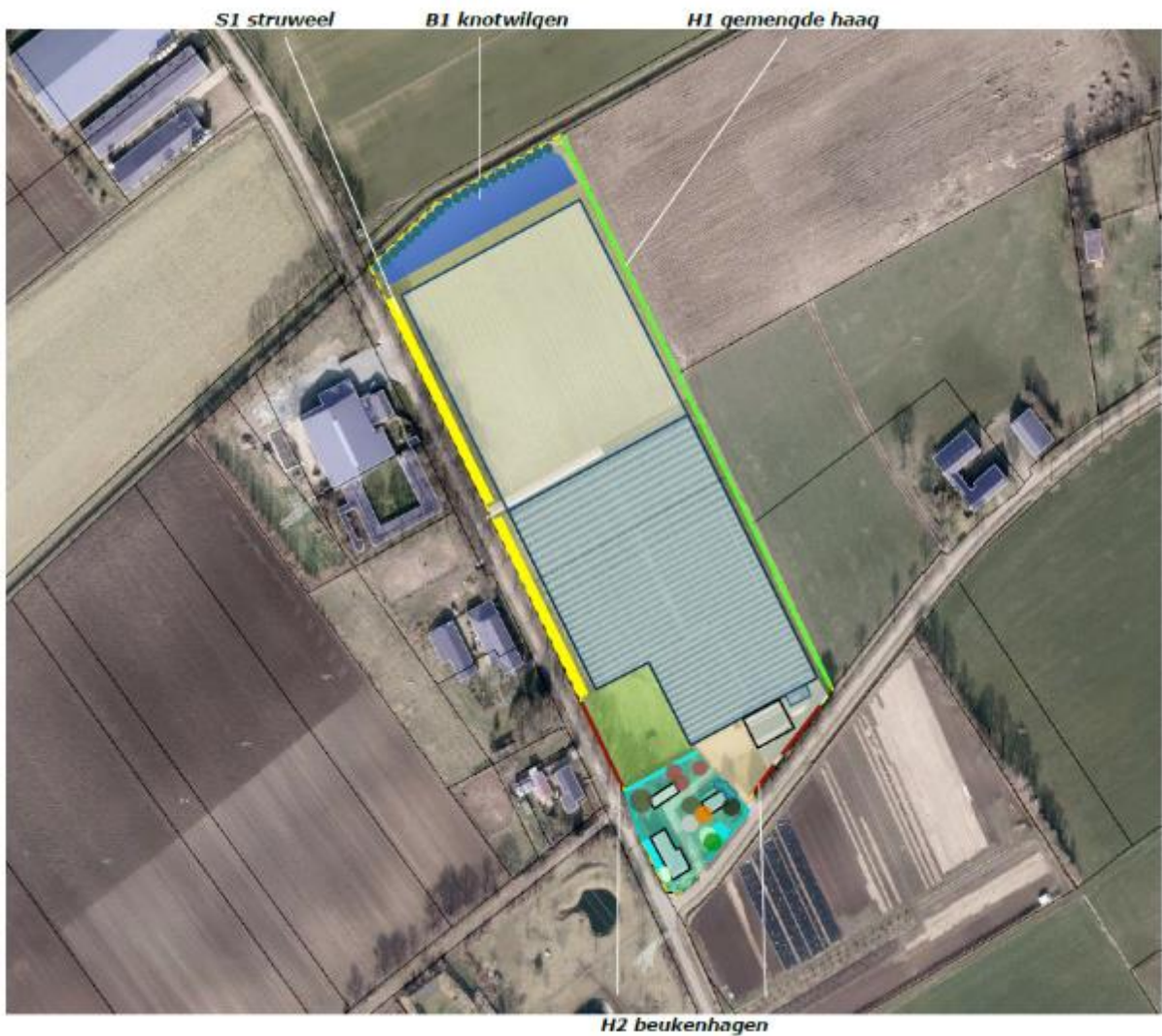
afbeelding 4, uitsnede landschappelijke inpassing

Met het landschappelijk inpassingsplan wordt voldaan aan de eisen die zijn gesteld in het gemeentelijk Kwaliteitsmenu