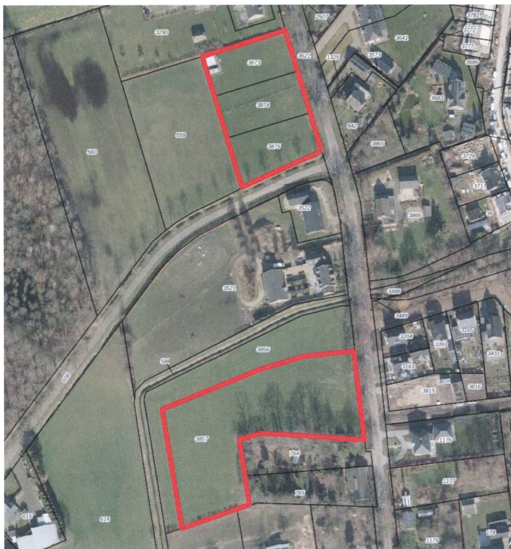
Figuur 4.1. Ligging van het plangebied (rood omlijnd).

Het noordelijk deelgebied bestaat uit weiland met in de noordwesthoek een stalletje en een container. In het weiland groeien algemeen voorkomende plantensoorten als smalle weegbree, grote brandnetel, kleine brandnetel, paarse dovennetel, witte dovennetel, veldkers, kluwenhoornbloem, scherpe boterbloem, vogelmuur, winterpostelein en paardenbloem. Het zuidelijk deelgebied bestaat uit een maisakker. Naast enkele hierboven genoemde plantensoorten groeien hier verder soorten als witte klaver, veldzuring, vogelwikke, hondsdraf, fluitenkruid, heermoes en ridderzuring.