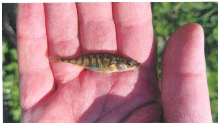
Figuur 4.2.2. De sloot aan de noord- en westzijde van het zuidelijke deelgebied bevat driedoornige stekelbaars.

Water dat als voortplantingshabitat voor amfibieën kan dienen, is aanwezig in de vorm van een sloot aan de noord- en westzijde van het zuidelijke deelgebied. Deze is bemonsterd, waarbij enkel driedoornige stekelbaars is aangetroffen (zie figuur 4.2.2). Door de aanwezigheid van vis (vissen eten amfibieëneieren en -larven) en doordat het aanwezige biotoop ongeschikt is als habitat voor streng beschermde amfibieënsoorten, zijn dergelijke soorten niet te verwachten. Het is wel mogelijk dat enkele algemene amfibieënsoorten als de gewone pad delen van het plangebied als landhabitat gebruiken. Voor reptielen zijn er in het plangebied geen geschikte opwarmplaatsen aanwezig, zoals stenen, muurtjes of woelplekken van hoefdieren. De vegetatie in het plangebied is soortenarm en er zijn geen nectarplanten en luwte aanwezig waardoor vlinders niet in het plangebied te verwachten zijn. Overige soortgroepen, die beschermd zijn onder de Wnb, zijn eveneens niet te verwachten in het plangebied. Tabel 4.2 geeft een overzicht van de beschermde soorten die (mogelijk) voortplantingsplaatsen en rustplaatsen in het plangebied hebben.