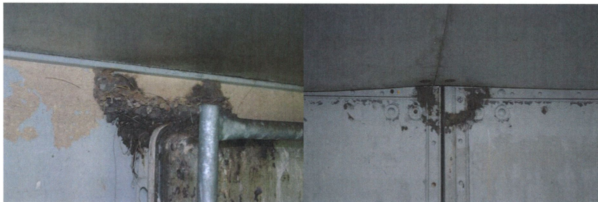
Figuur 4.2.1. In het stalletje zijn de oude restanten van twee boerenzwaluwnesten aanwezig.

Het stalletje en de container in de noordoosthoek van het noordelijke deelgebied zijn volledig enkelwandig. Huismus- en gierzwaluwnesten en vleermuisverblijven zijn hier afwezig. In het stalletje zijn wel meerdere jaren oude restanten van twee boerenzwaluwnesten aanwezig (zie figuur 4.2.1). Steenmarteruitwerpselen zijn afwezig.